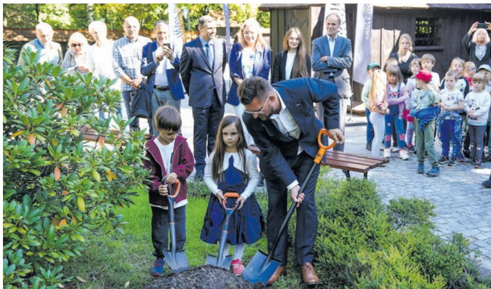
W zakopaniu kapsuły czasu prezydentowi pomogły katowickie przedszkolaki

Park cały czas pięknieje. Od wiosny najmłodsi mieszkańcy korzystają z wyremontowanego placu zabaw Dzieciniec. Dobiegł końca remont drewnianego kościółka św. Michała Archanioła wraz z jego otocze-