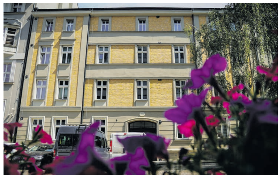
Opolska 13 to kolejna odnowiona zabytkowa kamienica w śródmieściu Katowic

W ubiegłym roku zakończył się remont kamienicy przy ul. Opolskiej 13. Dzięki