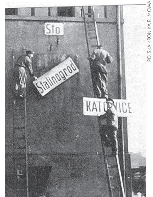
Powrót do nazwy Katowice

Katowice jako Stalinogród przetrwały do 1956 r. W czasie październikowej odwilży