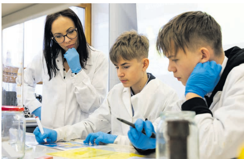
Pokazowa lekcja chemii w Pałacu Młodzieży

Program „Klimatyczne Katowice” ma pomóc młodym ludziom zrozumieć wpływ degradacji środowiska przyrodniczego na ich przyszłość, rozszerzyć ich wiedzę, świadomość i umiejętności w obszarze edukacji o klimacie, a przede wszystkim zbudować zaangażowanie i poczucie sprawstwa przeciwdziałającego skutkom globalnego ocieplenia. – Edukacja klimatyczna jest częścią edukacji ekologicznej, wychodzi ona jednak poza poję-