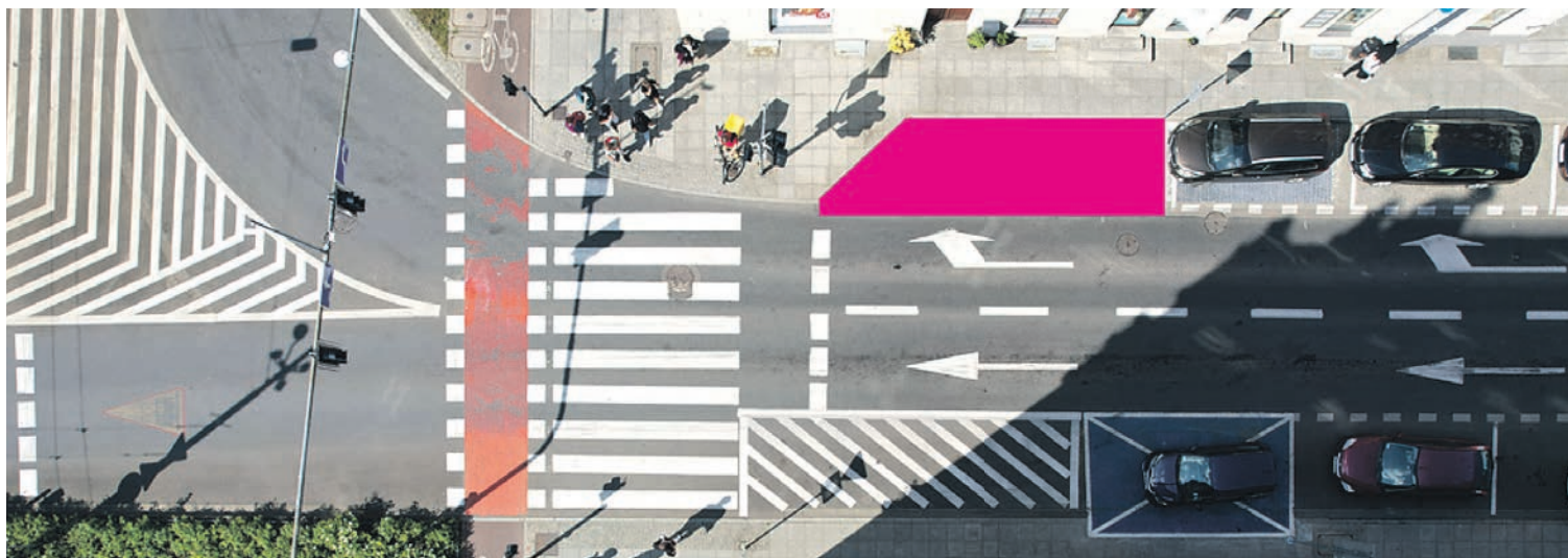
W takich miejscach według przepisów samochody parkują zbyt blisko przejść dla pieszych. Przykład skrzyżowanie al. Korfatego z ul. Moniuszki

W lipcu rada miasta niemal jednogłośnie podjęła decyzję o ustanowieniu nowej strefy płatnego parkowania w strategicznych częściach miasta. To krok w kierunku lepszej organizacji ruchu, ograniczenia wjazdu pojazdów z innych miast do centrum Katowic oraz poprawy dostępności miejsc parkingowych dla mieszkańców. Aby poprawnie wyznaczyć miejsca postojowe,