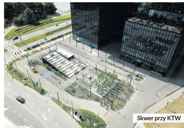
Skwer przy KTW

Inwestycje te wchodziły w skład przedsięwzięcia strategicznego Zielona Strefa Nauki. Jego koncepcję opracowały wspólnie: Uniwersytet Śląski, Uniwersytet Ekonomiczny, Politechnika Śląska, Górnośląsko-Zagłębiowska Metropolia oraz Miasto Katowice. Zamierzenie dotyczy inwestycji w infrastrukturę akademicką obszaru bulwarów Rawy i terenów przyległych do uczelni oraz uruchomienie nowych funkcji badawczo-wdrożeniowych.