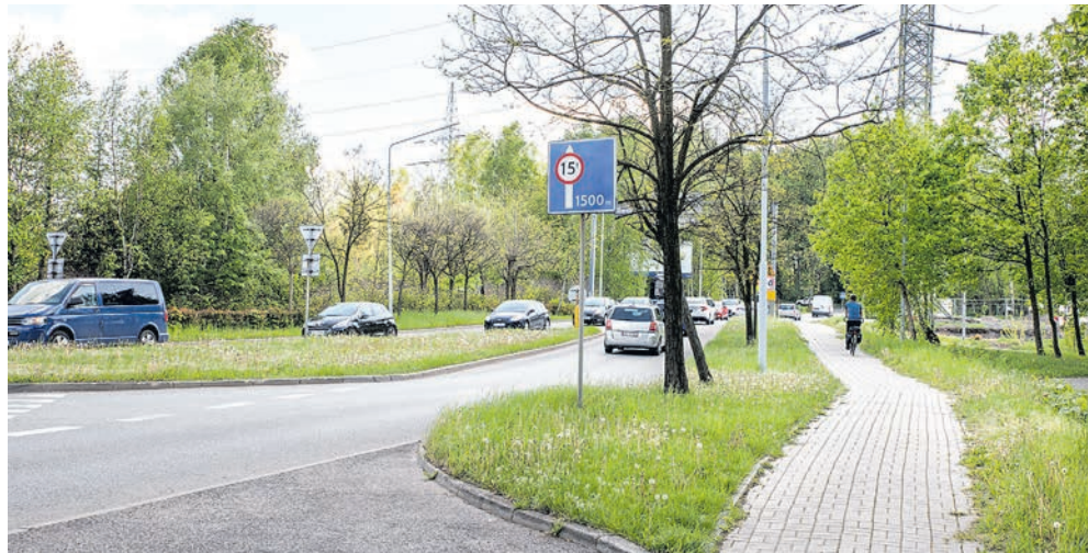
Dokumentacja projektowa będzie zawierać również rozwiązania dla pieszych, rowerzystów i komunikacji zbiorowej

Nowa trasa będzie się łączyć z planowanym rondem, które powstanie na skrzyżowaniu ulic Bocheńskiego i Załęska Hałda. Zosta-