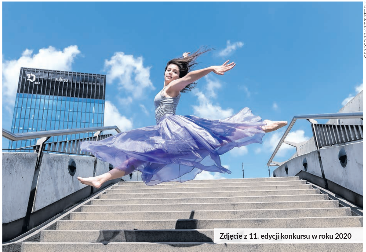
Zdjęcie z 11. edycji konkursu w roku 2020

Szczegóły na temat konkursu są przedstawione w regulaminie,