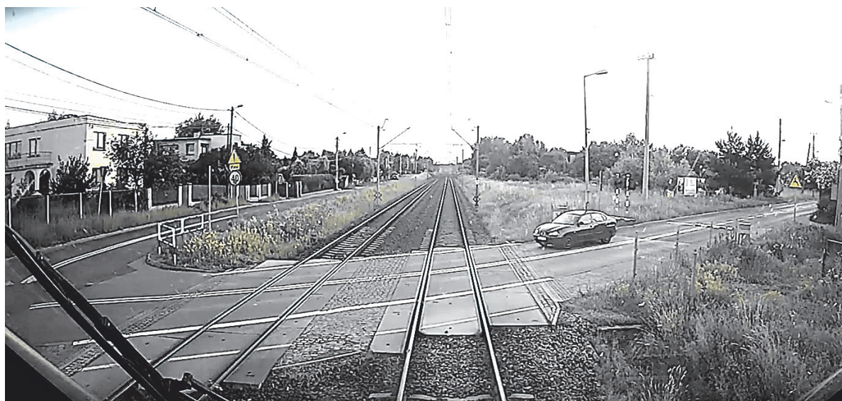
Zdarzenie na przejeździe kolejowo-drogowym na ul. Słonecznikowej w Katowicach

Do takich sytuacji dochodzi najczęściej na przejazdach kategorii B, czyli takich, które są wyposażone w automatyczne systemy zabezpieczania przejazdu. Pociąg, który zbliża się do przejazdu, mija czujnik uruchamiający cykl zamykania rogatki. Rozpoczyna się on od nadawania na sygnalizacji naprzemiennie migającego czerwonego światła, zakazującego wjazdu na przejazd. Dopiero po czasie są opuszczane drągi rogatkowe. Jednak kierowcy bywają nieodpowiedzialni i nie zwracając uwagi na migające czerwone światła, decydują się na przejechanie przez przejazd. Główną motywacją jest przede wszystkim pośpiech i przekonanie, że zdążą przedostać się na drugą stronę torów do czasu