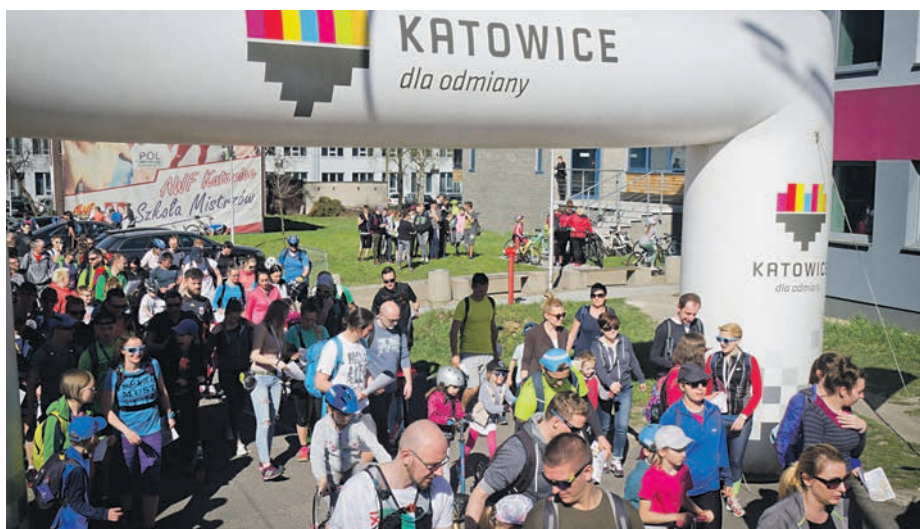
W ostatnim miejskim rajdzie udział wzięło kilkaset osób

Na czym będzie polegała zabawa? Kolarzycie biegi na orientację czy też harcerskie podchody? Imprezy, na których otrzymywało się mapę z zaznaczonymi punktami i trzeba było je odnaleźć w terenie? Tak właśnie będzie wyglądała gra: mapa + punkty kontrolne, do których należy dotrzeć (dopuszczalna możliwość korzystania z GPS-u). Ale to nie wszystko... W niektórych punktach kontrolnych uczestnicy będą musieli zmierzyć się z zadaniami. Będą to np.: zadanie linowe,