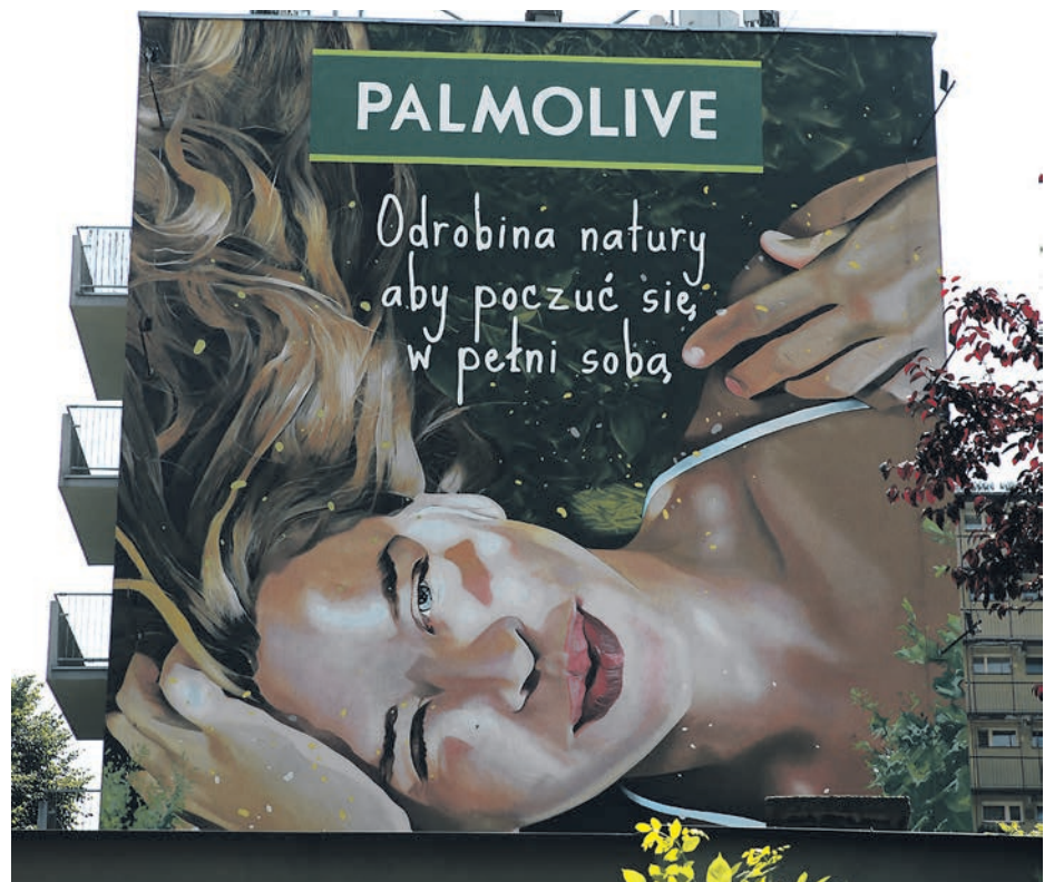
Reklamy pojawiły się na ulicach Francuskiej i Korfantego w ubiegłym roku

W przestrzeni Katowic Szwedzki komentuje bieżące wydarzenia, okoliczną architekturę, ale także promuje sieć sklepów „Społem”. W roku 2020 popularna na Śląsku postać pojawiła się po raz pierwszy w wielkim formacie. Przy ulicy Chorzowskiej Szwedzki zachęcał do korzystania z nowej oferty online hasłem „Nie ma że za SPOŁEM, od teraz kupujecie też w necie”. Na stałe stał gościem na wielu katowickich sklepach sieci oraz na samoobsługowym automacie ustawionym przy galerii Skarbek, gdzie hasło „świątek, piątek i... niedziela?”