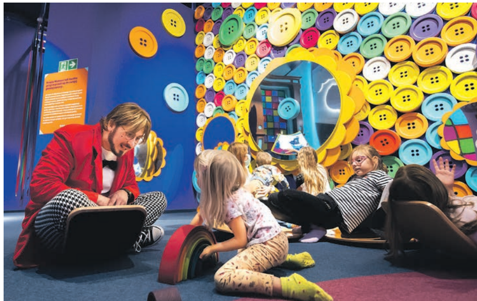
Bajka Pana Kleksa to nie tylko Wytwórnia Kultury, Nauki i Zabawy, ale też – na co wskazuje wyróżnienie zdobyte w konkursie Katowizje – firma społecznie odpowiedzialna

Zaangażowanie firm w życie lokalnej społeczności nie jest niczym nowym. Krótko mówiąc, biznes to ludzie, bez których nic nie może się udać. Jeśli możemy dać coś od siebie, to dajemy, bo uważamy, że dzięki temu świat staje się lepszy. Akcje charytatywne, kampanie społeczne, organizowanie różnych wydarzeń poświęconych np. ekologii, ulepszanie warunków pracy dla pracowników – to wszystko ma sprawić, by z jednej strony komuś pomóc, ale z drugiej, by uczyć się wzajemnego szacunku, tolerancji i ciekawości świata.