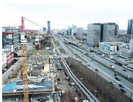
Budowa biurowca Craft