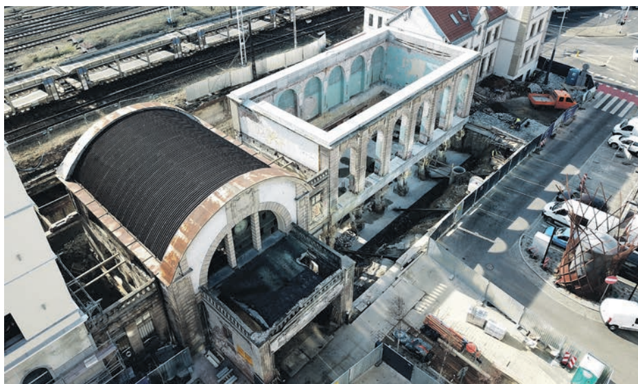
Renowacja budynków przy ul. Dworcowej

Międzynarodowa firma doradca EY wskazuje, że sektor nowoczesnych usług biznesowych nie tylko swoimi ofertami wpływa na rynek pracy. Wraz z rozwojem działalności tego typu przedsiębiorstw powstają stanowiska zatrudnienia osób pośrednio związanych z ich funkcjonowaniem (np. współpraca, obsługa). W zeszłym roku wyliczono, że 22,9 tys. istniejących miejsc pracy w katowickich centrach usług