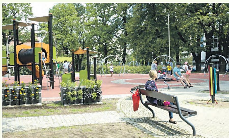
W Lokalnym Programie Rewitalizacji ujęto m.in. park Bogucki. Na zdjęciu plac zabaw w parku