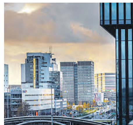
Od 2016 roku w Katowicach powstało 30 nowych centrów usług

Katowice i GZM zajmują wysokie pozycje rankingowe w zakresie dostępności puli talentów, dostępności komunikacyjnej, współpracy z lokalnymi uniwersytetami oraz pod względem ogólnej oceny miejsca prowadzenia działalności. – Warto