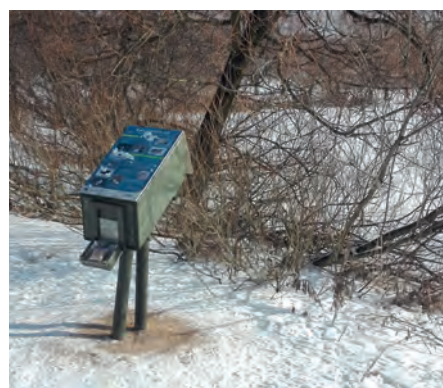
Kaczkomaty w Dolinie 3 Stawów powstały dzięki budżetowi obywatelskiemu

Osoby, które są zainteresowane darmowym pozyskaniem ziaren, mogą skorzystać z trzech „kaczkomatów”, które znajdują się przy stawach Łąka i Kajakowym w Katowickim Parku Leśnym. Powstanie kaczkomatów było możliwe dzięki inicjatywie mieszkańców miasta, którzy wybrali ten projekt do realizacji w ramach budżetu obywatelskiego w 2017 roku. Kaczkomaty są na bieżąco uzupełniane