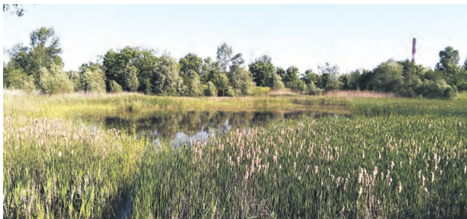
MIĘDZY ULICAMI LEOPOLDA, BOHATERÓW MONTE CASSINO I WIERTNICZĄ POWSTANIE PARK. OBECNIE PRZYGOTOWYWANA JEST JEGO KONCEPCJA

Pierwszy miejscowy plan zagospodarowania przestrzennego dotyczy obszaru położonego w rejonie ulicy Ceglanej. Obejmuje obszar rozciągający się od ulicy