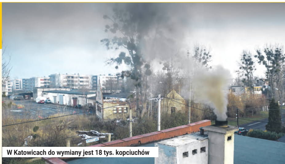
W Katowicach do wymiany jest 18 tys. kopciuchów