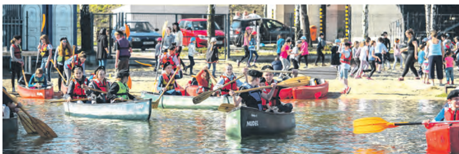
FOT. 10. HARCERSKA DRUŻYNA ŻEGLARSKA

– By harcerze i mieszkańcy Katowic mogli w pełni korzystać z potencjału tego miejsca,