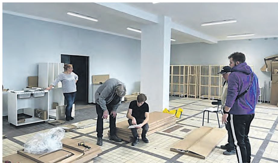
Idea sklepu socjalnego jest pomaganie osobom, które znalazły się w trudnej sytuacji życiowej. Na zdjęciu – przygotowania do otwarcia placówki przy ul. Tysiąclecia