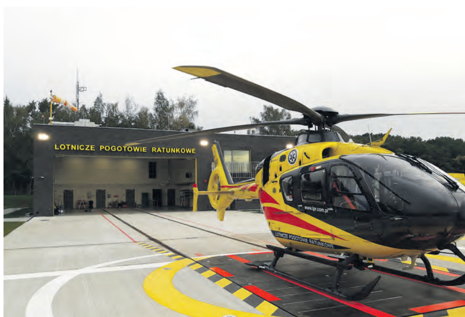
Po 13 latach śmigłowiec ratowniczy wrócił na lotnisko w Katowicach-Muchowcu. Załoga już rozpoczęła dyżur w nowej siedzibie