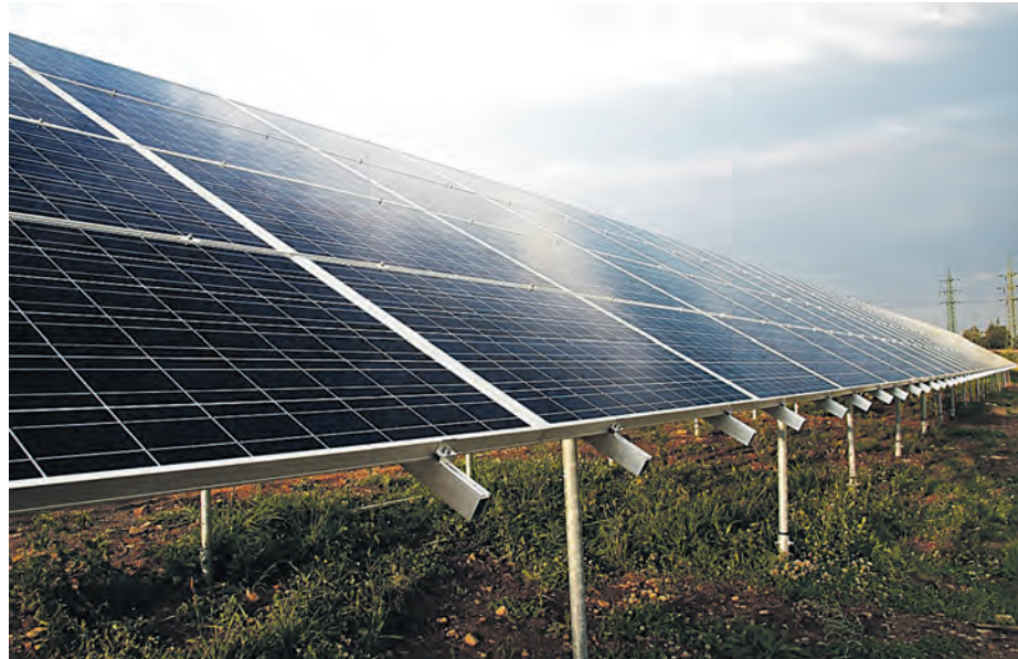
Farma fotowoltaiczna MPGK ma powstać na dawnym składowisku odpadów

Czym są farmy fotowoltaiczne? To elektrownie słoneczne, powstałe w specjalnie wydzielonych strefach terenu z rozlokowanymi instalacjami paneli zamieniających energię słoneczną w energię elektryczną. Po zainstalowaniu niezbędnej infrastruktury, czyli paneli, inwerterów, elementów konstrukcyjnych, oraz po wykonaniu przyłącza, prąd pozyskiwany jest wprost ze słońca, stając się w pełni darmową