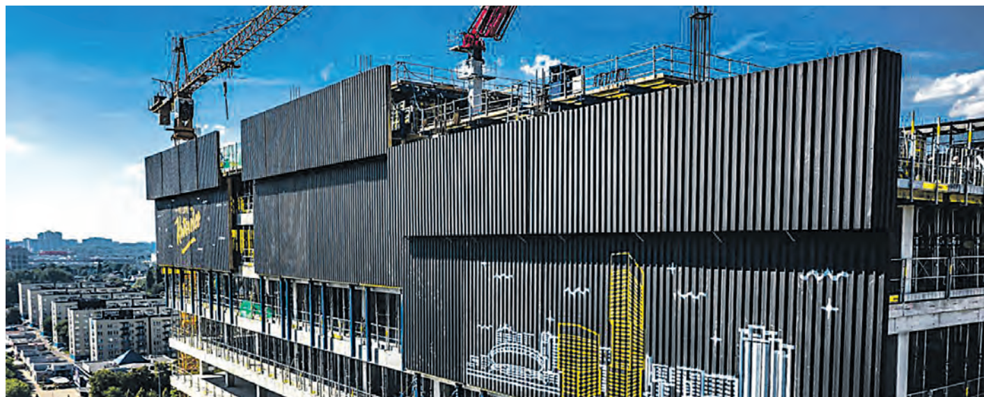
Katowicki rynek powiększył się w 2020 r. o ponad 30 000 m 2 dzięki temu całkowite zasoby powierzchni biurowej wyniosły niemal 560 000 m 2 . Aktualnie w realizacji znajduje się ponad 200 000 m 2 , z czego większość projektów ma zaplanowaną datę ukończenia budowy na 2021 r. („Polska – rynek biurowy i inwestycyjny w III kwartale 2020 r.”). Na zdjęciu - biurowiec KTW II w budowie

– Niski współczynnik pustostanów w Katowicach wynika z wciąż nienasyconego w pełni rynku powierzchni biurowych. Dopiero w ostatnich latach nastąpił dynamiczny wzrost inwestycji biurowych dostarczających nowoczesną powierzchnię klasy A. Jednocześnie Katowice stały się atrakcyjnym rynkiem dla zagranicznych firm sektora BDO, SSC, R&D oraz IT. Katowice są zdominowane przez sektor nowoczesnych usług biznesowych, czyli firmy stanowiące część globalnych korporacji, które przez swoją stabilność finansową są bardziej odporne na kryzysy i nie muszą szukać oszczędności „tu i teraz”, co jest