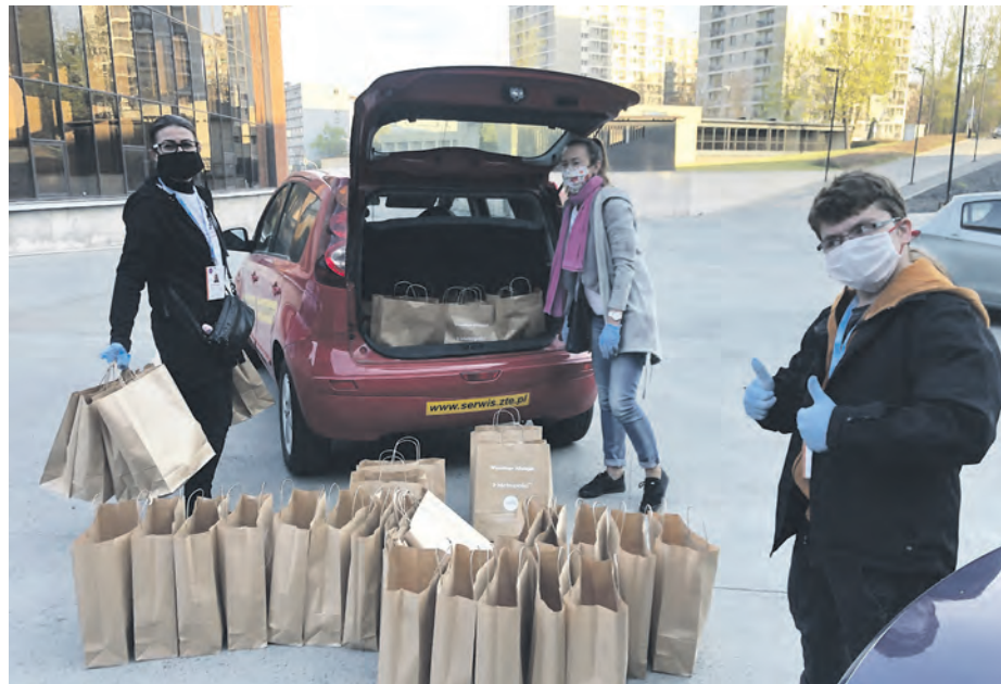
W tym roku z powodu epidemii również Śniadanie Wielkanocne dla Samotnych trafiło bezpośrednio do domów potrzebujących. W dostarczeniu posiłków pomogły dziesiątki wolontariuszy!

Akcja odbędzie się 24 grudnia w godz. od 7.00 do 15.00. Wszystko po to, by, pomimo trudnych dla nas wszystkich obostrzeń poczuć prawdziwe święta Bożego Narodzenia i podzielić się z samotnymi osobami nie tylko posiłkiem, ale też dobrym słowem i życzeniami. – Uczestniczyłam już zarówno w Wigilii, jak i w Wielkanocy dla Samotnych. Spotkałam tam wspólnych i kochanych ludzi. Nie mam już nikogo bliskiego, bo całe życie opiekowałam się rodzicami, którzy trzy lata temu zmarli w ciągu miesiąca. Dzięki fundacji poznałam innych samotnych i sobie pomyślałam, że już zawsze będziemy się spotykać, śpiewać kolędy. Jednak w tym roku musi być inaczej, choć też wyjątkowo: