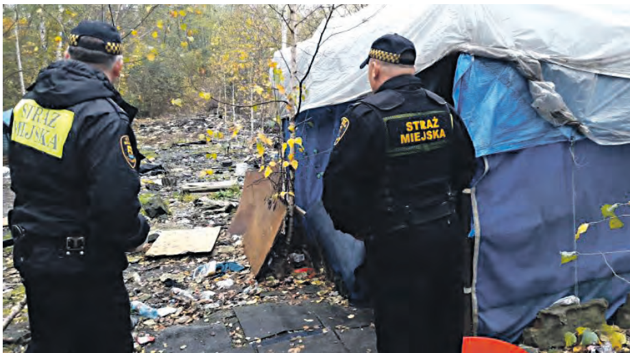
Wszystkim odnalezionym strażnicy proponują pomoc w przewiezieniu do noclegowni, rozmawiają i namawiają do skorzystania ze wsparcia

Pomoc osobom bezdomnym trwa cały rok, a strażnicy współpracują w tym zakresie z Miejskim Ośrodkiem Pomocy Społecznej oraz innymi instytucjami. Szczególnie w okresie jesienno-zimowym działania te są zintensyfikowane. – Przygotowaliśmy łącznie 406 miejsc noclegowych. Ponadto od