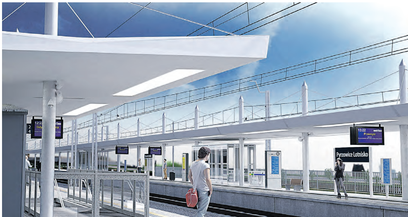
Stacja kolejowa Pyrzowice Lotnisko

W ramach inwestycji powstaną nowe przystanki: Miasteczko Śląskie Centrum, Mierzęcice, Zawiercie Kądziałów oraz dwuperonowa stacja Pyrzowice Lotnisko.