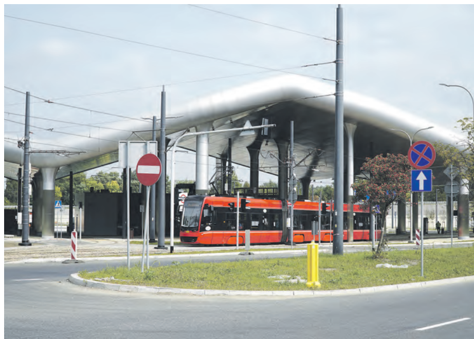
Centra przesiadkowe to szereg korzyści dla mieszkańców. Mogą np. zostawić tu samochód, a do centrum miasta podróżować szybko i komfortowo tramwajem

Pandemia koronawirusa w całej Polsce silnie uderzyła w transport publiczny.