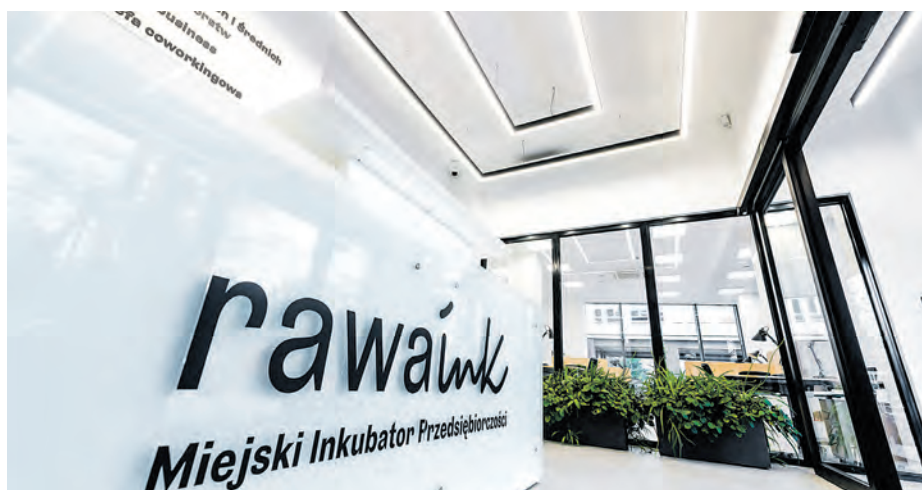
Głównym założeniem Miejskiego Inkubatora Przedsiębiorczości Rawa.Ink jest stworzenie inspirującej przestrzeni do wymiany poglądów, kreowania nowych, innowacyjnych pomysłów, sieciowania kontaktów

Inicjatywa Katowizji została podjęta przez Miejski Inkubator Przedsiębiorczości