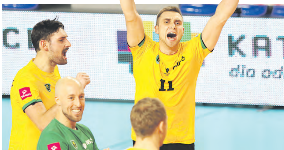
Katowiczanie mimo długiej przerwy w grze spowodowanej kwarantanną nie tracą formy i cieszą fanów waleczną postawą