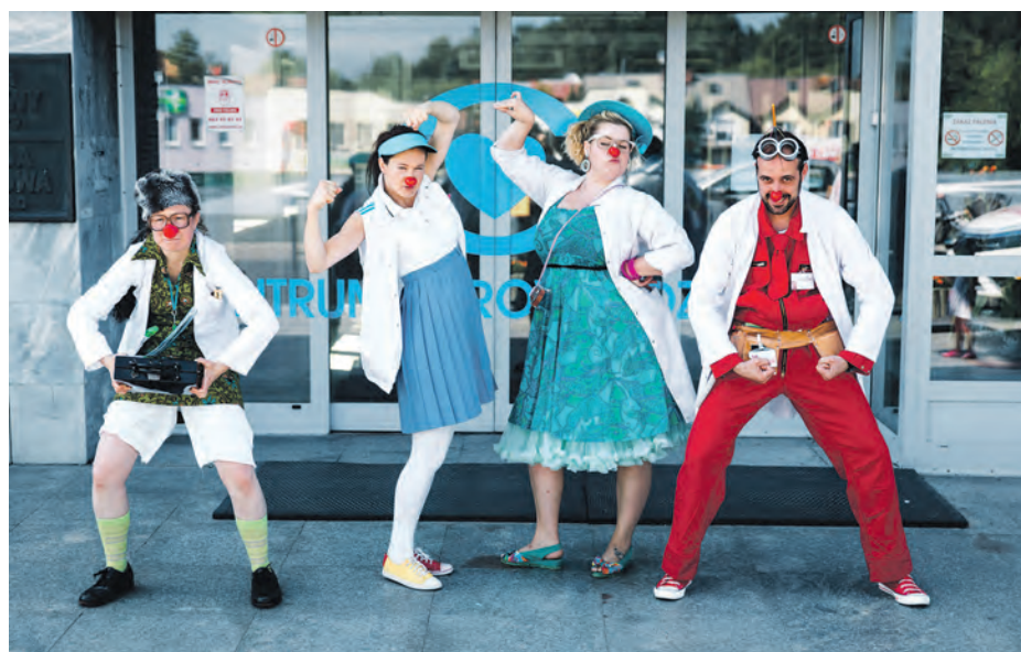
Artyści-klowni niosą radość dzieciom np. w szpitalach. Teraz – z konieczności – działają online

Spotkania są bezpłatne. Można z nich korzystać po wcześniejszym