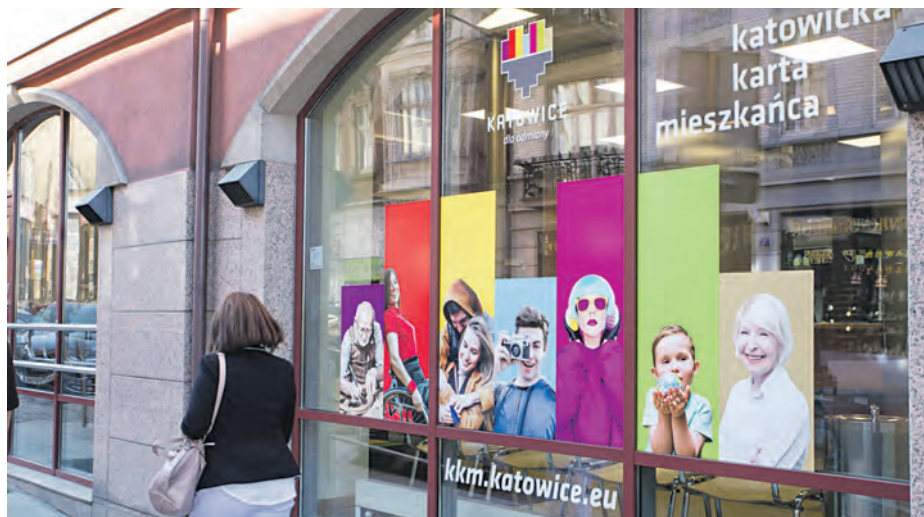
Zdecydowana większość mieszkańców wybrała KKM w aplikacji na telefon. Gdy chcemy ją w postaci plastikowej karty, musimy się udać do Biura Obsługi Klienta przy ul. Pocztowej 5

Głównym celem Katowickiej Karty Mieszkańca jest premiowanie osób, które są zameldowane w Katowicach i właśnie tutaj odprowadzają podatki. Idea jest prosta – jeżeli mieszkasz w Katowicach to powinieneś się tu zameldować i odprowadzać podatek. Jeżeli tego nie robisz, pieniądze z Twojego PIT-u płyną do innej gminy. – Katowicka Karta Mieszkańca ma w pierwszej kolejności umożliwiać mieszkańcom Katowic korzystanie ze zniżek na usługi instytucji kultury, sportu i rekreacji. Przykładowo w nowo wybudowanych basenach katowiczanie dzięki KKM płacą 8