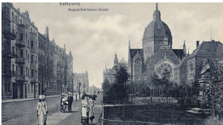
We wrześniu obchodzono 120-lecie synagogi. Niestety obiekt, który przez 4 dekady stał przy dzisiejszej ul. Mickiewicza, został zniszczony w czasie II wojny światowej

Żydzi niemieccy począwszy od 1922 r. emigrują na ogół do Niemiec, a napływają Żydzi polscy. To jest inna społeczność, nawet