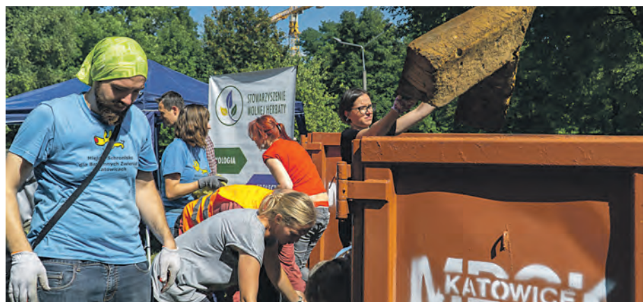
Mieszkańcy posprzątaли m.in. las w Dąbrówce Małej

SprzątaMyDzielnice to akcja organizowana w ramach projektu KATOobywatel, angażującego lokalną społeczność w dbanie o miasto. Tereny do sprzątania typują sami mieszkańcy, najpierw zgłaszając je do akcji, a następnie wybierając finałową piątkę w internetowym głosowaniu. W tym