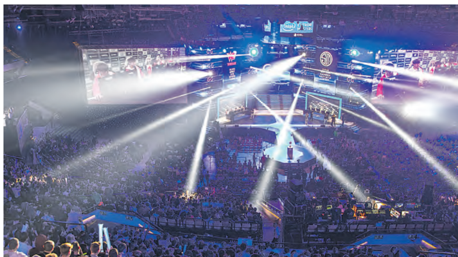
Dzięki Intel Extreme Masters stolica Górnego Śląska znalazła się na ustach fanów sportów elektronicznych z każdego zakątka świata

Jednak w obszarze gamingu w Katowicach dzieje się o wiele więcej niż tylko doroczny turniej IEM. Katowickie firmy realizują projekty badawcze w ramach Programu Operacyjnego Inteligentny Rozwój czy projektu „Game-In”. Obejmują one rozwiązania sztucznej inteligencji analizującej zachowania graczy, rozszerzonej rzeczywistości czy doskonalenie mechaniki gier. Działające w naszym mieście firmy z branży gamedev to między innymi notowana na GPW spółka Artifex Mundi SA, Anshar Studios SA – zatrudniająca 90 osób; obecny na NewConnect JUJUBEE SA, Incuvo SA, Spectral Games Sp. z o.o., Torquemada Games s.c., Rejected Games Sp. z o.o., Code Horizon Sp z o.o., DevHero.es czy Garmory Sp. z o.o. Sp. k. W Katowicach jedno ze swoich centrów ulokował również Keywords