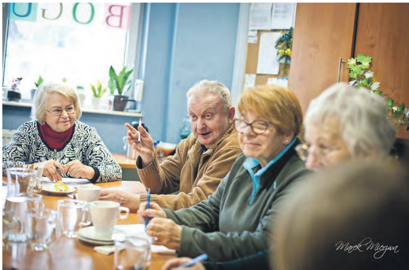
Zajęcia „Radość życia” cieszyły się dużym zainteresowaniem, dawały przestrzeń do zadawania trudnych pytań, momentami do sporów oraz bardzo osobistych wynurzeń

Dzięki temu projektowi można wypożyczać książki i audiobooki z Miejskiej Biblioteki Publicznej bez wychodzenia z domu. Adresatami projektu są seniorzy, którzy ukończyli 65 lat, osoby chore, niepełnosprawne, mające problemy z dotarciem do biblioteki ze względu na stan zdrowia – zameldowani na terenie Katowic, jak również zamieszkałi i płacący podatki w Katowicach. Aby wypożyczyć książkę, wystarczy zgłosić to telefonicznie bądź drogą elektroniczną na adres filii, do której zapisany jest czytelnik. Przy zgłoszeniu należy podać imię i nazwisko, numer telefonu, adres, wybrane tytuły lub swoje preferencje literackie. Bibliotekarz dostarczy do domu nieodpłatnie w umówionym terminie wybrane książki na okres do 30 dni, z możliwością przedłużenia terminu zwrotu. Jednorazowo można wypożyczyć do 5 pozycji. Zwrot odbywa się w miejscu zamieszkania czytelnika, po wcześniejszym