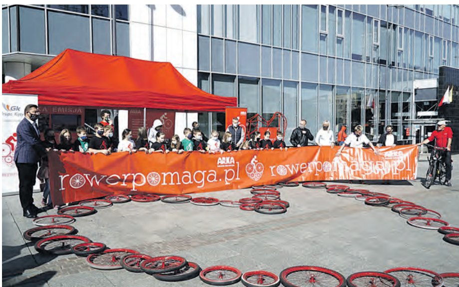
– Zeszlatoroczna akcja okazała się dużym sukcesem. Przejechaliśmy ponad 62 milionów kilometrów na rowerach i rozdaliśmy dzieciom z domów dziecka i świetlic środowiskowych 62 wymarzone rowery, a w sumie przez 5 lat – 283. W akcji kilometry wpisało ponad 70 tysięcy uczestników – mówią organizatorzy akcji. Na zdjęciu: inauguracja akcji na katowickim rynku

Ponownie zachęcamy katowiczanki do rywalizacji, a później do współpracy i wzajemnej pomocy. Za każdy milion kilometrów, który rowerzyści dodadzą do akcji „Rower Pomaga w Katowicach”, do organizacji społecznych działających w mieście trafią rowery. To już VI edycja akcji, w której zamieniamy rowery dla kilometrów na wymarzone rowery dla dzieci. W tym roku można je wpisywać na stronie rowerpomaga.pl lub na aplikacji Endomondo pod linkiem: endomondo.com/challenges/43967120 . Miasto Katowice kolejny raz wspiera projekt Fundacji Arka i namawia mieszkańców do rejestrowania przejechanych na rowerze kilometrów. – Naszym obowiązkiem jest wspieranie świetnych pomysłów. Akcja „Rower Pomaga” pozwala nam promować zdrowy, sportowy tryb życia. Warto podkreślić, że dla wielu uczestników dodatkową motywacją, by przejechać jak najwięcej kilometrów, jest chęć pomagania innym – podkreśla prezydent Marcin