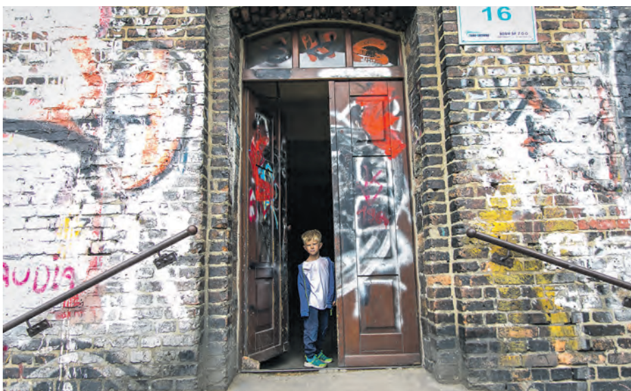
Dzieci i młodzież ze środowisk wykluczonych wprowadzamy w dorosłość, ucząc funkcjonowania społecznego, edukując, wyrównując różnice pomiędzy nimi oraz ich rówieśnikami. Uczymy pracy, odpowiedzialności i samodzielności – podkreślają przedstawiciele Domu Aniołów Stróżów

Dom Aniołów Stróżów to organizacja, która na stałe wpisała się już w pejzaż Załęża. Charakterystyczny budynek przy skrzyżowaniu ul. Gliwickiej i Bocheńskiego zna zapewne wielu. Dom Aniołów Stróżów, który na Śląsku i w Zagłębiu pomaga borykającym się z trudnościami dzieciom, młodzieży i ich rodzinom, na Załężu obecny jest od 1999 roku. W tym miejscu Stowarzyszenie prowadzi 3 świetlice terapeutyczne dla dzieci w wieku przedszkolnym, młodszym oraz starszym szkolnym, Socjoterapeutyczny Klub Młodzieżowy oraz prowadzi tzw. streetworking, czyli pracę na ulicach i podwórkach dzielnicy. W świetlicach i klubach wspiera dzieci i młodzież w wieku od 2,5 do 19 lat, które mają problemy z nawiązywaniem