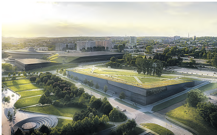
Mieszkańcy Katowic zyskają kolejne zielone miejsce do spacerów

Decyzja o budowie parkingu w Strefie Kultury wynikała m.in. z głosów mieszkańców Katowic, którzy skarżyli się, że dojeżdżając na wydarzenia organizowane w Spodku, NOSPR czy też Muzeum Śląskim, nie mieli gdzie zaparkować. Przestrzeń ta zamiast służyć gościom wspomnianych wydarzeń, stała się bezpłatnym, całodziennym parkingiem, z którego korzystały głównie osoby dojeżdżające do Katowic do pracy z innych miast. Niestety normą stało się rozjeżdżanie zieleni i nielegalne parkowanie. Nie pomagały akcje informacyjne ani mandaty nakładane przez Straż Miejską. W związku z tym zapadła decyzja o budowie nowego parkingu wielopoziomowego (a tym samym zwiększeniu liczby miejsc parkingowych z 621 do 1500), a także o wprowadzeniu opłat za parkowanie w Strefie Kultury w dni powszednie w godzinach od 6.30 do 17.00, co pomoże rozwiązać