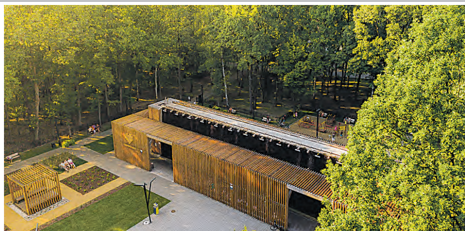
Na os. Tysiąclecia powstanie druga w Katowicach tężnia. Na zdjęciu tężnia z parku Zadole, która również wybudowana została w ramach budżetu obywatelskiego

Wybrane przez mieszkańców zadania zostaną w większości zrealizowane w 2021 roku. Tylko największe inwestycje, jak wspomniana tężnia, mają charakter projektów dwuletnich. Tegoroczna pula budżetu obywatelskiego wyniosła 17 mln zł i była największa w Polsce wśród miast wojewódzkich w przeliczeniu na mieszkańca. – Budżet obywatelski jest świetnym narzędziem rozwijania dzielnic Katowic i wpływu na życie społeczności lokalnych. Dlatego dziękuję za duże zaangażowanie zarówno katowiczantom, którzy pisali projekty, jak i wszystkim głosującym. Przez ostatnie sześć lat zrealizowaliśmy w Katowicach ponad 600 projektów zgłoszonych przez mieszkańców o wartości przekraczającej 80 mln zł. Jeśli ktoś korzysta z wodnego placu zabaw, drogi rowerowej czy ławeczki osiedlowej, na którą wcześniej