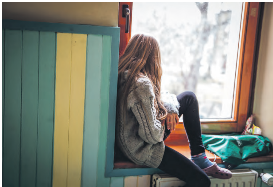
„Dajemy wędkę, a nie rybę” – to motto, które przyswieca w codziennej pracy osobom prowadzącym Dom Aniołów Stróżów

– Efekty pracy pedagogów, psychologów i terapeutów niejednokrotnie widoczne