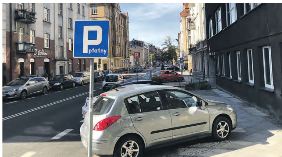
Na zakup 50 urządzeń i modernizację 78, a także wdrożenie opłat mobilnych przeznaczono 3,4 mln zł

W SPP zmodernizowano 78 urządzeń. Pojawiło się też 50 nowych, co łącznie daje 128 urządzeń, w których możliwe