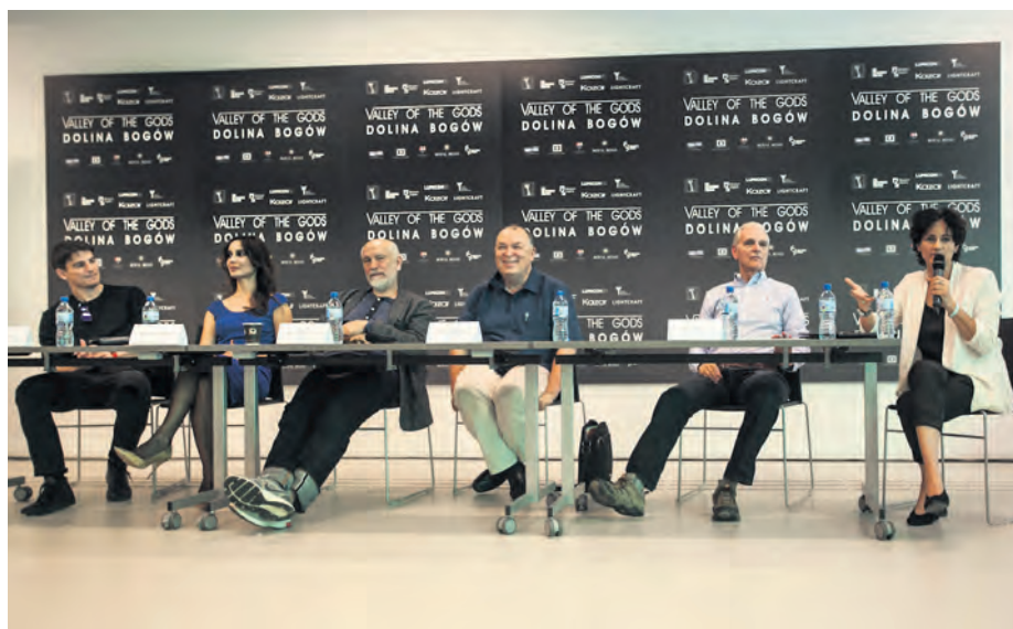
W filmie Lecha Majewskiego „Dolina Bogów” możemy zobaczyć plejadę gwiazd