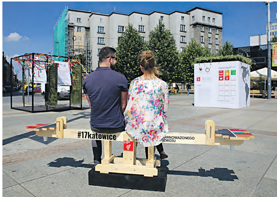
Stojący na rynku biały sześcian jest elementem kampanii informującej o działaniach miasta przed WUF

Akcja ta jest jednym z przedsięwzięć, przez które Katowice przygotowują się do organizacji Światowego Forum Miejskiego (World Urban Forum, WUF), którego gospodarzem będą w 2022 roku. To prestiżowa międzynarodowa konferencja traktująca o polityce miejskiej, transformacji i rozwoju miast. Odbywa się co dwa lata i gości ponad 20 tys. uczestników: przedstawiciele rządów, regionów, miast czy też organizacji pozarządowych. – Lata starań o podniesienie jakości życia w naszym mieście zostały zauważone przez Organizację Narodów Zjednoczonych,