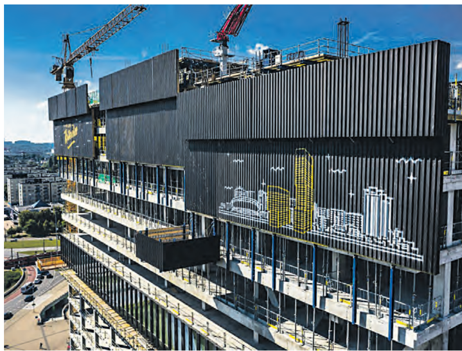
Mural na powstającym biurowcu .KTW II

Gotowy jest już most na Wiśle w Skoczowie, który przygotowano na kolejne lata użytkowania, oraz kilkanaście innych obiektów inżynierskich. Zakończono też planowe prace na linii Chybie (Bronów)–Skoczów. Wybudowano nowe perony w stacji Pierściec i na przystankach osobowych Zaborze oraz Chybie Mnich. Między Bronowem a Skoczowem położono 14 km nowych torów. Wymieniono rozjazdy w Bieniowcu i na stacji