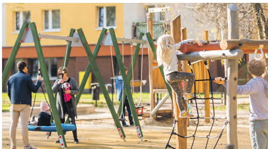
W ramach BO mieszkańcy wskazują w ich otoczeniu to, co jest im najbardziej potrzebne, np. place zabaw

– Mieszkańcy chętnie włączają się w działania związane z budżetem obywatelskim, bo widzą efekty swojego zaangażowania. W ramach sześciu poprzednich edycji BO katowiczanie wybrali łącznie aż 750 projektów, z których ponad 600 zostało już zrealizowanych. Powstały nowe ławki, chodniki, drogi rowerowe, zielone skwery, boiska, pierwszy wodny plac zabaw w Katowicach, lodowisko w Murckach czy też tężnia solankowa. Katowiczanie dostali świetne narzędzie do wprowadzania realnych zmian w swoim otoczeniu i bardzo sprawnie z niego korzystają. W ramach siódmej edycji otrzymaliśmy wiele ciekawych i dobrze przygotowanych wniosków. Mam nadzieję, że poprzez liczny