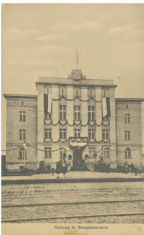
Ratusz w Szopienicach.

Zabytkowy ratusz jest cofnięty w linii zabudowy, wzniesiono go na planie zbliżonym do litery „U”. Budynek stanowi własność miasta Katowice. Obiekt użytkowany jest obecnie przez m.in. przychodnię medyczną i Radę Jednostki Pomocniczej nr 15 Szopienice-Burowiec.