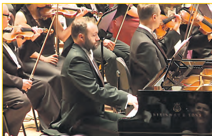
Na platformie można zadawać pytania głosowo i pisemnie, słuchając „Ognistego Ptaka” Igora Strawińskiego i „Karnawału Zwierząt” Camille’a Saint-Saënsa w wykonaniu NOSPR

Na platformie internetowej ai.nospr.org.pl można dopytywać sztuczną inteligencję o tematy dotyczące muzyki klasycznej, otrzymując natychmiastowe odpowiedzi, a jednocześnie przenosząc się do wirtualnej sali koncertowej katowickiej NOSPR. Na platformie można zadawać pytania głosowo i pisemnie, słuchając „Ognistego Ptaka” Igora Strawińskiego i „Karnawału Zwierząt” Camille’a Saint-Saënsa w wykonaniu NOSPR. NOSPR AI opowie, czym kompozytor inspirował się, tworząc dany utwór, jaki instrument gra partię solową czy, na przykład, ile waży fortepian. IBM oraz NOSPR mają nadzieję na rozbudowę tego narzędzia w kolejnych latach. W ramach projektu w sieci zostały udostępnione rzadko publikowane nagrania audiowizualne