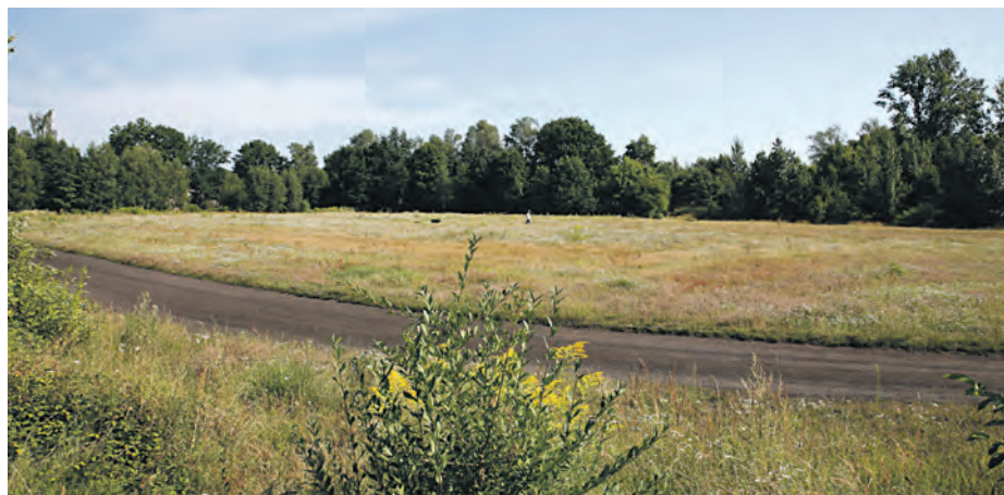
Nowy stadion powstanie w miejscu starego boiska „Kolejarza”

– Zależy nam na tym, by katowiczanie mieli coraz więcej możliwości aktywnego spędzania wolnego czasu, dlatego inwestujemy w rozbudowę infrastruktury sportowo-rekreacyjnej. Dużą popularnością cieszą się nasze obiekty sportowe, jak chociażby dwa nowe baseny z salami sportowymi czy nowe hale sportowe przy ul. Mikołowskiej i ul. Katowickiej. Wiemy jednak, że potrzeby mieszkańców są jeszcze większe, dlatego zdecydowałem także o utworzeniu kompleksu sportowego przy ul. Asnyka. Wcześniej w ramach konsultacji społecznych pytaliśmy mieszkańców, jakie mają oczekiwania względem tego miejsca. Wnioski i sugestie katowiczanie w dużej mierze zostały przez nas uwzględnione na etapie tworzenia projektu – podkreśla Marcin Krupa, prezydent Katowic, który zobowiązał się do realizacji