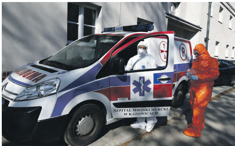
Wymazobusy finansowane przez miasto są obsługiwane m. in. przez pracowników Szpitala Murcki, którzy kładą duży nacisk na bezpieczeństwo katowiczian

Szpital pozyskuje także pieniądze ze źródeł zewnętrznych. Dzięki dofinansowaniu z budżetu Wojewody Śląskiego zakupiono m.in. nowy ambulans i sprzęt medyczny. Placówka pozyskała także dofinansowanie unijne do zakupu śródoperacyjnego aparatu RTG i diatermii chirurgicznej. Jednak głównym źródłem utrzymania i dalszego rozwoju Szpitala Murcki jest Miasto Katowice, które w latach 2015–2020 przeznaczyło w różnej formie na Szpital ponad 38,7 mln zł.