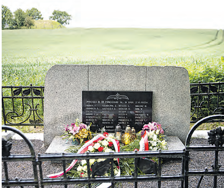
Mogiła katowickich powstańców w Lichyni

Co roku jesteśmy tu my, katowiczanie, żeby dać świadectwo naszej pamięci. W 99. rocznicę tamtych wydarzeń w imieniu