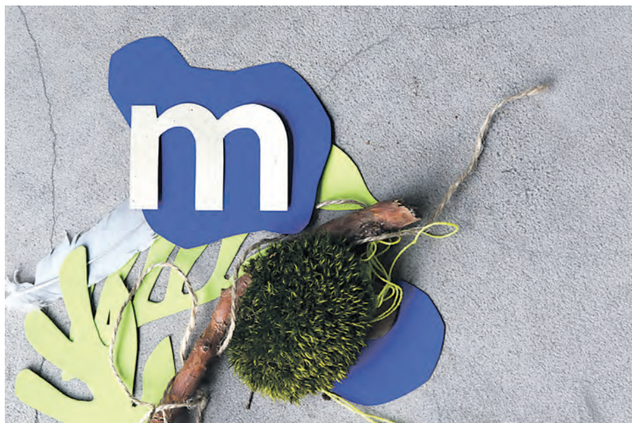
„Komorebi” – interdyscyplinarny projekt dla dzieci

Zbiórka: godz. 11.10, przystanek ZTM Giszowiec Osiedle