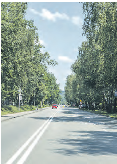
Budowa nowej drogi rowerowej wzdłuż ul. Lotnisko doprowadziła do konfliktu między mieszkańcami

– Budowa większości dróg rowerowych w mieście jest trudna i złożona. Gdy Katowice powstawały, planiści nie przewidywali, że w przyszłości będzie potrzebne miejsce na drogi rowerowe. Z tego względu dziś, projektując nowe drogi rowerowe, napotykamy wiele problemów, takich jak istniejąca zabudowa, ograniczona szerokość ulic i chodników czy też zieleń. Dlatego w większości przypadków nowe ścieżki rowerowe są kompromisowymi rozwiązaniami pomiędzy tym, czego chcą