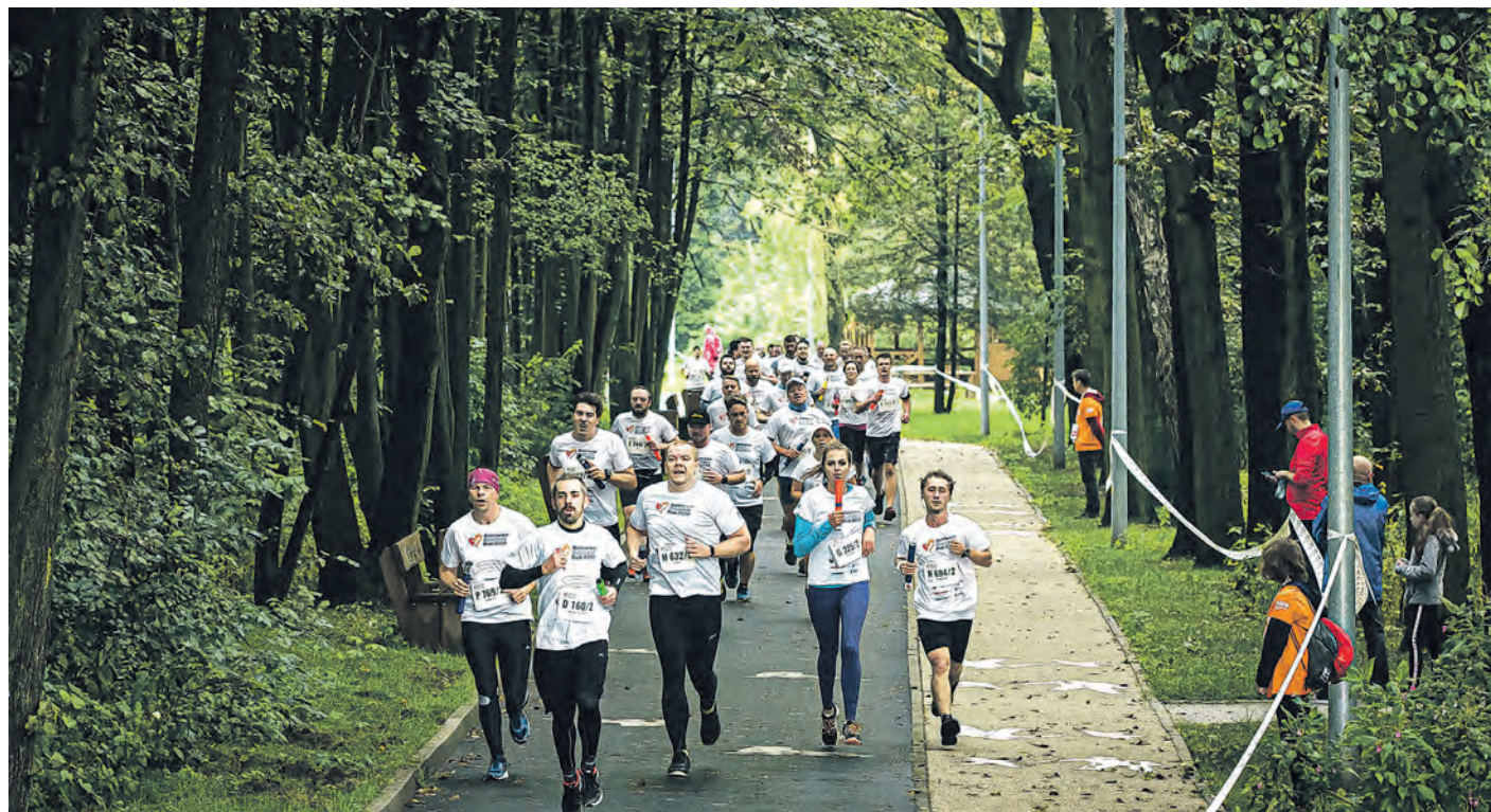
Katowicka impreza jest częścią ogólnopolskiej inicjatywy – w 2019 roku zawody odbyły się tego samego dnia także w 8 innych miastach Polski, gromadząc łącznie ponad 27 tys. osób

Biegacze pokonają dystans 4 km sami lub w kilku-, kilkunasto- czy kilkudziesięcioosobowej grupie w zależności od zasad dotyczących zgromadzeń, które będą obowiązywać we wrześniu. Nie będzie wyznaczanej trasy, każdy może wytyczyć wymagany odcinek samodzielnie i w wybranej lokalizacji: w jednym z katowickich parków, wzdłuż Muchowca czy po okolicznych leśnych ścieżkach. Nie trzeba jak