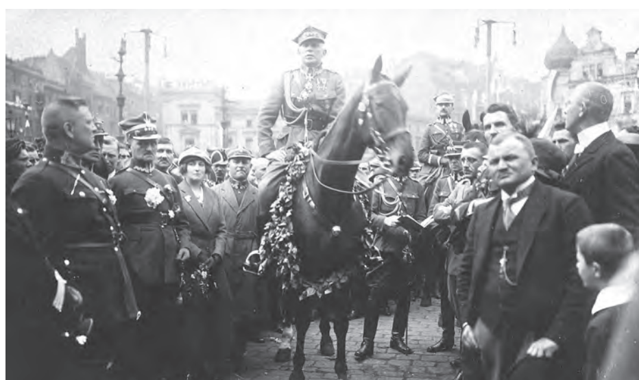
20 czerwca 1920 r. Wkroczenie wojsk polskich na Śląsk – powitanie w Szopienicach. General Stanisław Szeptycki przed symbolicznym łańcuchem oddzielającym Śląsk od ziem polskich