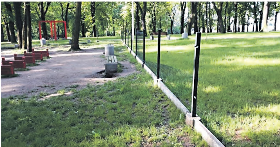
Sprawą kradzieży zajmuje się policja. Sprawdzany jest m.in. monitoring w okolicach parku

Wybieg dla psów w Parku Boguckim cieszy się dużą popularnością. Zapewnia on zwierzętom możliwość bezpiecznej i aktywnej zabawy. Warto przypomnieć, że wybieg powstał w zeszłym roku w ramach kompleksowej rewitalizacji