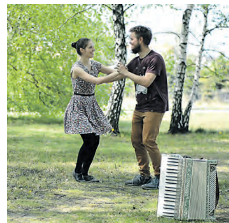
„Gramy i śpiewamy z Fedakami” to międzypokoleniowe warsztaty regionalnych tańców i śpiewu

→ Przypominamy, że oferta jest stale dostępna i urozmaicana na stronie www.mdkpoludnie.com oraz fanpage'u facebook.com/mdkpoludnie .