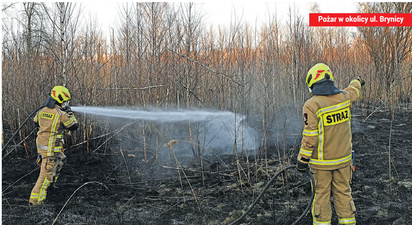
Pożar w okolicy ul. Brynicy

Pożary traw w ubiegłym roku w całej Polsce doprowadziły nie tylko do strat szacowanych na poziomie 40 mln zł, ale także do śmierci 10 osób. Statystycznie strażacy wyjeżdżali do pożarów traw i nieużytków rolnych co 9 minut. Przypomnijmy, że dziś maksymalna kara za wypalanie traw wynosi 5 tys. zł. Resort środowiska pracuje nad podniesieniem kary za wypalanie traw, grzywna ma wynosić nawet 30 tys. zł. (JG)