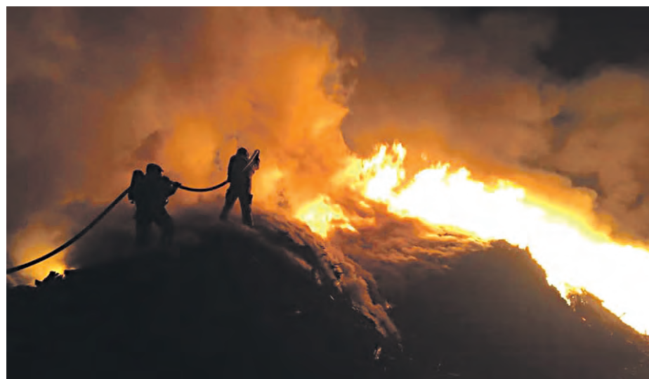
Pożar przy ul. Kuśnierskiej wyglądał bardzo niebezpiecznie

Póki co podejrzany o katowickie podpalenia na wniosek prokuratury decyzją sądu został aresztowany na trzy miesiące. Będzie miał przez ten czas o czym myśleć, gdyż zgodnie z artykułem 163 §1 Kodeksu Karnego: „kto sprowadza zdarzenie, które zagraża życiu lub zdrowiu wielu osób, albo mieniu w wielkich rozmiarach, mające powstać pożaru, podlega karze pozbawienia wolności od roku do 10 lat”. ■ (KK)