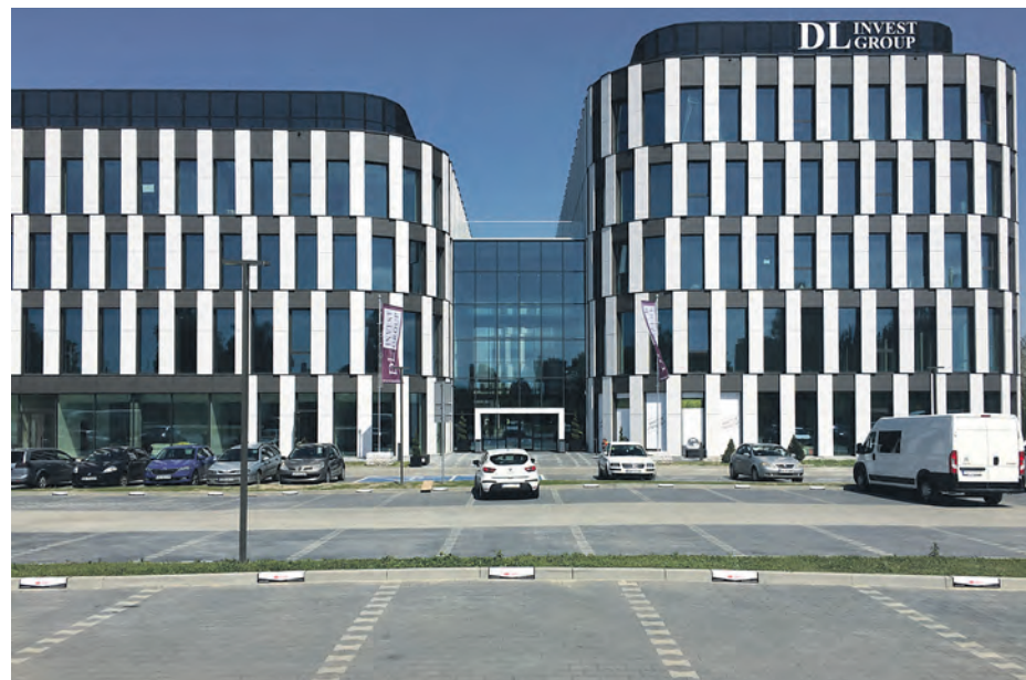
Budynek przy ul. Leopolda