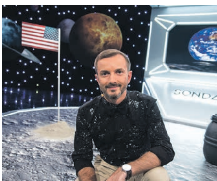
FOT. MATERIAŁY PROMOCYJNE SONDĄ 21/19/2

Stąpienie po Księżycu nie jest trudniejsze niż zrozumienie złożoności świata ożywionego i półożywionego (bo wirus nie jest żywym organizmem). Z koronawirusem jest ten problem, że znamy go zaledwie kilka miesięcy. Są wirusy, o których wiemy wszystko i one nie stanowią dla nas większego problemu. Musimy zapamiętać,