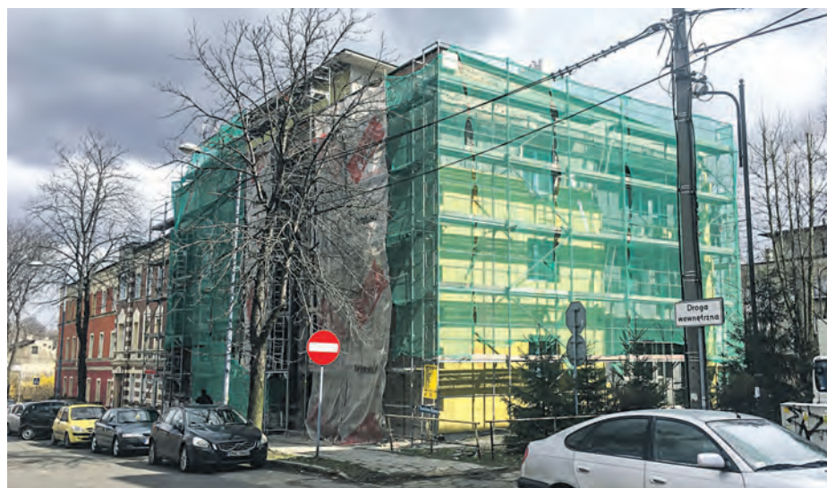
Budynek przy ul. Stanisława Olchawy 3-5

Komunalny Zakład Gospodarki Mieszkaniowej w Katowicach realizuje termomodernizację dwóch budynków mieszkalnych zlokalizowanych w Szopienicach przy ul. dr. Stanisława Olchawy 3-5 oraz Bednorza 14. Prace zakończą się w tym roku.