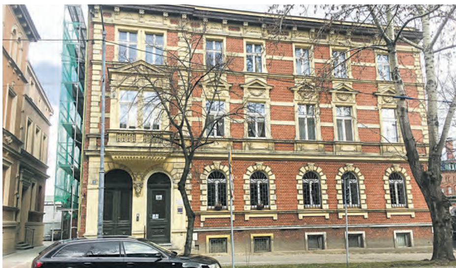
Dawna kamienica Rudolfa Graefego przy ul. Bednorza 14