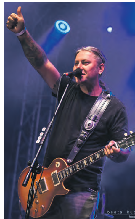
FOT. ARCHIWUM ZESPÓŁU

Wszyscy mówią, że muzycznie nasz poziom poszedł ostro w górę. Też to czuję.