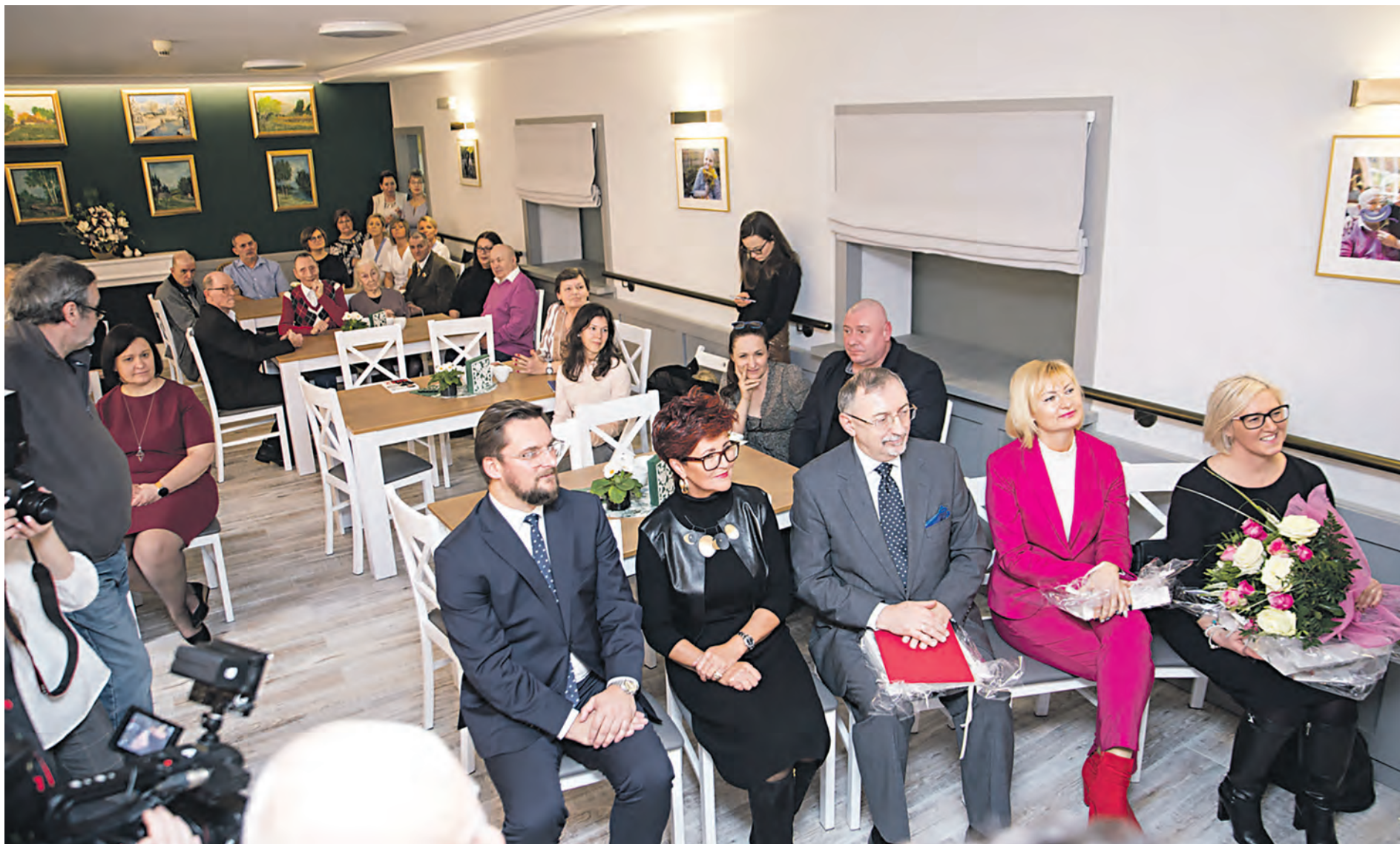
„Kącik Babci i Dziadka” powstał w DPS „Przystań”