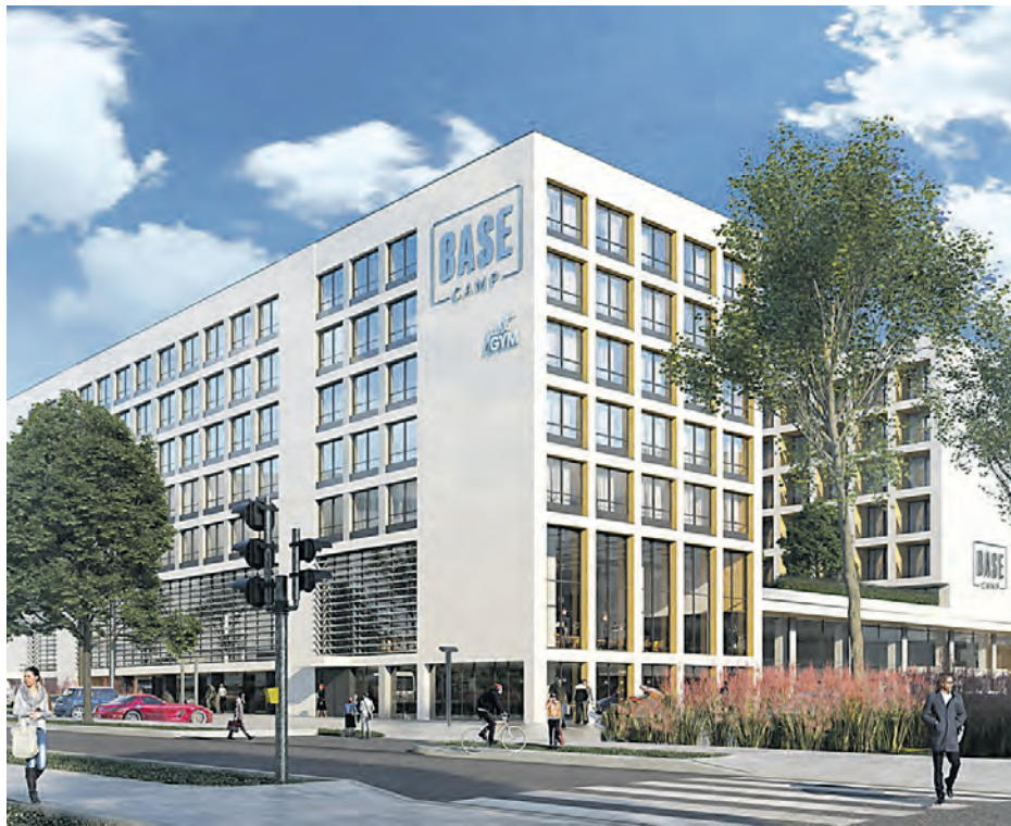
Wizualizacja BaseCamp, czyli sieć domów studenckich na os. Paderewskiego