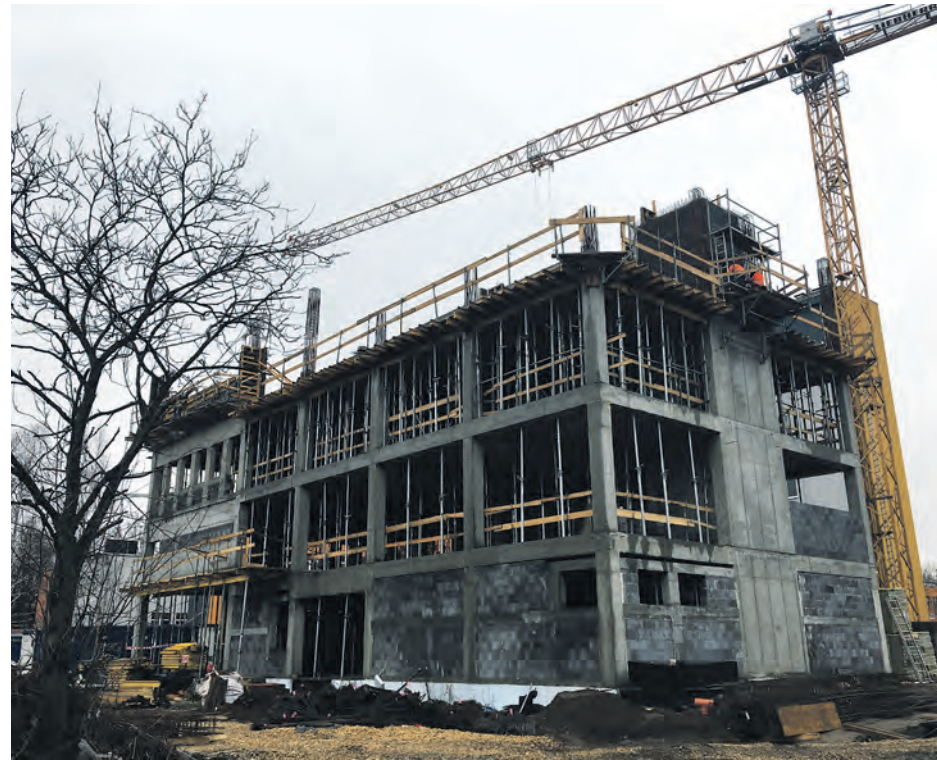
Silesia LabMed na kampusie ŚUM

Katowice to od dawna jeden z ważniejszych ośrodków akademickich w Polsce, jak