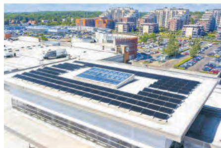
Panele fotowoltaiczne na dachu SCC

naturalnego, nie generują hałasu ani zanieczyszczeń. Dzięki systemowi fotowoltaicznemu w SCC uda się uniknąć wygenerowania do atmosfery 32,5 ton dwutlenku węgla.