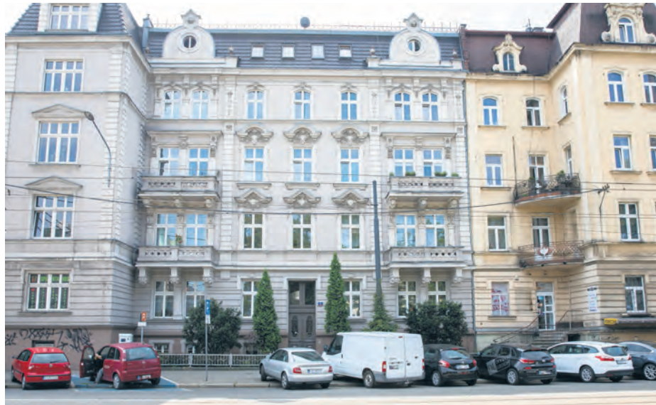
Kamienica przy ul. Warszawskiej 25

– „Mieszkanie za remont” to doskonała okazja na znalezienie swego lokum dla osób, które nie chcą brać kredytów na kupno mieszkania ani płacić wysokiego odstępnego za wynajem na rynku komercyjnym. Widząc, jak wielką popularnością cieszy się nasz projekt wśród katowiczian, postanowiliśmy zwiększyć ilość edycji z dwóch – do pięciu rocznie – mówi Marcin Krupa, prezydent Katowic. – Dla potencjalnych najemców bardzo ważną jest też możliwość wykupienia na preferencyjnych warunkach mieszkania usytuowanego w budynku stanowiącym własność wspólnoty mieszkaniowej z udziałem Miasta – po co najmniej pięciu latach zamieszkania w nim. Jedną z ważniejszych zmian,