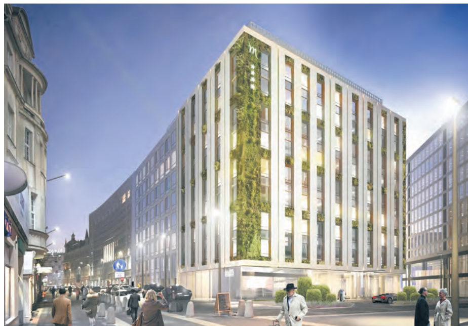
Mercure Katowice City Center

Silesia City Center jest pierwszym tego typu obiektem w regionie, które wdrożyło system fotowoltaiczny. Instalacje tego typu dały się poznać jako niezawodne i bezpieczne rozwiązanie z sektora odnawialnych źródeł energii. Są przyjazne dla środowiska