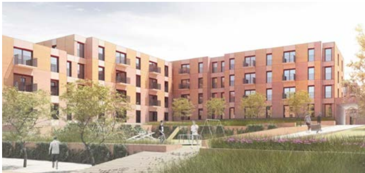
Wizualizacja zabudowy „Nowego Nikiszowca”

W ramach programu Mieszkanie Plus najemcy mogą zdecydować się na zawarcie jednej z umów. Będzie to albo umowa najmu niezwiązana z prawem najemcy do nabycia prawa własności mieszkania – tzw. umowa najmu instytucjonalnego na czas oznaczony,