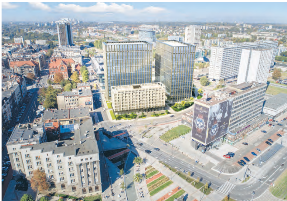
Wizualizacja Nova Silesia

Niewykluczone, że realizacja nowej zabudowy ruszy jeszcze w tym roku. Tymczasem zasadnicze prace wyburzeniowe potrwać 5 miesięcy, do września. Firma, która wykonuje roboty rozbiórkowe, rozpoczęła już usuwanie elementów z wnętrza obiektu, następnie przejdzie do stopniowego demontażu konstrukcji poszczególnych kondygnacji. Wykonawca zapewnia, że choć budynek usytuowany jest w samym centrum miasta, to w taki sposób zaplanował prace, by zminimalizować uciążliwości związane z rozbiórką i wywozem sporych ilości gruzu. – Ponadto, hotel został wybudowany na początku lat 70. ubiegłego wieku przy zastosowaniu materiałów, które obecnie uznawane są częściowo za szkodliwe. Jesteśmy zmuszeni wdrożyć specjalne środki ochrony i procedury pracy w trakcie usuwania tych materiałów – podaje Anna Lewicka, kierownik budowy w spółce Tree Capital, która realizuje zadanie. Wykonawca informuje również, że będzie chciał odzyskać jak najwięcej surowców, które podda