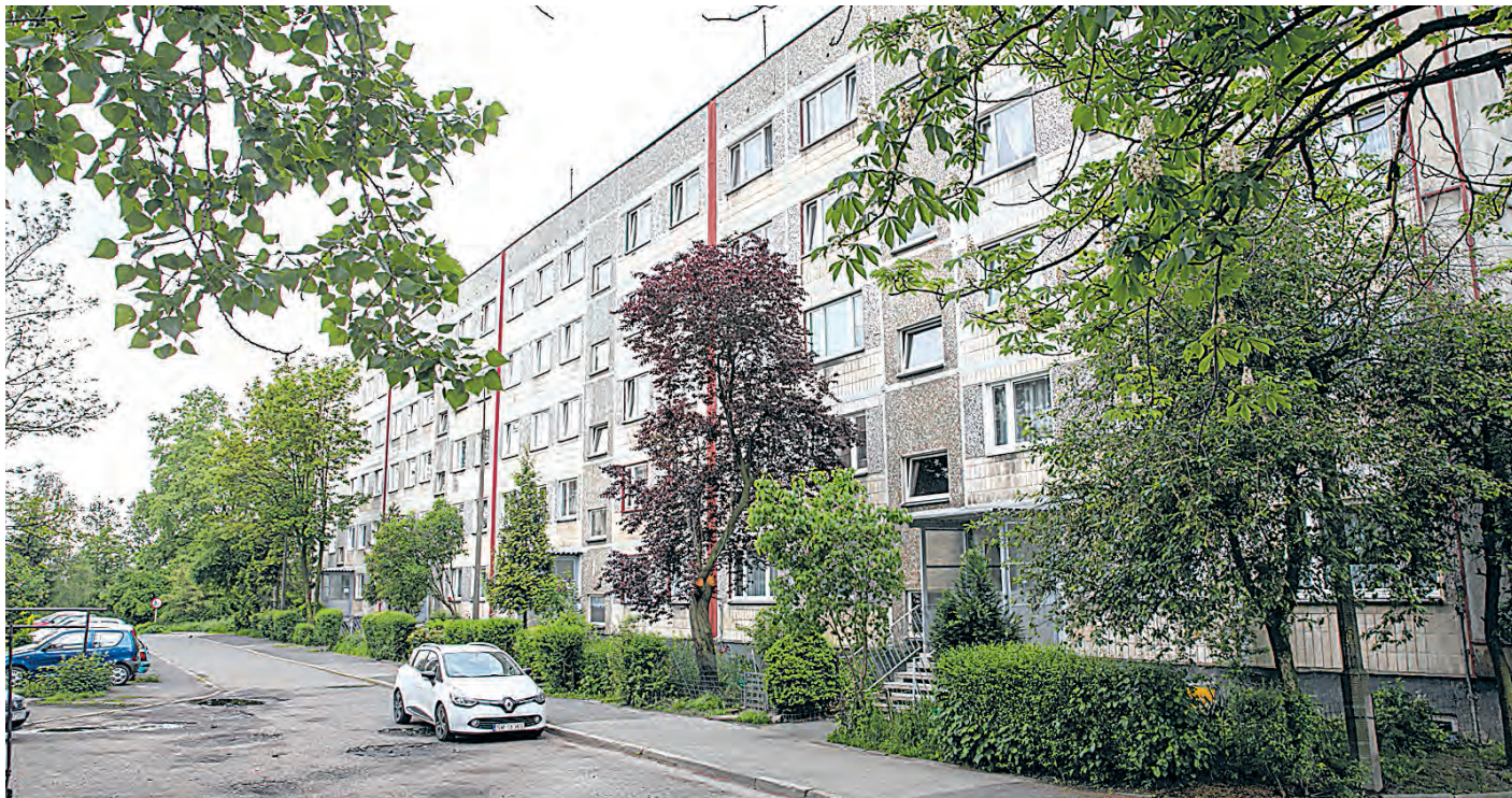
Bloki przy ul. Szczecińskiej, które w tym roku zostaną wykupione przez miasto

– W październiku zeszłego roku zakończyliśmy długie i trudne negocjacje prowadzone ze Spółką SM DOM oraz BPS TFI S.A. Ustalona została łączna cena, tj. 32 250 000 zł, za zakup 31 budynków mieszczących 612 mieszkań – mówi prezydent Marcin Krupa. – Do tej pory podpisaliśmy umowy notarialne na wykup 299 mieszkań i intensywnie pracujemy, by wykupić pozostałe lokale znajdujące się przy ul. Szczecińskiej oraz ul. Bytkowskiej 68 a-b i c-d. Wszystkie mieszkania zostaną włączone do miejskiego zasobu w ramach Komunalnego Zakładu Gospodarki Mieszkaniowej. Podjęliśmy te działania, bo zależało nam na tym, żeby nasi mieszkańcy mogli wreszcie poczuć się bezpiecznie i nie martwić się tym, co przyniesie kolejny dzień – dodaje prezydent Marcin Krupa.