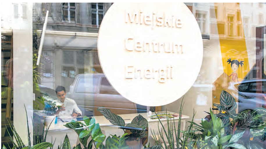
Miejskie Centrum Energii mieści się przy ul. Młyńskiej 2 i jest dostępne prosto z ulicy

14 stycznia zapraszamy na spotkanie z doradcą energetycznym z Wojewódzkiego Funduszu Ochrony Środowiska i Gospodarki Wodnej w Katowicach. Do dyspozycji mieszkańców będzie doradca energetyczny ze świeżymi informacjami na temat statutowej działalności Funduszu w roku 2019