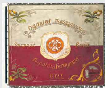
Aktualnie w zbiorach Muzeum Historii Katowic znajdują się 52 sztandary

Drugi z poddanych konserwacji sztandarów, z 1928 roku, to symbol katowickiego rzemiosła, a konkretnie cechu piekarzy. Trzeci eksponat to sztandar założonego w 1918 r. w Dębnie Towarzystwa Śpiewu „Lutnia”. Obfituje on w polskie symbole narodowe, na co niewątpliwie wpływ miał fakt jego powstania w 1920 roku, w czasie przygotowań do plebiscytu na Górnym Śląsku. Dzięki konserwacji zakończonej w listopadzie sztandary można podziwiać w MHK na stałej wystawie historycznej, która również powstała jako projekt realizowany w ramach ministerialnego programu. (JOANNA TOFILSKA)