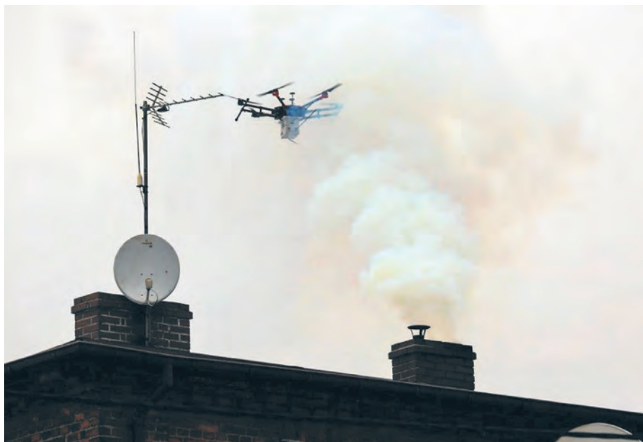
Od ubiegłego roku strażnicy miejscy korzystają z nowoczesnego drona, który pomaga im w wykrywaniu spalania niedozwolonych substancji w domowych paleniskach

Bezwzględnie nie można spalać odpadów i śmieci, bo to po prostu trucie sąsiadów. Za silne zadymienie i nieprzyjemny zapach najczęściej odpowiada jednak kiepskie spalanie, a więc to, w jaki sposób użytkujemy nasz piec. Rekomendujemy tzw. rozpalanie