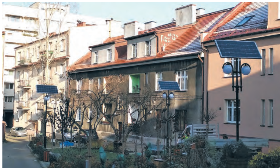
Na wniosek mieszkańców pierwsze trzy godziny lampy działają na 70 proc. możliwości, a następnie do świtu z 40 procentową wydajnością