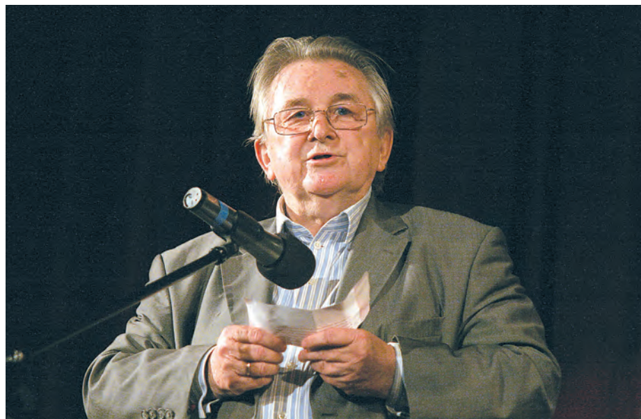
Kazimierz Kutz na uroczystości wręczenia mu tytułu Honorowego Obywatela Miasta, 2010 r.

Był Kutz nie tylko jako artysta osobowością zbyt potężną i zbyt oryginalną. Za mocno wdarł się do naszych myśli i naszej wyobraźni, za bardzo zawładnął sferą społecznych i prywatnych emocji. Sądzę, że potrzeba nam jeszcze dużo czasu, żeby w pełni zdać sobie sprawę z rzeczywistego wymiaru tej postaci, a co za tym idzie: wymiaru straty dla Śląska i dla Polski. Nie chodzi tu bynajmniej o jakąś przesadną i bezkrytyczną admirację. Był Kutz postacią niepokorną i krewką. Potrafił nie przebieierać w słowach i zapędzał się nieraz daleko, zwłaszcza kiedy ponosiły go emocje. Narzązał się wielu tą emocjonalnością, ale polityczna poprawność to nie on! Ciekawe, że kiedy wygłaszał swoje opinie o sztuce, żadna zapalczywość nikogo tu nie raziła – tak wielki miał autorytet, tak potężny artystyczny dorobek. Tylko czy można oddzielać Kutza artystę od Kutza Ślązaka? Kutza Polaka upominającego się o Śląsk? Kutza rozszereżonego obywatela?