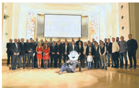
„Złote Buki” w Filharmonii Śląskiej

Akademia GKS-u Katowice to już teraz potężna instytucja szkoląca kilkuset młodych piłkarzy i piłkarek. Od tego roku do tego grona dołączą też młodzi siatkarze, hokeiści i tenisiści. W przyszłości możliwa jest rozbudowa o kolejne sekcje. – Gdy ruszaliśmy z projektem akademii, oparty był on na piłce nożnej. Najpierw tylko chłopców, później