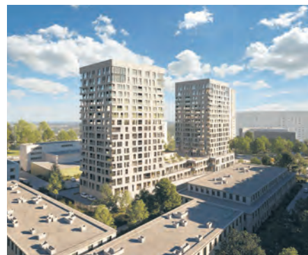
Sokolska 30 Towers

Skanska sprzedała biurowce C i D będące częścią kompleksu czterech budynków Silesia Business Park, zlokalizowanych przy ul. Chorzowskiej 146-148. Nabywcą jest filipiński ISOC Holdings. Jest to pierwsza transakcja sprzedaży budynku biurowego firmy Skanska w regionie Europy Środkowo-Wschodniej inwestorowi z Filipin i jednocześnie pierwszy