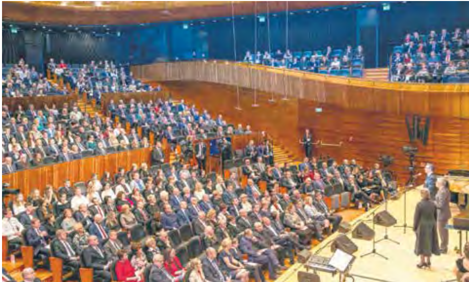
Koncert z okazji Święta Niepodległości - 2017