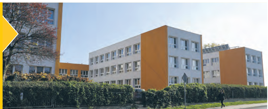
Na zdjęciu termomodernizację Szkoły Podstawowej nr 62 przy ul. Orдона i Żłobka przy ul. Ligonia

Ciesielskiej 1, nr 93 przy ul. ul. Łętowskiego 24, V LO przy ul. gen. Jankego 65, Katowickie Centrum Edukacji Zawodowej przy ul. Techników 11, SP nr 29 przy ul. K. Lepszego 2, nr 66 przy ul. Krzywoustego 7, nr 56 przy ul. Spółdzielczości 21. W innych projektach, również dofinansowanych z UE, termomodernizacji poddane zostaną: Miejski Żłobek przy ul. Wojciecha 23a czy Miejskie Przedszkole nr 89 przy ul. Zadole 26a. Zakończono niedawno termomodernizację: Miejskiego Żłobka przy ul. Uniwersyteckiej 14, ul. Szeptyckiego 1, Tysiąclecia 45, Orдона 3a, SP nr 12 przy ul. Paderewskiego 46, SP nr 62 przy ul. Orдона 3d. Obecnie trwają prace np. w SP 5 przy ul. Gallusa 5 czy Żłobku przy ul. Ligonia 43.