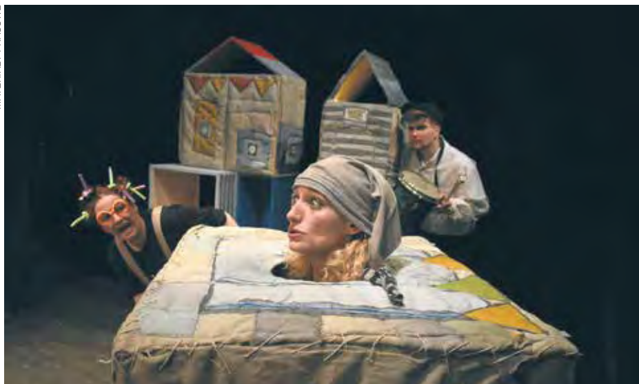
Kukuryki na patyku, czyli o dwóch takich - to jeden ze spektakli granych w listopadzie w Teatrze Ateneum