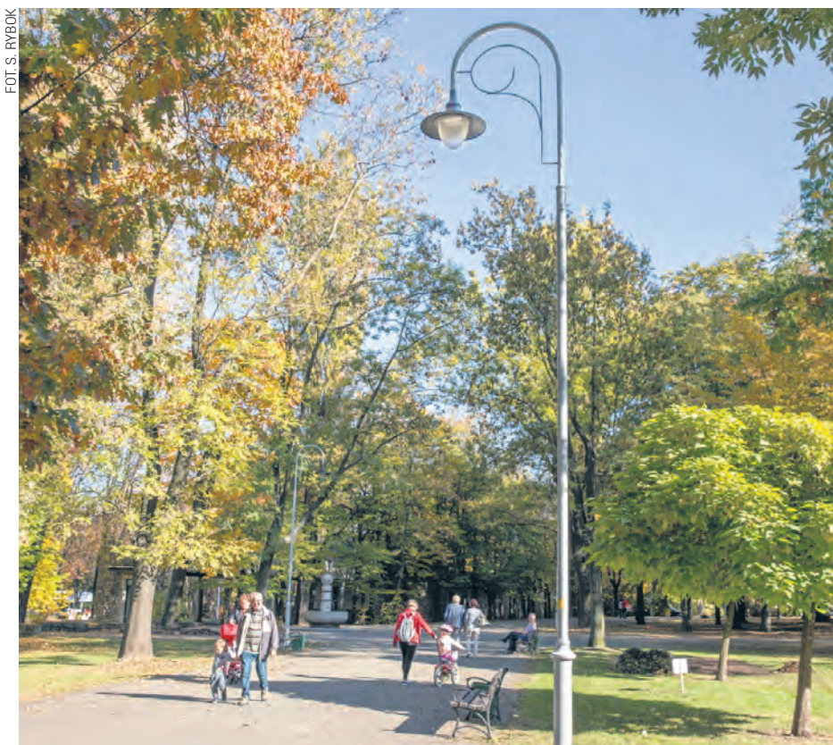
Nowe oświetlenie zainstalowano m. in. w parku Kościuszki

Łączna wartość projektu wyniosła 5,5 mln zł, z czego dofinansowanie unijne to 85% wartości. Największa ilość lamp ledowych, bo aż 461 sztuk, zainstalowana