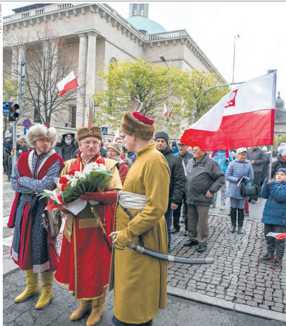
Obchody Święta Niepodległości 2017