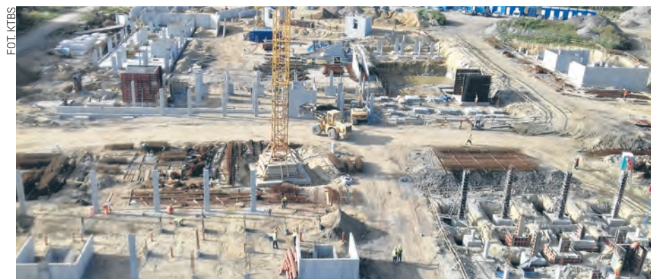
Widać już zarys nowego osiedla, które powstaje na tzw. Mrówczej Górze w Nikiszowcu

Osoby chętne do zamieszkania w „Nowym Nikiszowcu” mogą wypełnić do 31 grudnia ankietę online, która jest dostępna na