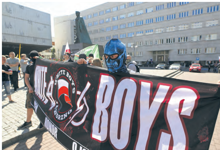
6 maja Młodzież Wszechpolska organizowała w Katowicach marsz. Ze względu na bezpieczeństwo mieszkańców został on rozwiązany

Gdy Młodzież Wszechpolska przygotowywała się do rozpoczęcia przemarszu przez Katowice, wśród manifestantów można było dostrzec zamaskowane osoby trzymające transparenty „white boys” [z ang. biali chłopcy] z krzyżami celtyckimi,