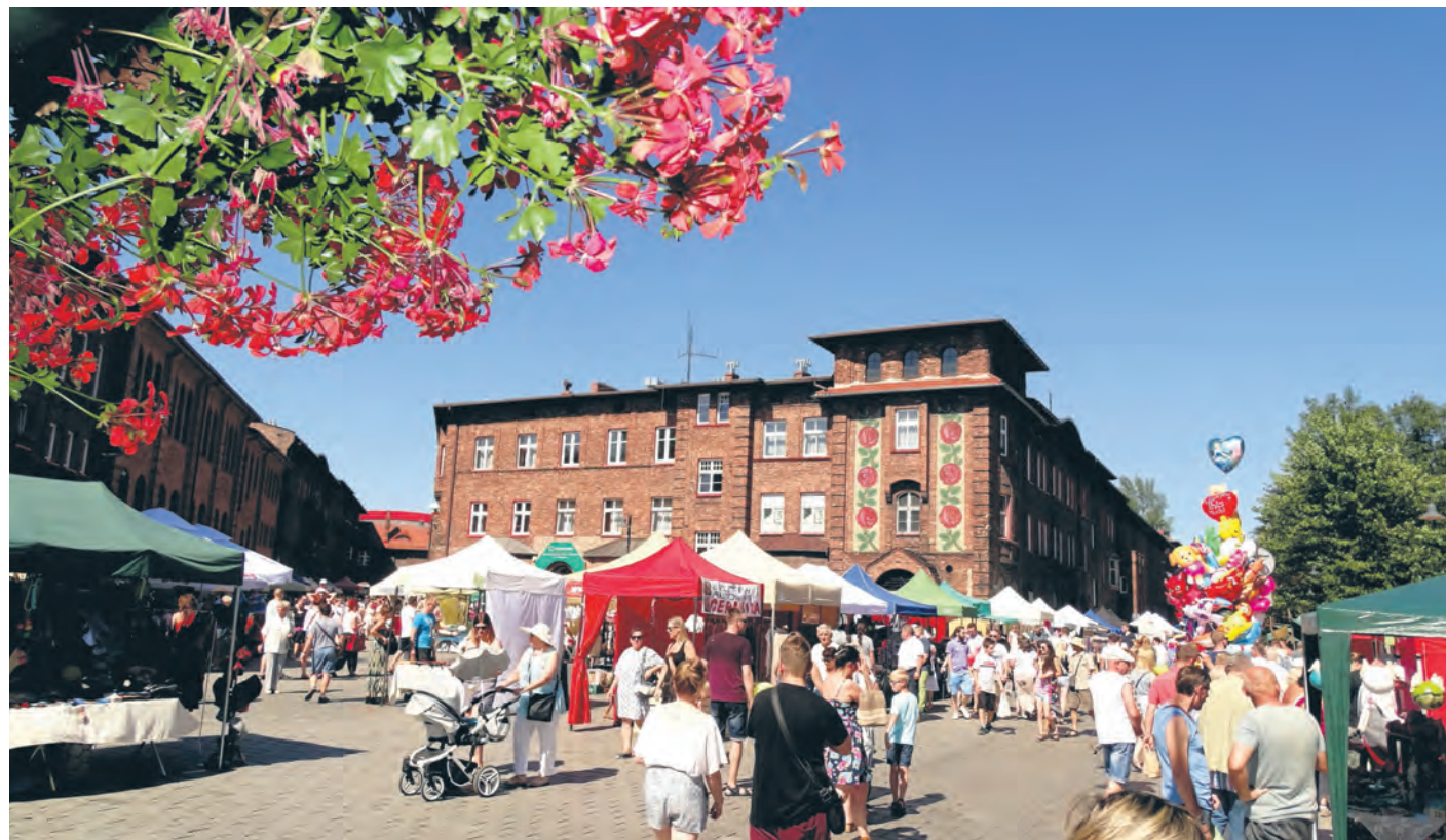
Nikiszowiecki Odpust u Babci Anny odbywa się również ze wsparciem miasta – w ramach inicjatywy lokalnej

Ideą inicjatywy lokalnej jest wkład własny mieszkańców w projekt. I tak, np. mieszkańcy zaoferowali 447 godzin pracy społecznej i wsparcie rzeczowe przy organizacji Dni Zawodzia. Otrzymali wsparcie od miasta w wysokości ponad 15 tys. zł. Inicjatywa zaś „Razem Posprzątajmy Dolinę 5 Stawów – Festyn Ekologiczny Morawa-Borki” kosztowała mieszkańców 1024 godziny pracy społecznej, miasto dało 45 tys. zł. Natomiast 38 tys. złotych dostali mieszkańcy, którzy zaproponowali zakup sprzętu ratowniczego oraz szkoleniowego mającego służyć podczas kursów, warsztatów i zajęć. Sprzęt ma być wyko-