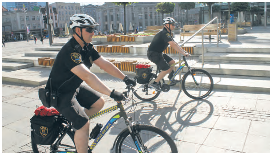
Strażnicy miejscy w Katowicach patrolują miasto również na rowerach. Rower ma tę przewagę nad radiowozem, że w trakcie interwencji można nim dojechać wszędzie

Likwidacja nielegalnych wysypisk śmieci i namierzanie sprawców to także zadanie katowickich strażników miejscy. W ostatnich tygodniach strażnicy namierzali kilku sprawców takich wykroczeń. Na przykład przy ul. 73 Pułku Piechoty dwaj mężczyźni wyrzucili odpady remontowe, papę, folie i plastiki. Zostali