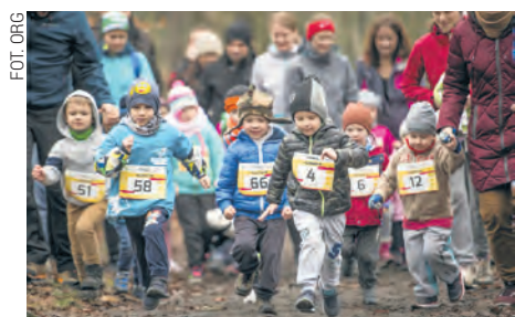
CITY TRAIL to również zawody dla dzieci

Zawody dla dzieci i młodzieży – CITY TRAIL Junior są skierowane do