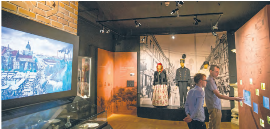
Nowa wystawa w Muzeum Historii Katowic. Więcej szczegółów na str. 23