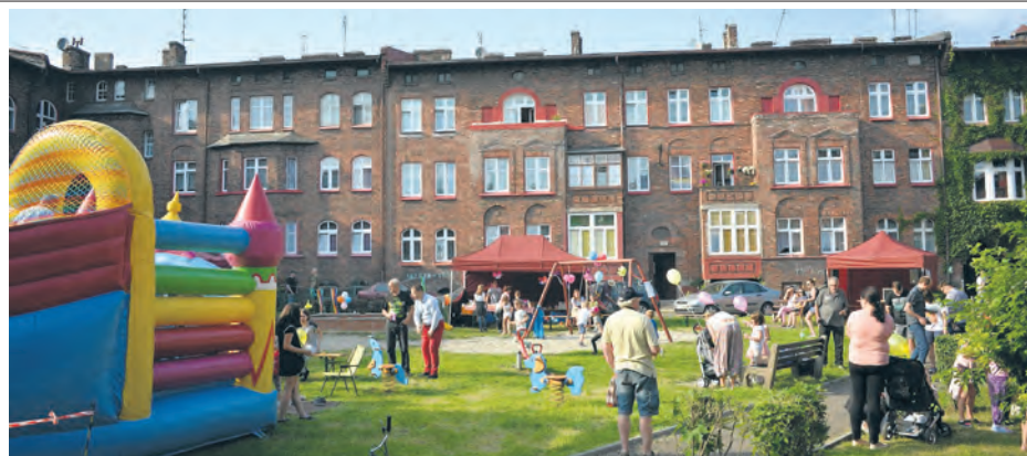
Dzień Sąsiada w Nikiszowcu

Głównym celem projektu jest poprawa funkcjonowania społeczności dzielnicy oraz wzmocnienie potencjału społeczno-zawodowego. Ważnym miejscem związanym z realizacją projektu jest Centrum Zimbaro, w którym będą odbywać się spotkania czy warsztaty i inne aktywności. Każde z osiedli będą mieć swoich animatorów.