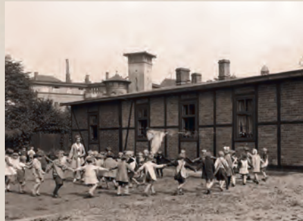
Dzieci podczas zabawy przed budynkiem przedszkola. Zdjęcie pochodzi sprzed II wojny światowej

– Górnicy tęsknili za zielonym polem, lasem. Stawy na Ligocie i Piotrowicach czy w innych miejscach przyciągały całe rodziny. Gdzieniedzie