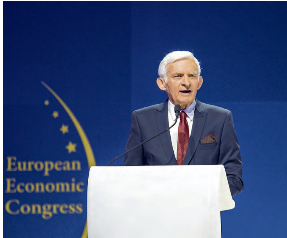
Premier Jerzy Buzek jest częstym gościem w Katowicach. Na zdjęciu – w trakcie otwarcia Europejskiego Kongresu Gospodarczego

Wspomniał pan o jubileuszowym X Europejskim Kongresie Gospodarczym, który już za nami. Przed nami za to, w grudniu, Szczyt Klimatyczny w Katowicach. To – jak zauważył pan w jednym z wywiadów – największe spotkanie, jakie kiedykolwiek organizowała ONZ. Także w tym kontekście sprawą arcyważną jest to, by nikt nie wyłamał się z przygotowywanego porozumienia. Andris Piebalgs, były unijny komisarz ds. energii i ds. rozwoju, stwierdził wprost: „To Polska będzie odpowiedzialna