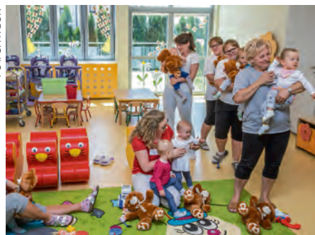
W nowo otwartym żłobku dziećmi zajmuje się 10 opiekunek i 2 pielęgniarki