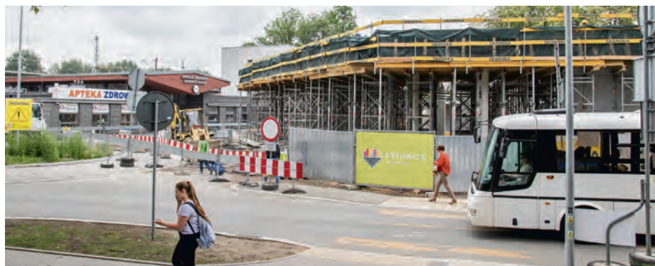
Prace na Ligocie są już bardzo zaawansowane

Koszt inwestycji to ponad 247,5 mln zł, z czego około 210 mln zł to dofinansowanie w ramach Programu Operacyjnego Infrastruktura i Środowisko. Przebudowa zostanie ukończona w 2020 r. O rozpoczęciu prac w terenie oraz zmianach w organizacji ruchu będziemy informowali z wyprzedzeniem.