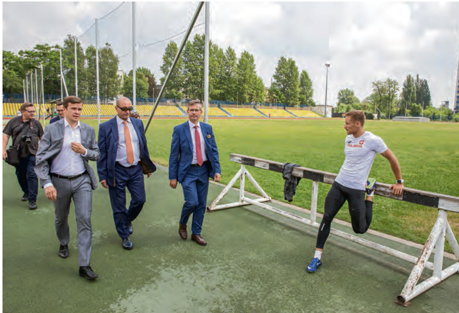
Na zdjęciu minister sportu i turystyki Witold Bańka, rektor AWF Adam Zając i wiceprezydent Katowic Waldemar Bojarun – na stadionie AWF przy ul. Kościuszki

– Dziękuję ministrowi Witoldowi Bańce za dostrzeżenie potrzeb społeczności lokalnych i kolejną decyzję o inwestowaniu