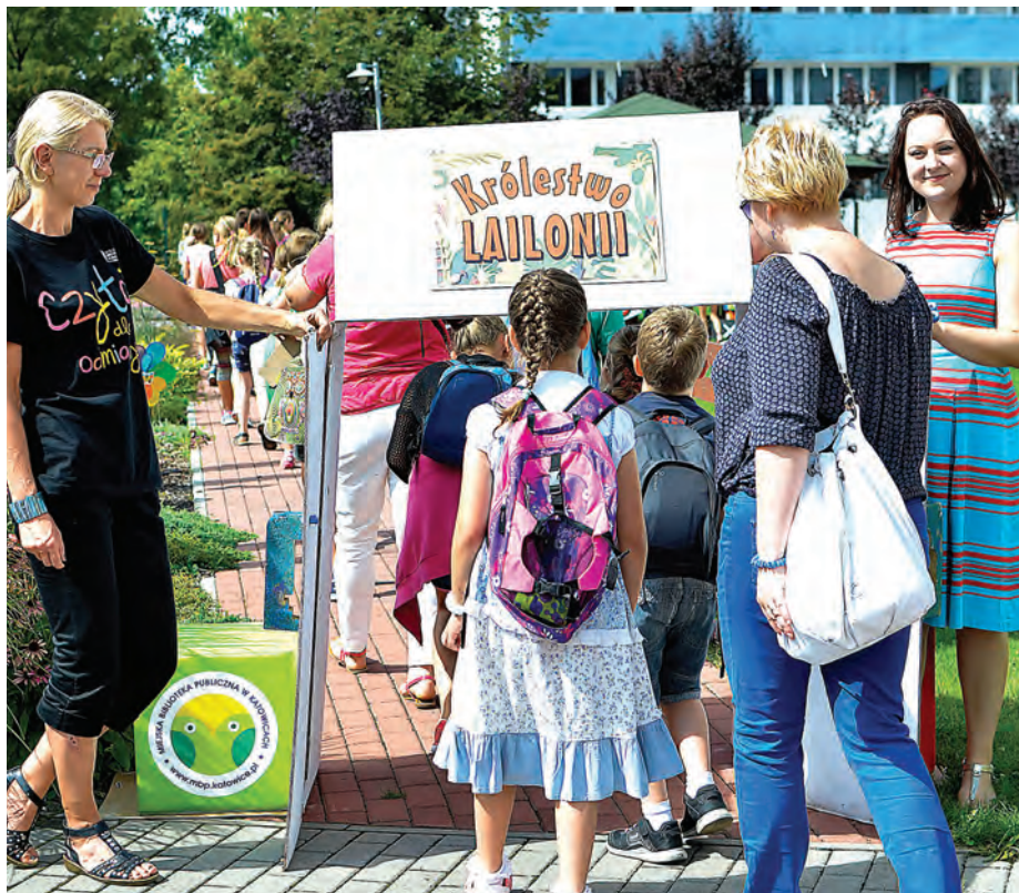
Lato z Książką to ponad 200 spotkań z książką, które odbywają się w prawie dwudziestu filiach bibliotecznych

Słynny czeski reżyser filmowy zmarł w kwietniu tego roku w wieku 86 lat. Przypominamy jego wczesne filmy z lat 60.: „Konkurs”, „Czarny Piotruś”, „Miłość blondynki” i „Pali się, moja panno”. Na zakończenie przeglądu dokument „Złote lata 60. – Miloš Forman”.