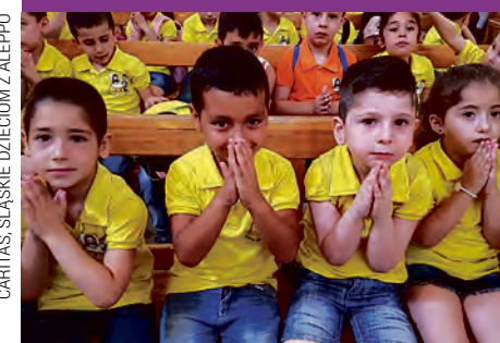
CARITAS, ŚLĄSKIE DZIECIOM Z ALEPPO

W poprzednich numerach informowaliśmy o dwóch akcjach charytatywnych: Śląskie dzieciom Aleppo i Katowickie Kilometry Dobra. Teraz czas na podsumowanie.