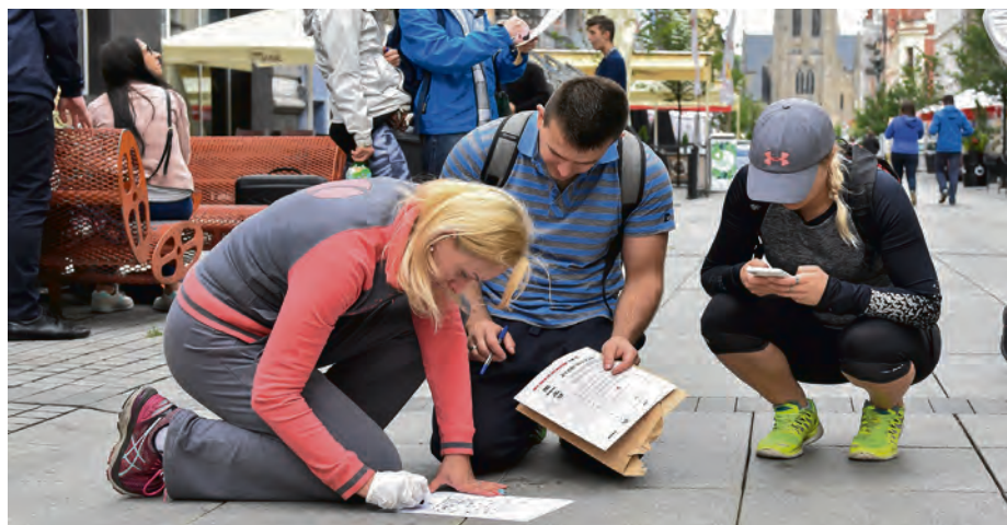
W zabawie liczyli się nie tylko dobra organizacja, dotarcie do jak największej liczby wyznaczonych miejsc oraz kolejność przybycia drużyn na metę, ale również sprawność w rozwiązywaniu zagadek.

Do gry „Beboki i spółka” mógł przylączyć się każdy, niezależnie od wieku, a dowodem na to było pojawienie się drużyny z najmłodszą uczestniczką – mającą zaledwie trzy miesiące. Drużyny musiały popisać się znajomością topografii miasta. Na wykonanie zadań i dotarcie do mety na Dolinie Trzech Stawów śmiałkowie mieli trzy godziny, ale w czasie zabawy mogli poruszać się rowerami czy komunikacją miejską. Na swojej drodze napotkali wiele przeszkód zastawionych przez Beboki, które pomieszały zawartości słoików z sezamem i makiem, zakodowały tajną wiadomość w sygnale dźwiękowym odczytywalnym tylko za pomocą kodu Morse’a czy rozbiły na drobne kawałki logo Katowic. Graczom przydała się także znajomość budżetu obywatelskiego. Na jednym z punktów zadaniowych przy miejskiej bibliotece należało rozwiązać test z pytaniami dotyczącymi historii BO i mechanizmu wrześniowego głosowania. Z kolei za wykonanie co najmniej trzech zdjęć na tle inwestycji zrealizowanych w ramach BO drużyny uzyskiwały dodatkowe punkty.