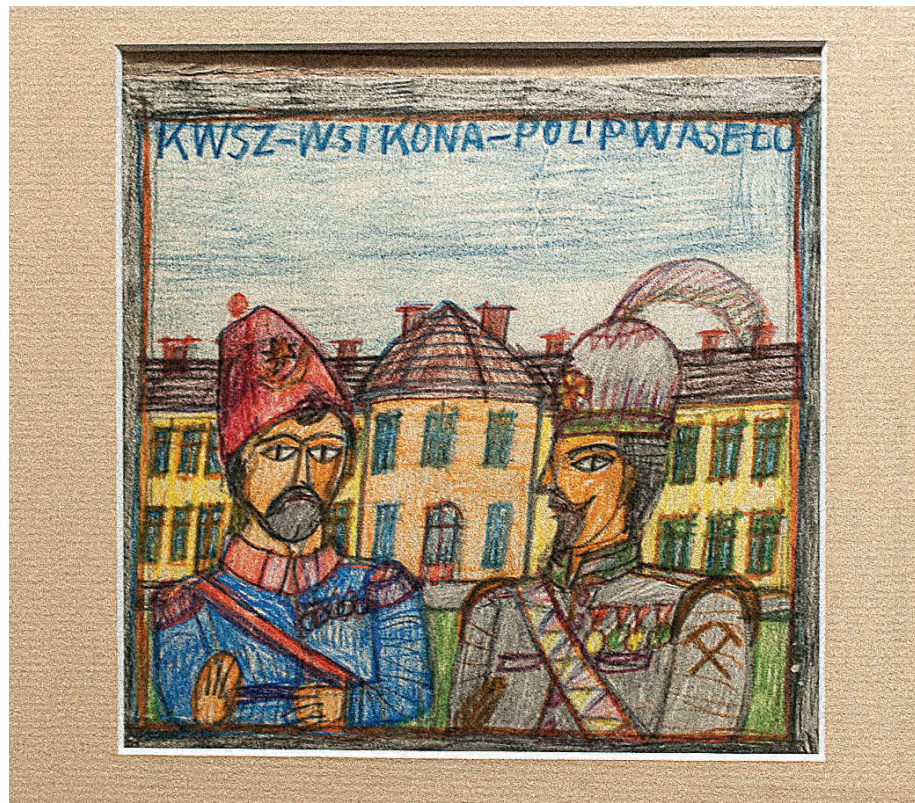
W Muzeum Historii Katowic wyjątkowa wystawa: „Nikifor. Samotność w Krynicy. 50 obrazów w 50. rocznicę śmierci artysty”