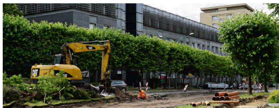
Na Koszutce powstaje rondo. Ma być gotowe za kilka tygodni