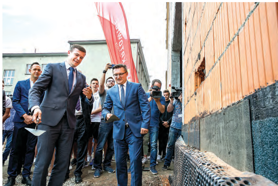
Uroczystość wmurowania aktu erekcyjnego. Na zdjęciu minister Witold Bańka i prezydent Marcin Krupa

– Inwestycja w nowoczesną infrastrukturę sportową to inwestycja w zdrowe, aktywne i przedsiębiorcze społeczeństwo. Właśnie dlatego w sposób szczególny staramy się wspierać budowę obiektów przyszkolnych, w których zazwyczaj zaczyna się przygoda ze sportem młodych Polaków. W ramach naszego Programu Rozwoju Szkolnej Infrastruktury Sportowej tylko w ciągu dwóch lat dofinansowaliśmy budowę 743 obiektów w całej Polsce, wiele z nich powstało lub powstaje na terenie województwa śląskiego. Jestem przekonany, że ta hala będzie dobrze służyła nie tylko uczniom, ale też wszystkim mieszkańcom Katowic – mówi Witold Bańka, minister sportu i turystyki, który wraz z Marcinem Krupą, prezydentem Katowic, a także uczniami i nauczycielami wziął udział w uroczystości wmurowania aktu