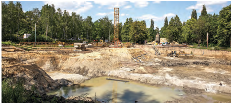
Teren inwestycji przy ul. Kościuszki

Prace przy ul. Kościuszki i przy ul. Hallera ruszyły w połowie zeszłego roku, natomiast przy ul. Wczasowej jesienią. Po wykonaniu badań geologicznych okazało się, że konieczne są dodatkowe prace stabilizujące grunty. – Na podstawie wydanych zaleceń zostały opracowane projekty uzdatnienia podłoża, które przekazano wykonawcom jako roboty dodatkowe, nieobjęte zamówieniem podstawowym. Wykonawcy poinformowali, że konieczne prace dodatkowe będą miały wpływ na termin zakończenia budowy basenów – mówi Maciej