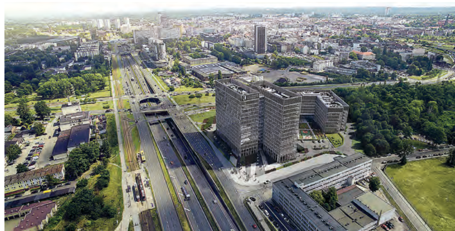
Face 2 Face Business Campus

Echo Investment rozpoczęło budowę drugiego projektu biurowego w Katowicach. Inwestycja realizowana jest w rejonie ul. Grundmanna, Chorzowskiej i Żelaznej, w miejscu dawnej hali sportowej Baildonu. Na blisko 2,4 ha powstaną dwa budynki biurowe o łącznej powierzchni 46 tys. m 2 . W pierwszym etapie zostanie wybudowany dwupoziomowy parking podziemny dla budynków oraz