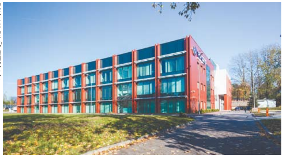
Emerald Office Center