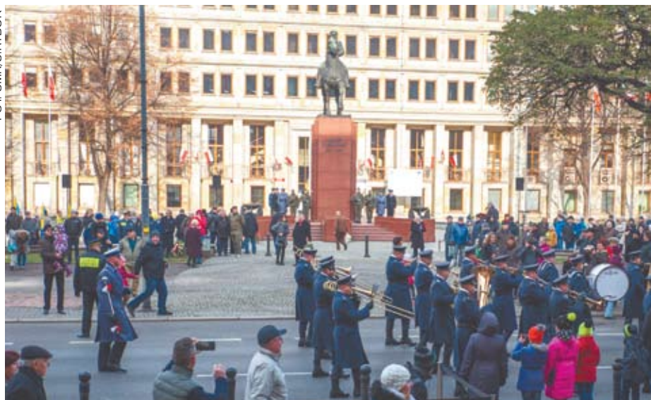
Obchody Święta Niepodległości w 2016 r.

(pl. Bolesława Chrobrego): odegranie hymnu i podniesienie flagi państwowej, wystąpienia okolicznościowe, uroczysty Apél Pamięci, salwa honorowa, złożenie kwiatów, uroczysta defilada, występ orkiestry dętej.