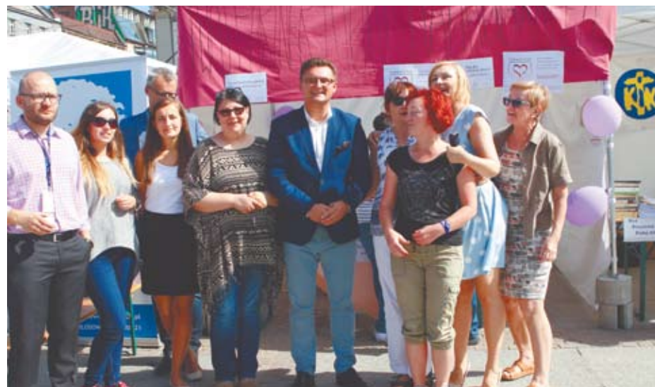
Festiwal Organizacji Pozarządowych 2017

W latach 2015-2016 powstało 170 nowych miejsc w żłobkach (przy ul. Ordona, ul. Uniwersyteckiej, ul. Marcinkowskiego) – łącznie jest ich dziś 789. W 2018 planowane jest uruchomienie żłobków na Kostuchnie i os. Tysiąclecia (łącznie 102 miejsca). Trwa budowa obiektu przy ul. Boya-Zeleńskiego (koszt inwestycji 3,7 mln zł) oraz adaptacja segmentu Wyższej Szkoły Zarządzania