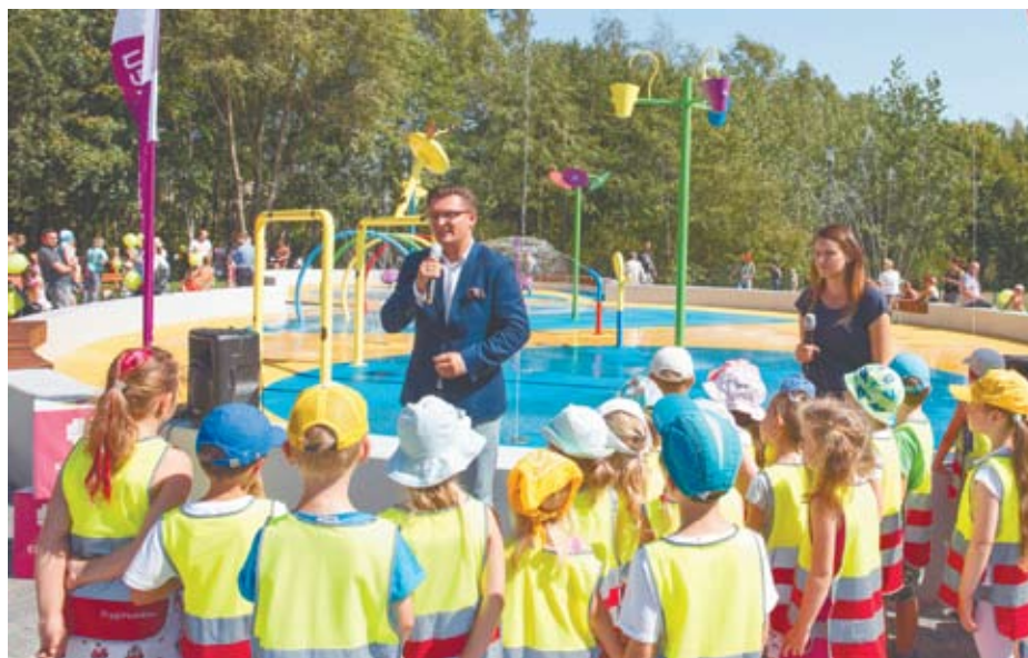
Otwarcie wodnego placu zabaw

W marcu 2015 r. prezydent powołał Agnieszkę Lis na stanowisko Pełnomocnika Prezydenta ds. Organizacji Pozarządowych, a w styczniu 2016 r. otwarto nową siedzibę COP (335 m 2 ) przy ul. Kopernika 14. - Centrum Organizacji