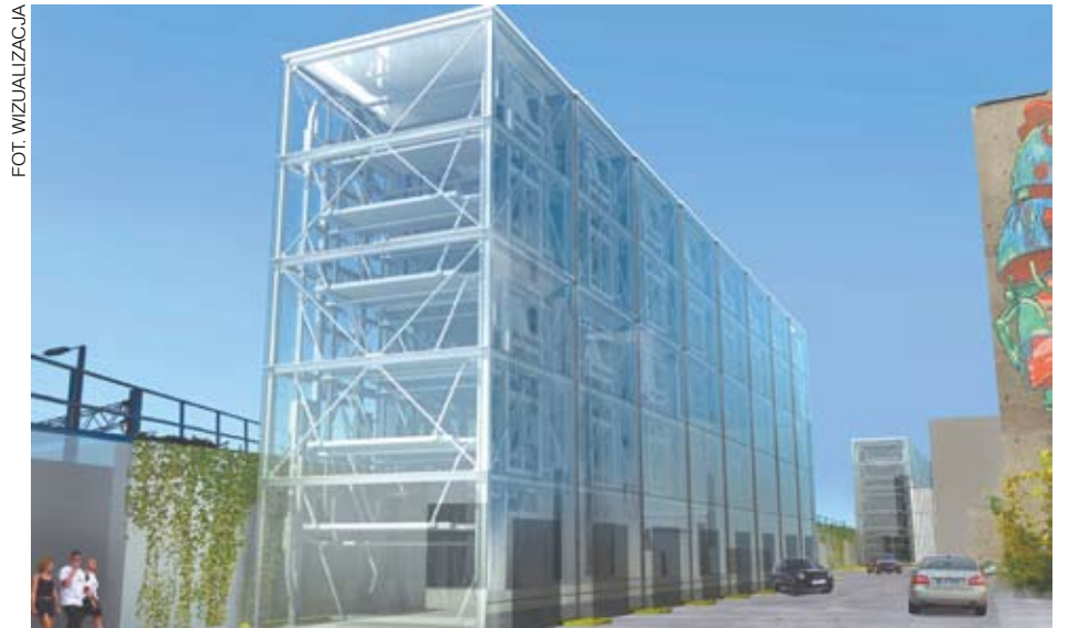
Na Tylnej Mariackiej powstanie wielopoziomowy parking, który pomieści 240 samochodów i 56 rowerów.

Cała przestrzeń Tylnej Mariackiej ma stać się bardziej przyjazna dla pieszych. Prócz parkingu pojawi się tutaj też dużo zieleni. Warto dodać, że mieszkańcy Katowic coraz chętniej