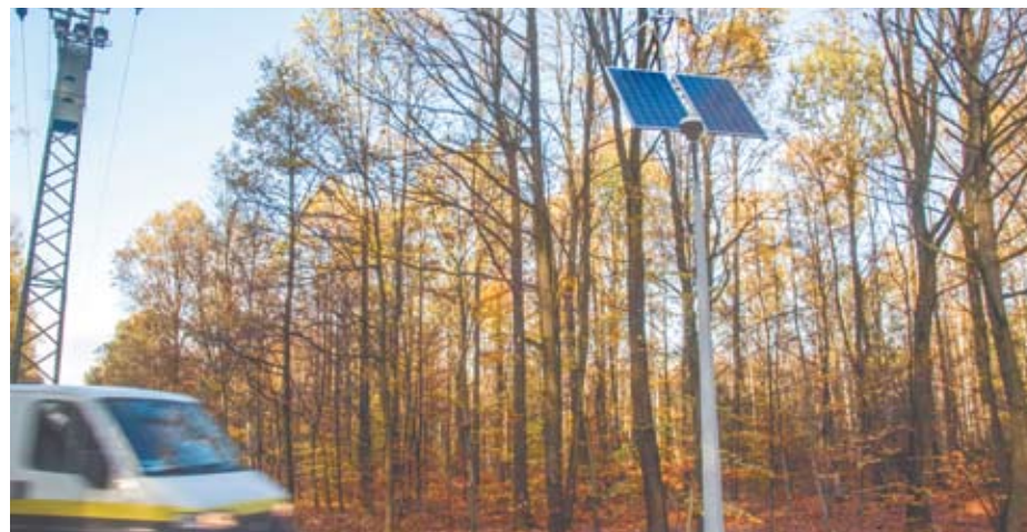
Nowoczesne latarnie wykorzystujące energię odnawialną stanęły w miejscach, gdzie nie ma możliwości tradycyjnego zasilania - na zdjęciu ul. Cegielnia w Murckach.