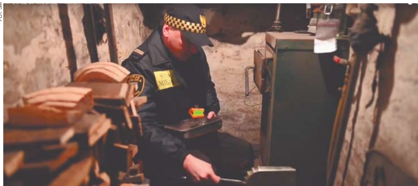
Strażnicy miejscy sprawdzają, czym mieszkańcy palą w piecach. W 2016 r. przeprowadzono aż 3 410 kontroli. Stwierdzono spalanie odpadów w 540 przypadkach. Natomiast do połowy października Straż Miejska przeprowadziła aż 3100 interwencji i w 182 przypadkach potwierdziła palenie śmieci.