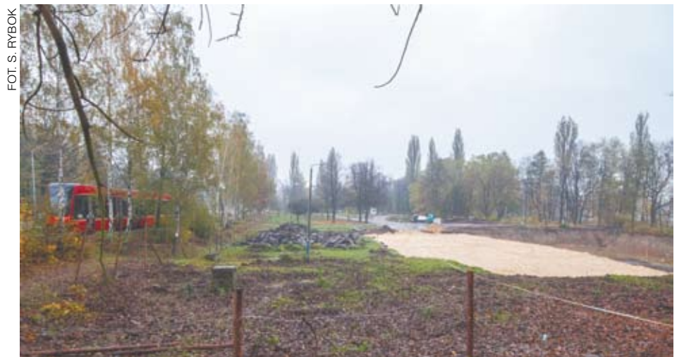
Zakończył się kolejny etap budowy basenu przy ul. Kościuszki – głębokościowe badanie gruntu

zaglądają na Tylną Mariacką. Wszystko to za sprawą mieszczących się tutaj popularnych knajp i świetnych murali przyciągających miłośników street artu.