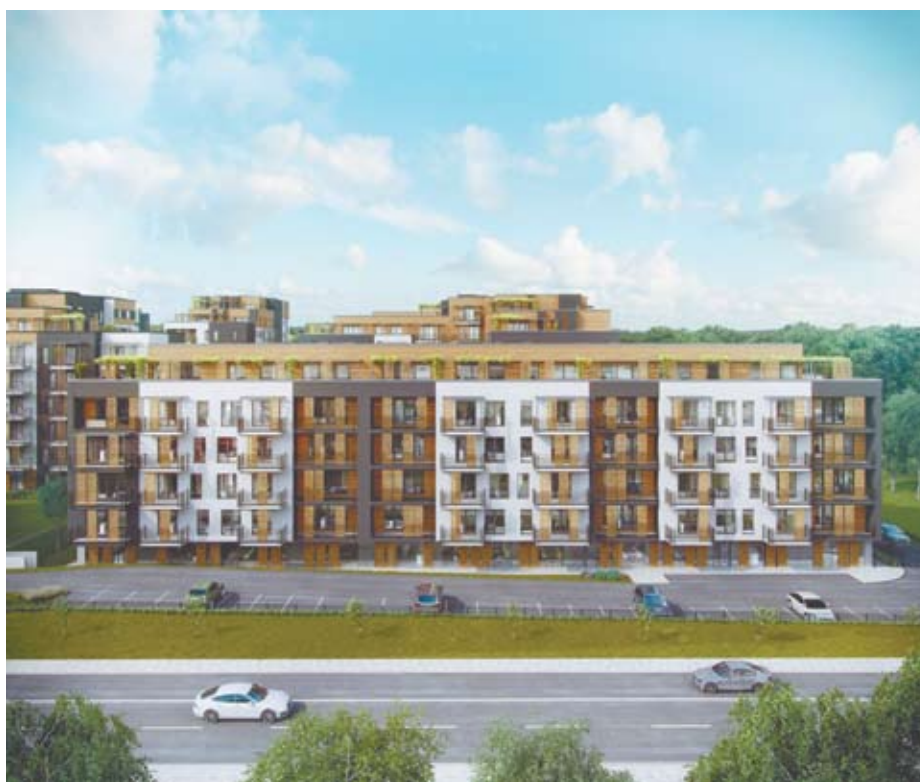
IV etap Atal Francuska Park (wizualizacja)

Deweloper Echo Investment wybrał firmę budowlaną Erbud na wykonawcę stanu surowego Galerii Libero. Obiekt handlowo-rozrywkowy o powierzchni 42 tys. m 2 powstaje u zbiegu ulic Kościuszki i Kolejowej. Wartość umowy to 75 mln zł netto. Kontrakt ma zostać zrealizowany do 14 września 2017 roku. W kolejnych miesiącach konieczne będą jeszcze prace wykończeniowe w budynku. We wrześniu podano, że rozbiórka obiektów, które znajdowały