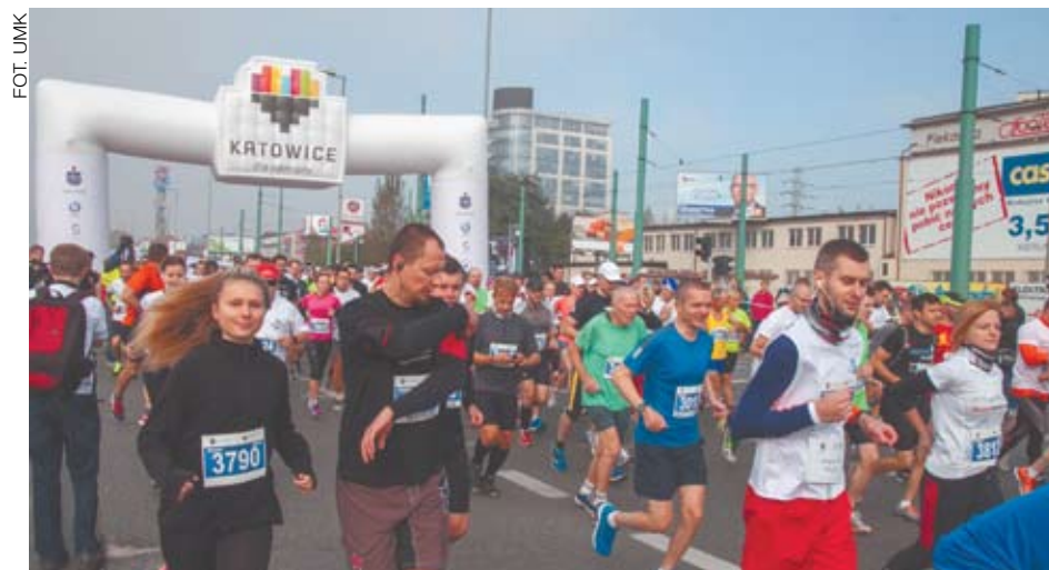
W tym roku każdy uczestnik biegu otrzyma wyjątkowy medal – częściowo wzorowany na sercu z logo Katowic