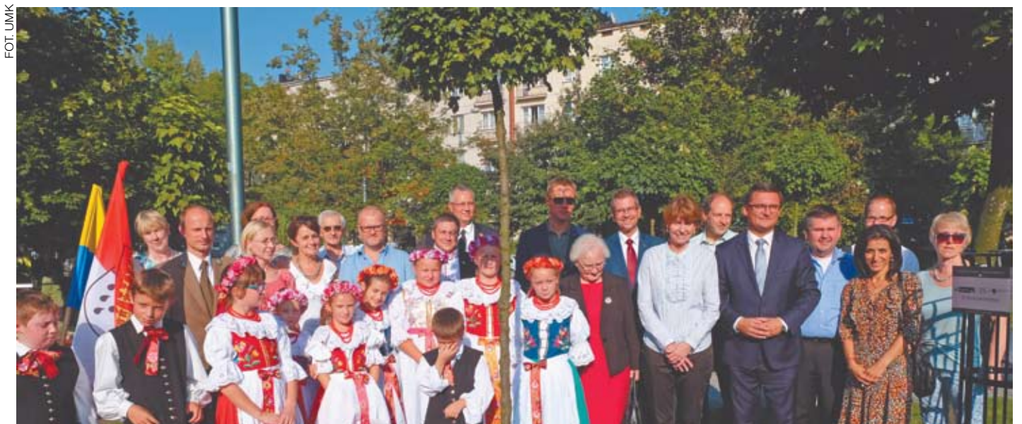
Władze Katowic i goście z Kolonii wspólnie zasadzili na placu Miast Partnerskich „drzewko przyjaźni”

Na początku tego miesiąca kilkoro sportowców z Katowic ma okazję sprawdzić swoje siły oraz poznać nasze niemieckie miasto partnerskie podczas organizowanego już po raz dwudziesty prestiżowego maratonu Rhein Energie Marathon. W tym samym czasie Katowice odwiedzą mieszkańcy Kolonii, którzy w ramach wycieczki organizowanej przez Stowarzyszenie ds. Wsparcia Partnerstwa Katowic i Kolonii przyjeżdżają, by zwiedzić nasze miasto i region. W planie jest między innymi odwiedzenie Nikiszowca, zwiedzenie „Strefy kultury” oraz Muzeum Historii Katowic. Goście będą też mogli podziwiać wystawę na placu Kwiatowym będącą efektem pracy uczniów z katowickiego Zespołu Szkół Plastycznych oraz kolońskiego Berufskolleg Kartäuserwall, którzy odwiedzili i upamiętnili na zdjęciach nasze miasta. Te same fotografie podziwiają już