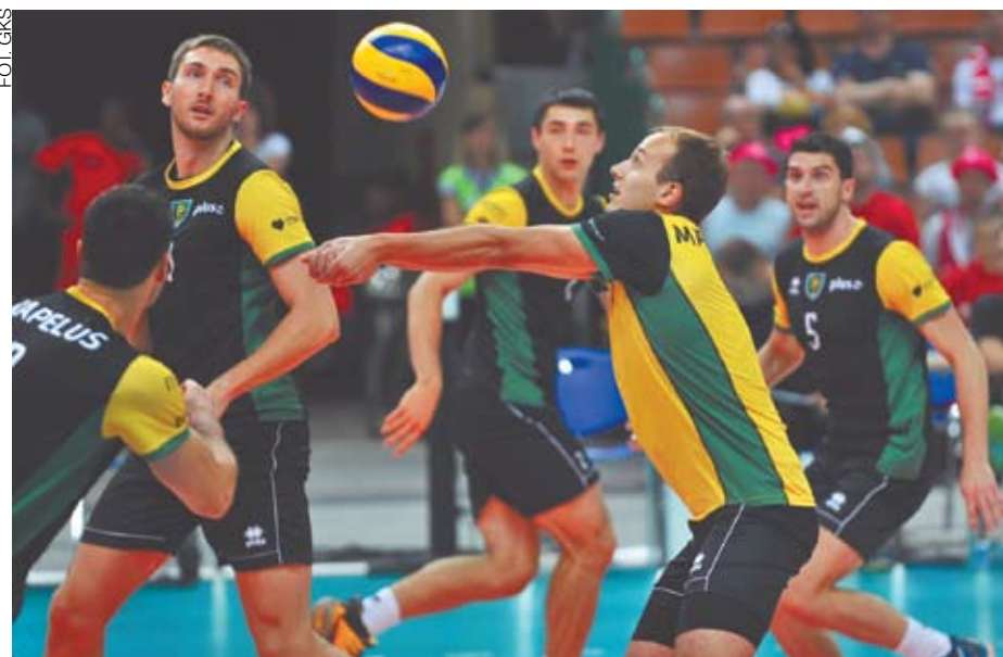
Październik upłynie pod znakiem inauguracji rozgrywek PlusLigi, w której siatkarze GieKSy będą reprezentować stolicę Górnego Śląska.

We wrześniu wystartowały natomiast rozgrywki Polskiej Hokej Ligi, w których udział bierze KH GKS Katowice. Katowiccy hokeiści potwierdzili, że potrafią toczyć wyrównane boje z brązowymi medalistami mistrzostw Polski Tatrycki Podhale Nowy Targ (2:3) czy piątą drużyną sezonu 2015/2016 JKH GKS Jastrzębie (1:3). Każdy mecz będzie działał na korzyść drużyny