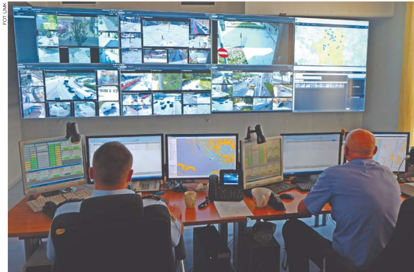
Inteligentny system pozwala śledzić wiele kamer jednocześnie

Kamery, poza Śródmieściem i dzielnicami, będą również umiejscowione w 10 punktach na głównych arteriach drogowych Katowic – będą skanować tablice rejestracyjne przejeżdżających pojazdów, co będzie dużym ułatwieniem dla policji w obszarze ścigania złodziei samochodów. Dzięki skanowaniu urząd na bieżąco będzie dysponować informacjami o natężeniu ruchu drogowego. Takie dane zbierane w dłuższym okresie będą bardzo cenne np. podczas tworzenia planów rozwoju infrastruktury komunikacyjnej w mieście czy planowania remontów.