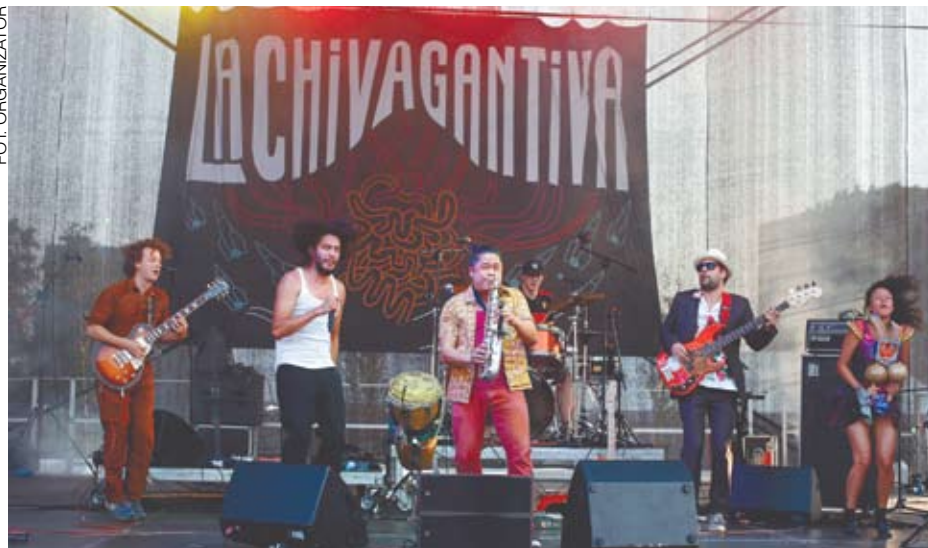
151. Urodziny Miasta Katowice: na scenie La Chiva Gantiva

Katowice będą w październiku 2017 roku gospodarzem jednego z najbardziej prestiżowych europejskich wydarzeń muzycznych – Targów Muzyki Świata WOMEX (World Music Expo). Przyciągną one tysiące specjalistów, ale będą też gratką dla miłośników dobrej muzyki.