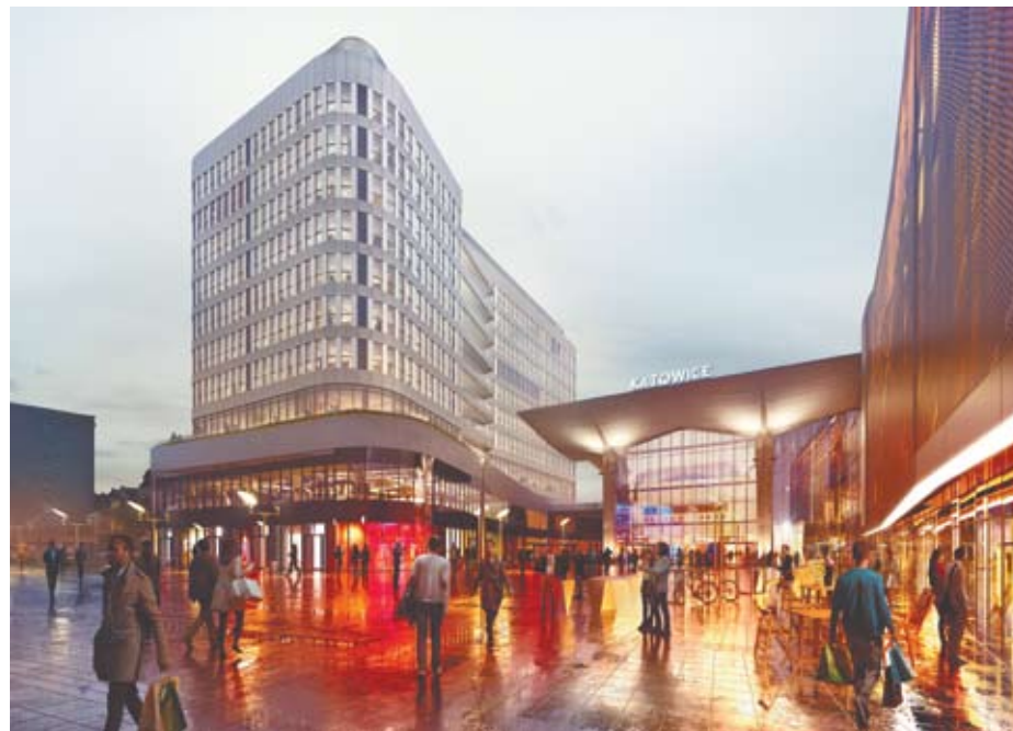
Grand Central (wizualizacja)

Firma Ghelamco zakupiła grunt inwestycyjny przy skrzyżowaniu ulic Chorzowskiej i Ściegienego. To niezabudowany teren tuż przed hipermarketem Tesco (część Silesia City Center). Nieruchomość ma powierzchnię blisko 4,4 tys. m 2 . Deweloper na razie nie zdradza szczegółów projektu, który chciałby zrealizować na zakupionej działce. Firma poinformowała jedynie, że ma to być obiekt biurowy. Ghelamco to belgijski deweloper inwestujący w Belgii, Polsce, Rosji i na Ukrainie. Budowa biurowców stanowi trzon jego działalności. W Katowicach firma realizowała dotychczas jedną inwestycję – w 2010 roku oddała do użytkowania biurowiec Katowice Business Point, mieszczący się przy ul. Ściegienego 3. W 2014 roku budynek został sprzedany amerykańskiej firmie Starwood Capital Group za 44,3 mln euro.