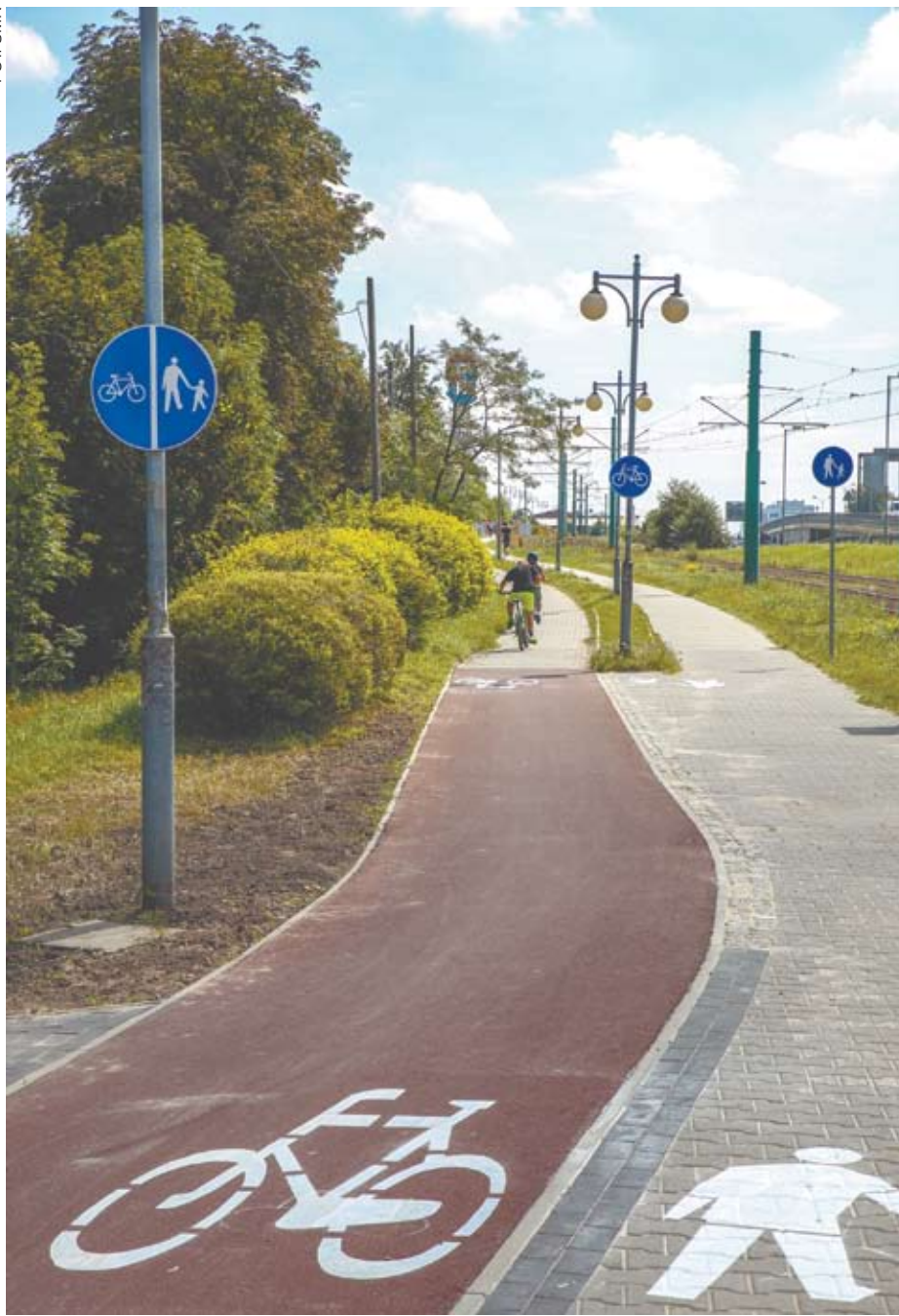
Ścieżka rowerowa wzdłuż ul. Chorzowskiej

wśród katowiczian i turystów, co potwierdzają statystyki. Tylko od 29 kwietnia br., kiedy wznowiono w mieście wypożyczenia