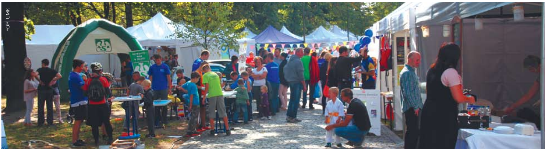
Podczas pierwszej edycji festiwalu

W organizacjach pozarządowych jest się po to, aby tworzyć przestrzeń dla spełniania marzeń i budowania szczęścia – zarówno dla innych ludzi, jak i swojego prywatnego.