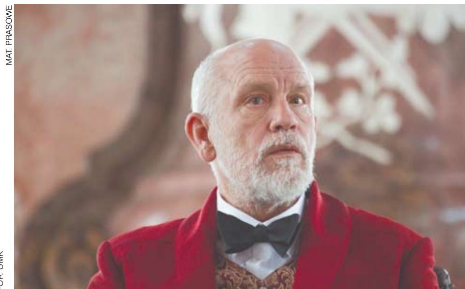
MAT. PRASOWE FOR. UMK