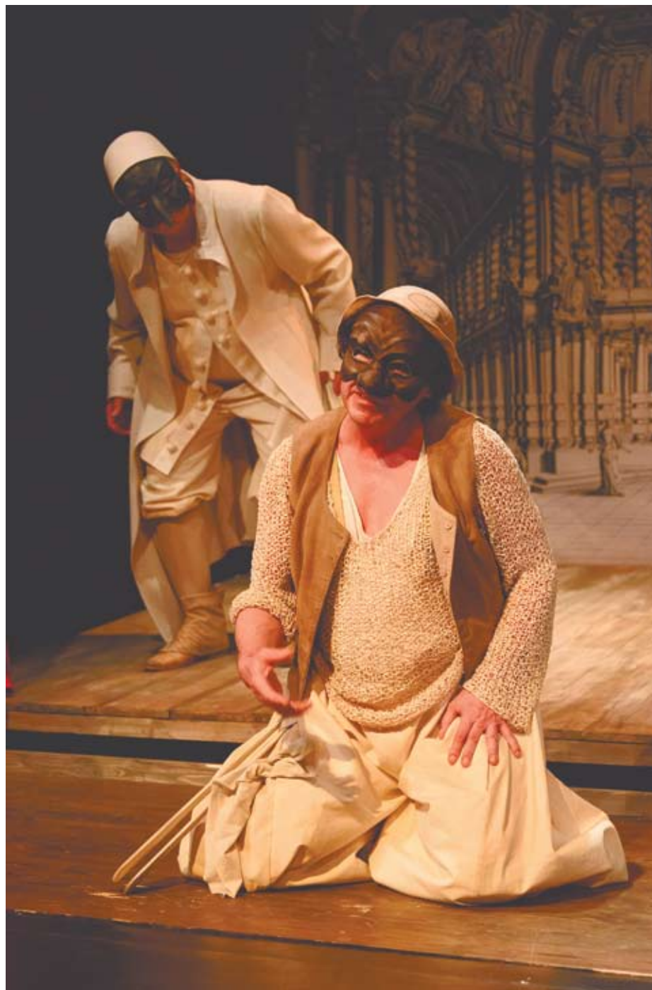
ATENEUM: „Miłość do trzech pomarańczy” Zbigniewa Głowackiego

Zwiedzanie pracowni plastycznej oraz warsztaty plastyczne.