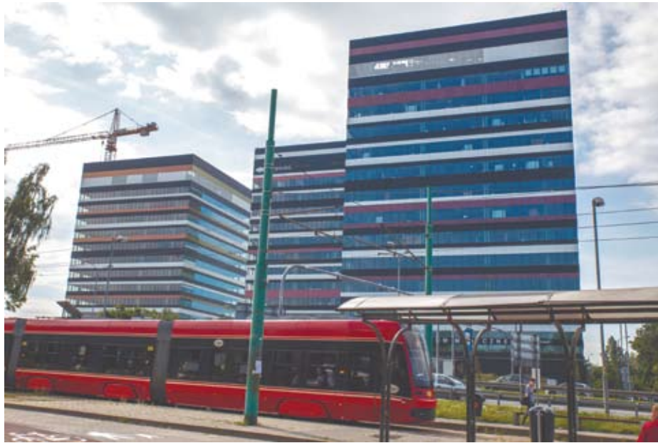
Silesia Business Park przy ul. Chorzowskiej

Oprócz dostępności wykwalifikowanej kadry dla potencjalnego inwestora ważny jest również szereg innych czynników atrakcyjności inwestycyjnej, takich jak między innymi dostępność najwyższej klasy powierzchni biurowych, usytuowanie miasta czy wysoka jakość życia. Rynek powierzchni biurowej w Katowicach zajmuje piąte miejsce w Polsce. Doskonała lokalizacja, potencjał gospodarczy oraz konsekwentna polityka miasta