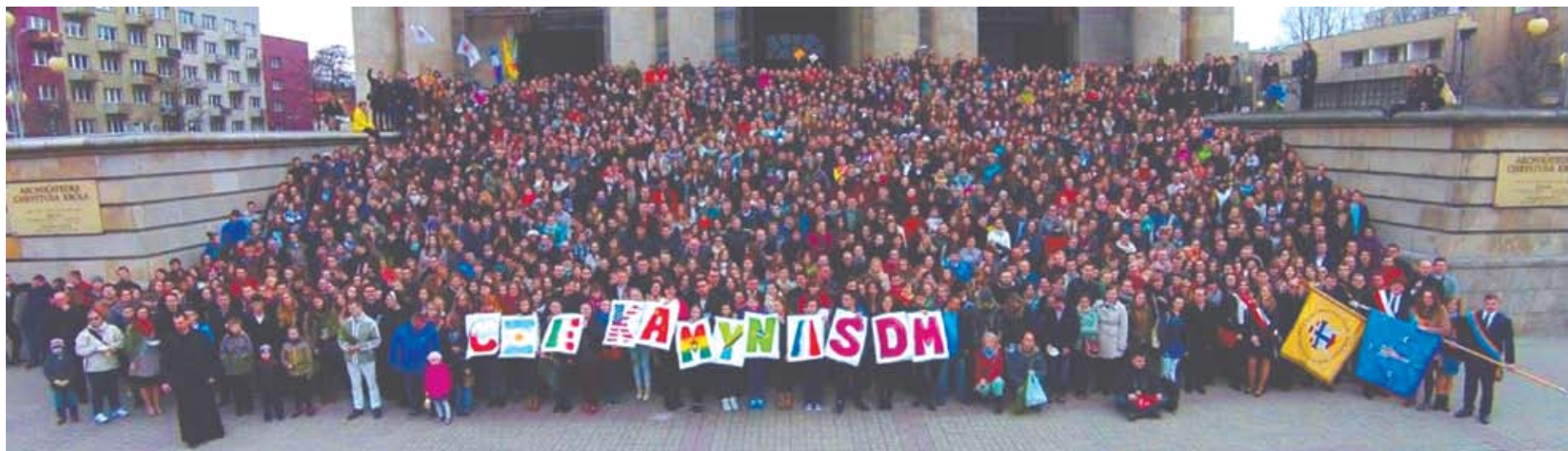
XXX ŚDM w archidiecezji katowickiej

(KLAUDYNA CIACHERA, DIECEZJALNE CENTRUM ŚDM)