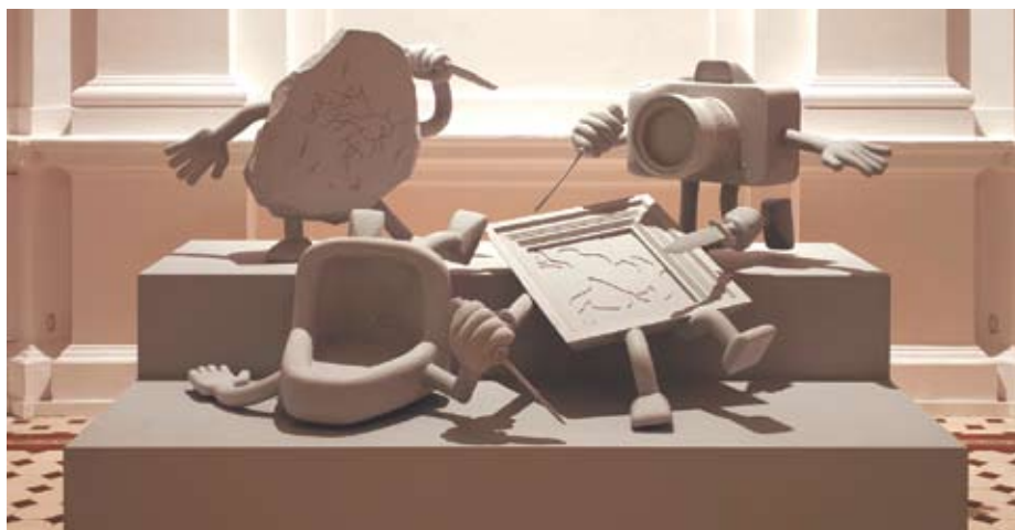
BWA: Rafał Dominik Live HD – sztuka w naszym wieku