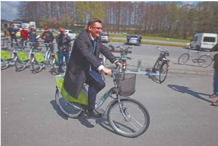
Prezydent otworzył jedną z 10 dostępnych w mieście stacji rowerowych