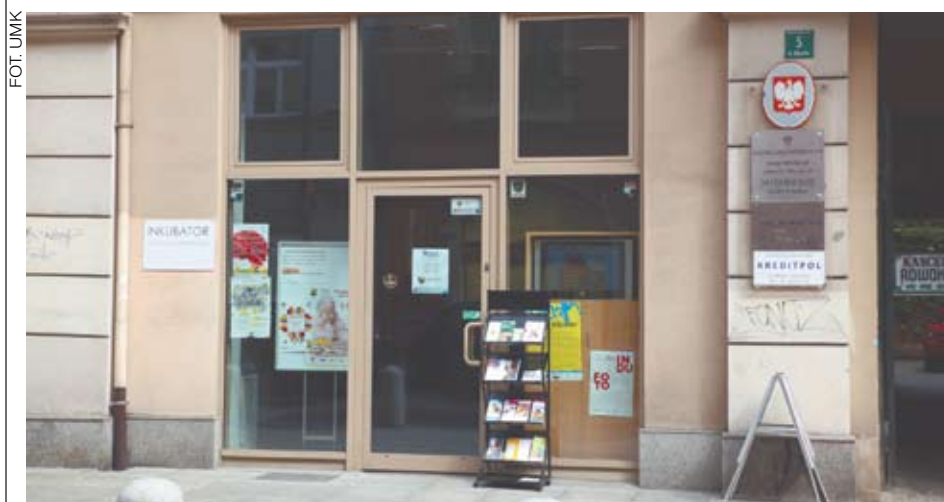
Centrum Organizacji Pozarządowych przy ul. Młyńskiej 5

Stowarzyszenia Inicjatywa, członek Powiatowej Rady Działalności Pożytku Publicznego w Katowicach. (WPS)