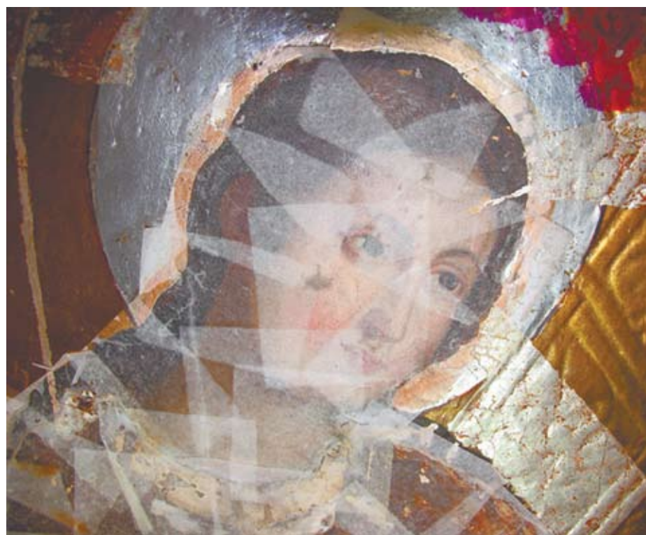
MHK: Sztuka Konserwacji

Art brut – jak to określił twórca pojęcia, francuski artysta, krytyk i marszand Jean Dubuffet