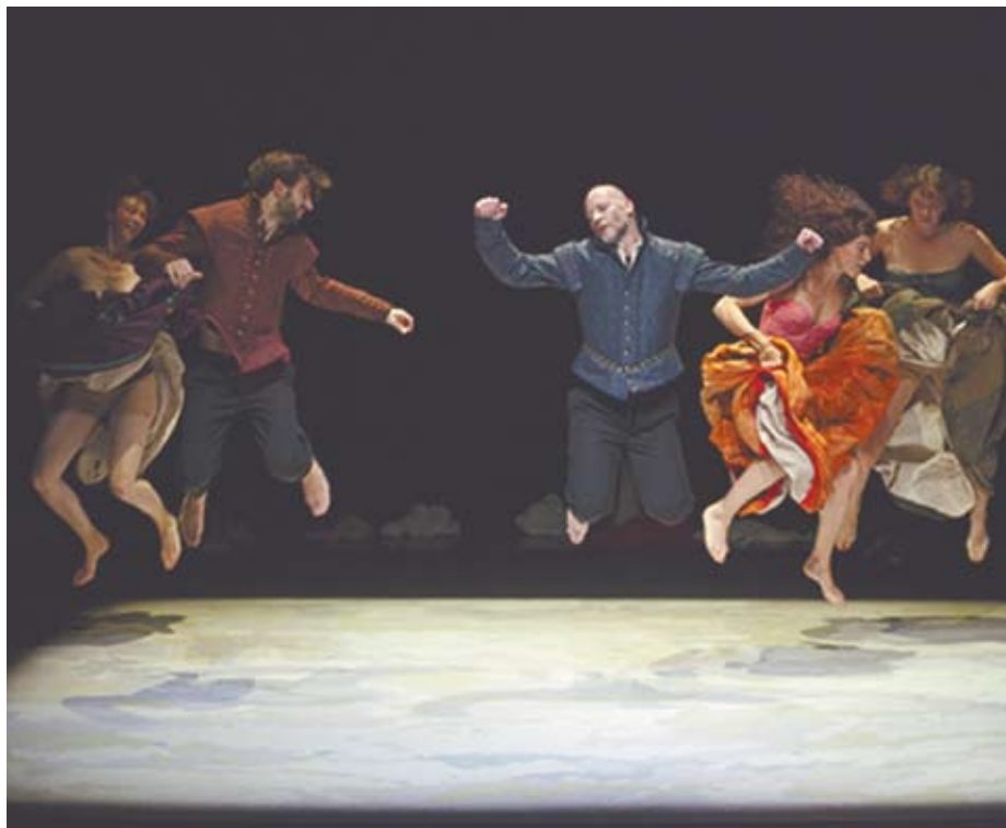
Teatr Ósmego Dnia