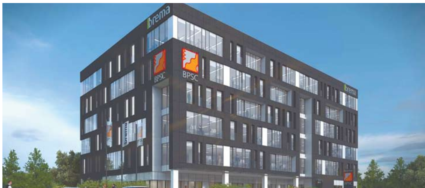
Biurowiec Brema powstanie w bocznej części al. Roździeńskiego (wizualizacja)

Katowicki oddział Rockwell Automation – największej na świecie firmy zajmującej się automatyką przemysłową – przeniesie się do budynku powstałego w ramach III etapu budowy kompleksu biurowego A4 Business Park, realizowanego przez Echo Investment przy ul. Francuskiej. Rockwell Automation w tym roku obchodzi 20-lecie istnienia w Polsce, jak również 10-lecie działalności w Katowicach. Do tej pory Amerykanie byli obecni w dwóch lokalizacjach w mieście: w Centrum Biurowym Francuska i przy ul. Roździeńskiej 49. W A4 Business Park swoją siedzibę będą miały między innymi: centrum operacji finansowych