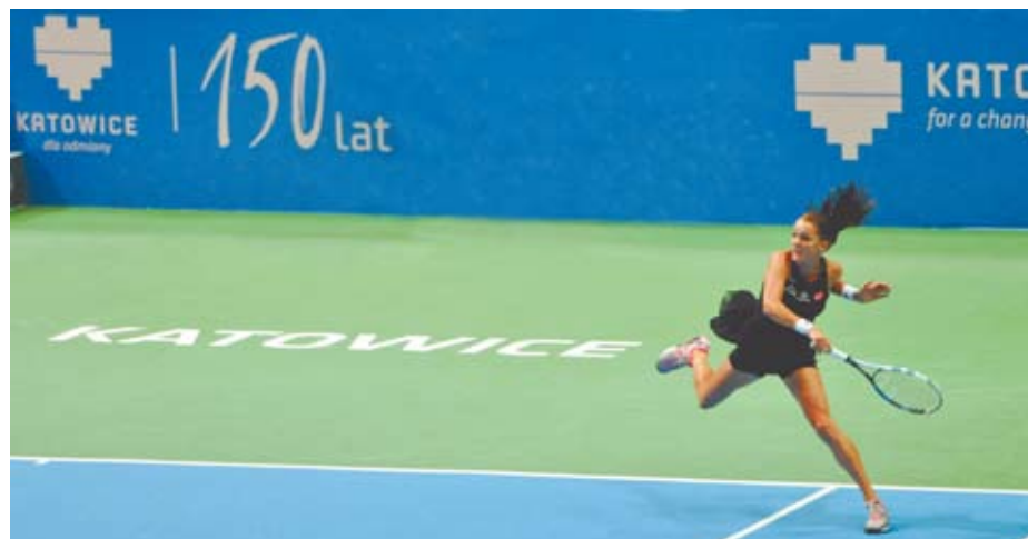
Agnieszka Radwańska podczas ubiegłorocznego turnieju

Na korcie centralnym Spodka i w Międzynarodowym Centrum Kongresowym odbędą się 74 mecze: 59 meczów singlowych i 15 meczów deblowych. O tytuł WTA Katowice Open 2016 tenisistki będą walczyły w niedzielę 10 kwietnia od godz. 13.00. – Tak jak w poprzednich latach, podczas tej największej imprezy tenisowej w Polsce, zawodniczki będą rywalizować piłkami Babolat na nawierzchni typu hard firmy Play It Global.