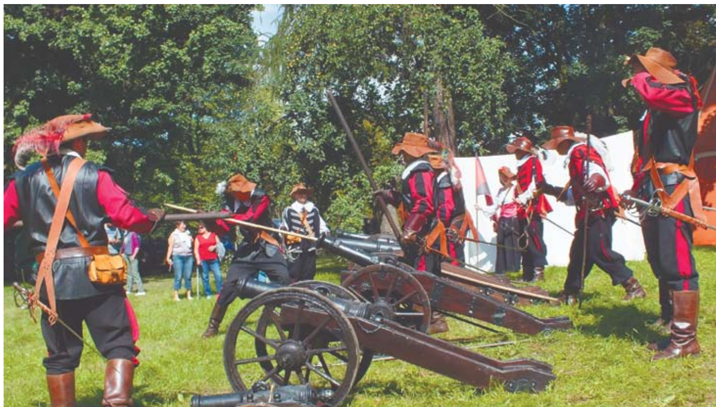
Największą atrakcją majowych rekonstrukcji będzie pokaz Korpusu Artylerii Najemnej