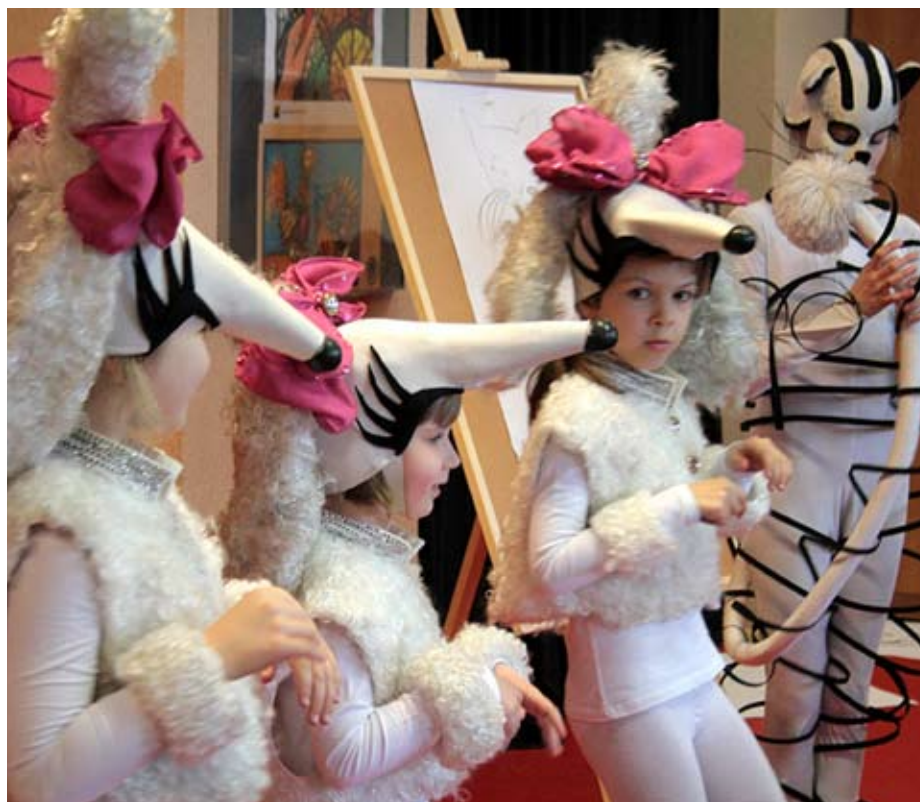
W Młodzieżowym Domu Kultury

Od 9 maja zapraszamy na bezpłatny kurs dla instruktorów teatralnych i nauczycieli. Obok zajęć teatralnych czy poświęconych analizie kultury i teatru prowadzone będą zajęcia