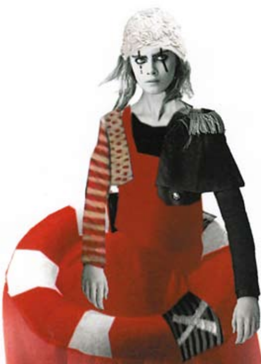
ATENEUM: Amelka, projekt kostiumu – Anna Chadaj