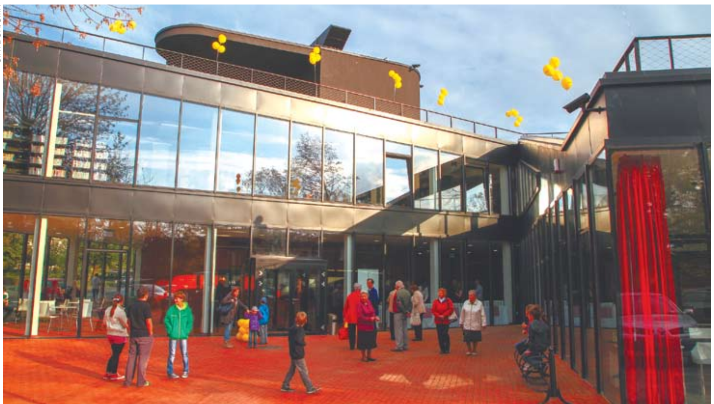
Podczas otwarcia MDK „Dąb”

umieszczenie pomieszczeń pod ziemią. Dodatkowo elewację budynku od strony ul. Krzyżowej wykonano z tafli szkła, tworząc w ten sposób zaproszenie dla przechodniów oraz możliwość podjeżdżenia, co dzieje się wewnątrz.