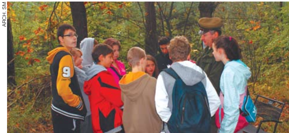
Młodzież z katowickich gimnazjów uczestniczyła w grze terenowej

Biuro Kadr Medycznych zabezpieczało także pod względem medycznym całą imprezę.