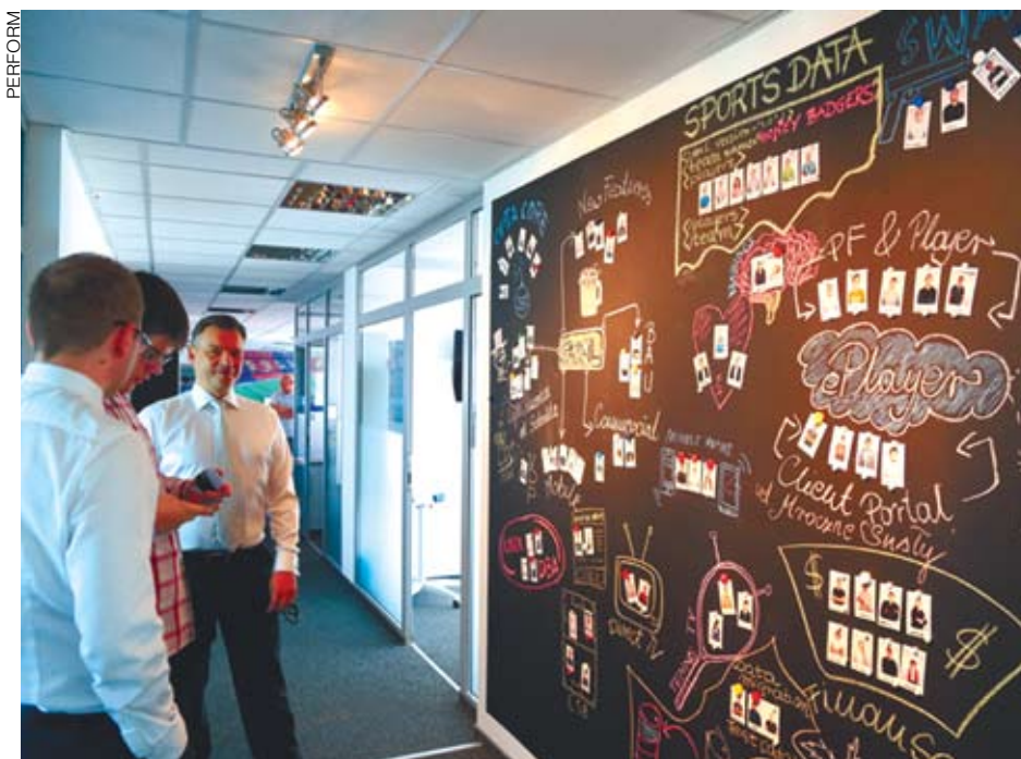
Firma PERFORM, będąca największym na świecie dostawcą treści związanych ze sportem, poszukuje nowych programistów do pracy w Katowicach

Pomóc w naborze programistów m.in. do pracy w PERFORM ma kampania Urzędu Miasta Katowice, skierowana do