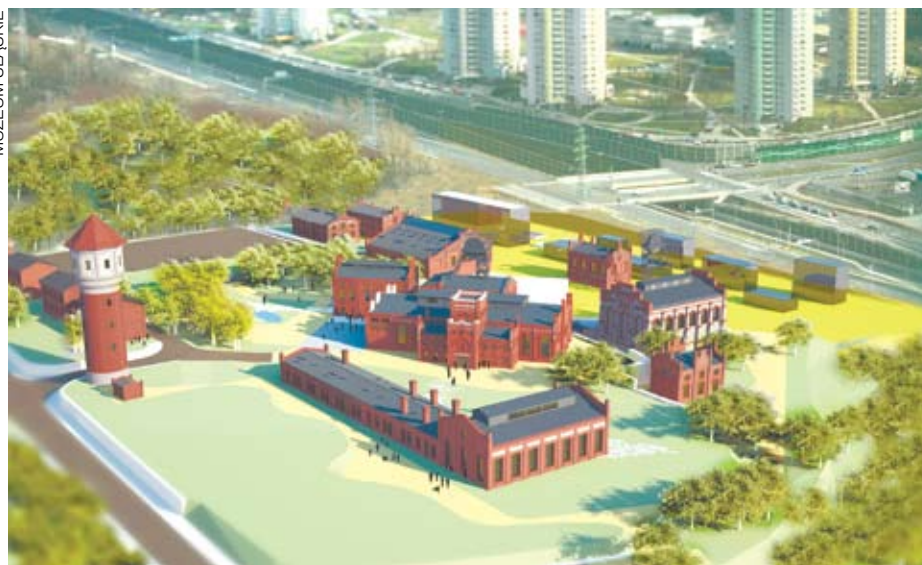
Wizualizacja zagospodarowania terenu wpisana w zdjęcie lotnicze

Budynek łaźni głównej ma pełnić rolę centrum kompetencji, usług i badań dla innych instytucji, jak również przeznaczony zostanie na potrzeby działów: Historii, Archeologii i Etnografii oraz Pracowni Powstań Śląskich. W obiekcie będą odbywać się koncerty, spotkania