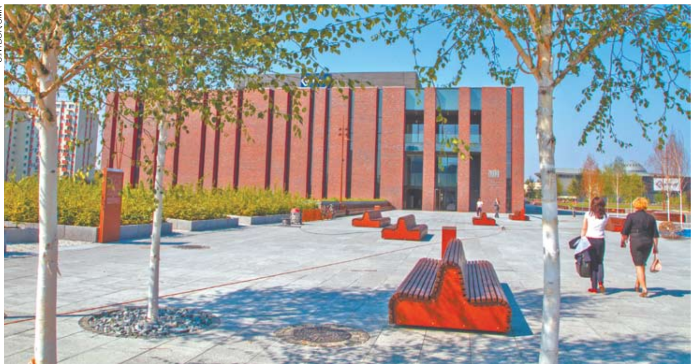
Nowa siedziba NOSPR przy pl. Kilara 1

W obiekcie przewidziano również salę kameralną dla mniejszych form muzycznych, która pomieści 300 widzów, a także