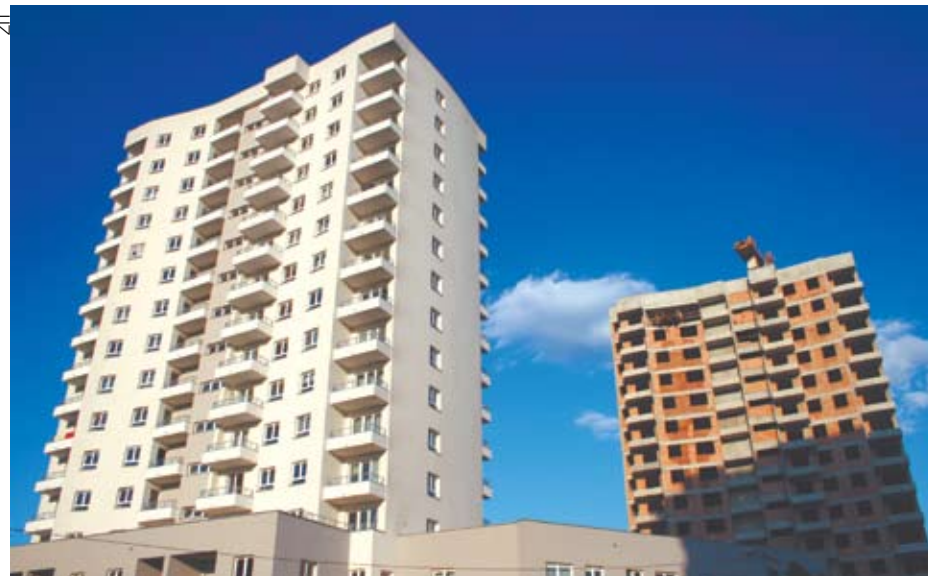
Dwie z 4 Wież na os. Tysiąclecia

W hali odlotów terminalu pasażerskiego A w Katowice Airport został otwarty salonik Business Lounge. Salonik działa 7 dni w tygodniu w godzinach od 4.00 do 20.00 i został przygotowany dla osób podróżujących poza strefę Schengen. Do ich dyspozycji został oddany: bezpłatny Internet, telewizja, prasa krajowa i zagraniczna oraz urządzenia biurowe, a także napoje i przekąski. Business Lounge dostępny jest bezpłatnie dla posiadaczy karty Dinners Club, Priority Pass, Airport Angel i Citybank („Korzyści i przywileje”) oraz abonentów programu Premium Card Katowice Airport. Istnieje także możliwość wykupienia jednorazowego skorzystania z saloniku, zarówno poprzez system rezerwacyjny na stronie internetowej pyrzowickiego lotniska, jak i w trakcie rezerwacji biletu linii lotniczej Wizz Air na rejsy do krajów strefy Non-Schengen.