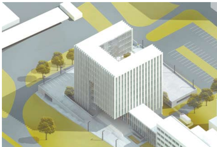
Zwycięski projekt pracowni Wojciech Gęsiak Studio Architektoniczne

Wewnątrz budynku zaprojektowano atrium, które łączy poszczególne piętra i doświetla wnętrza. Na wyższych kondygnacjach