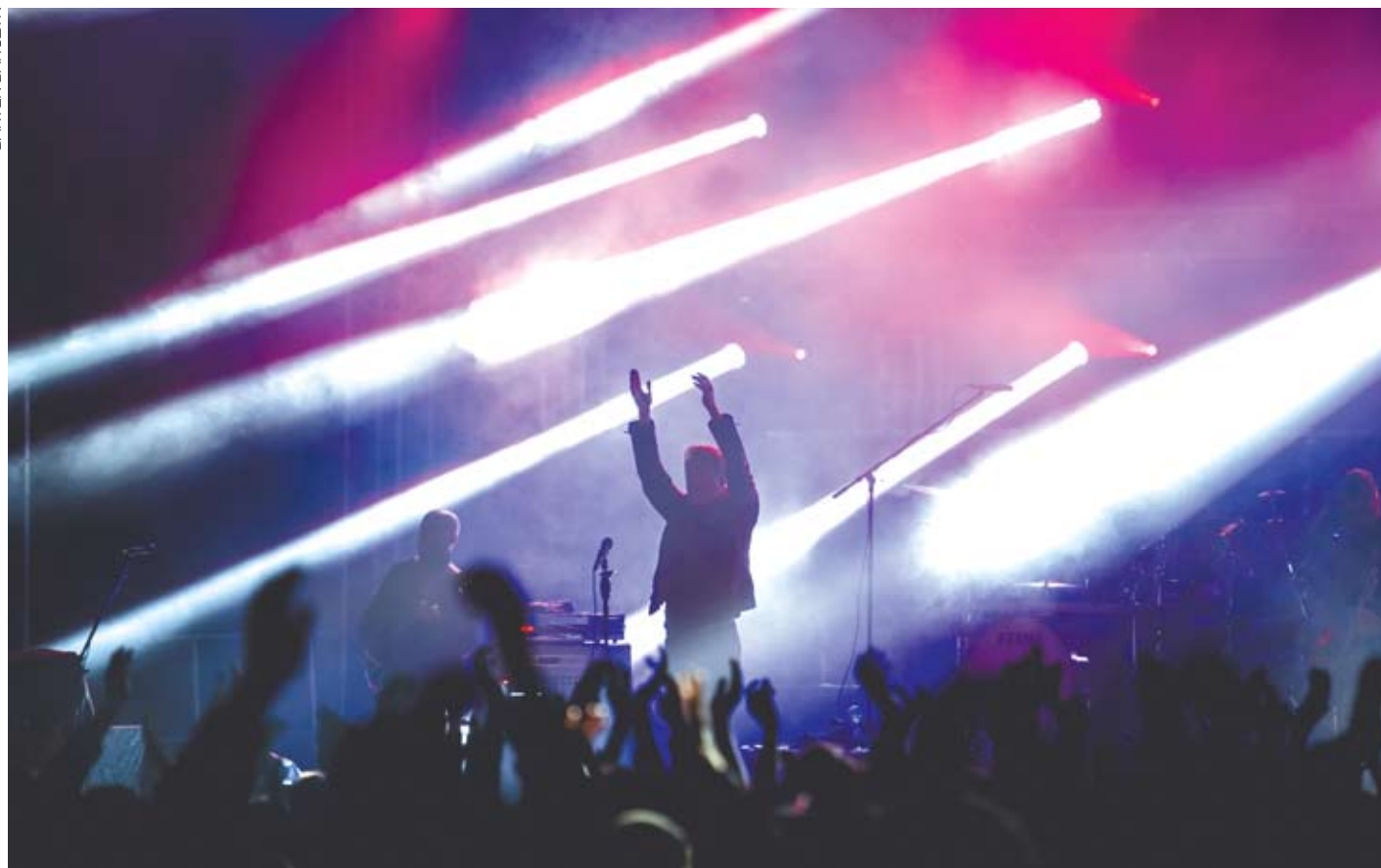
Ubiegłoroczne koncerty urodzinowe cieszyły się dużą popularnością