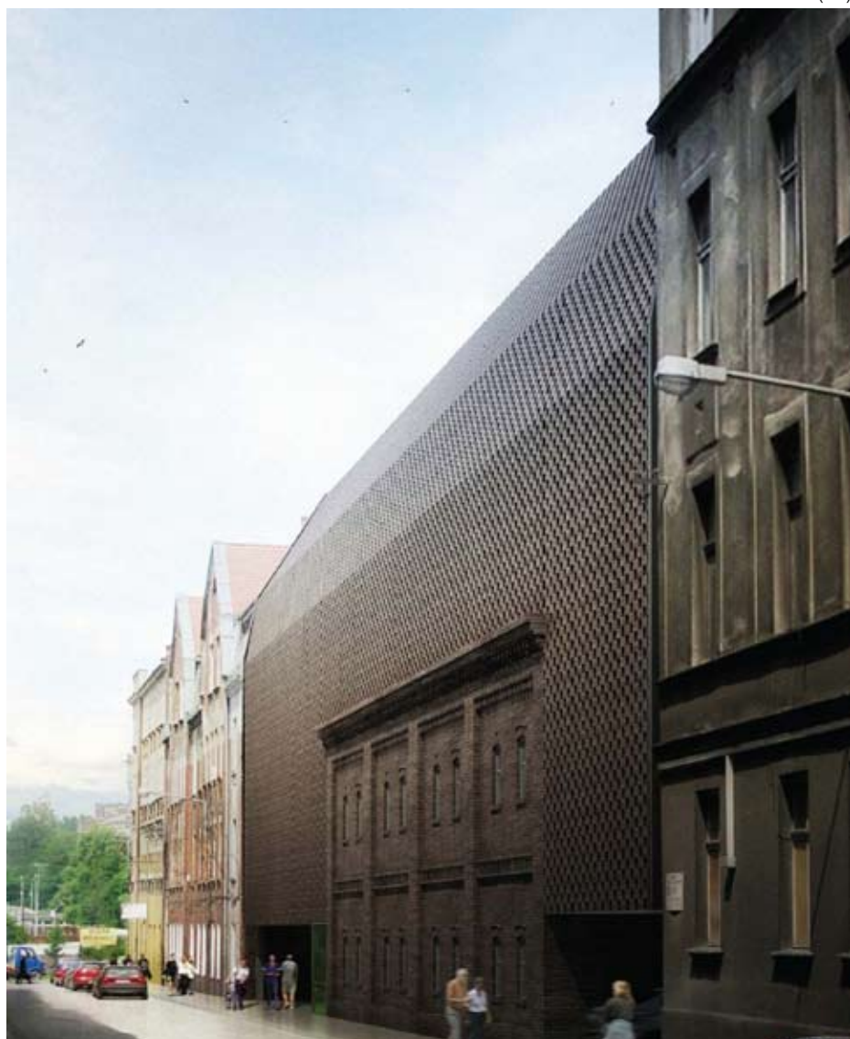
Projekt nowej siedziby Wydziału Radia i Telewizji