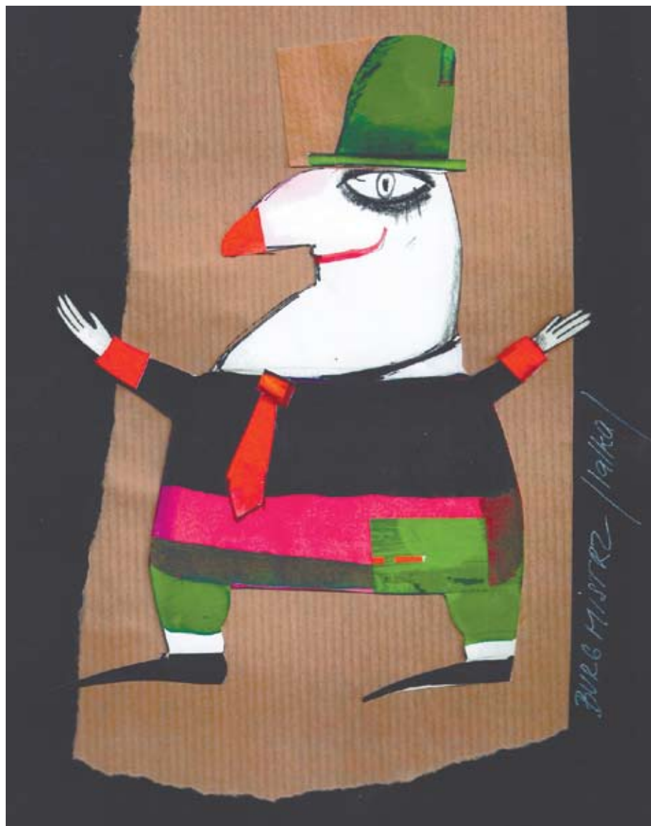
ATENEUM, KRAWIEC NITECZKA: Burmistrz (projekt scenograficzny autorstwa Evy Farkašovej)