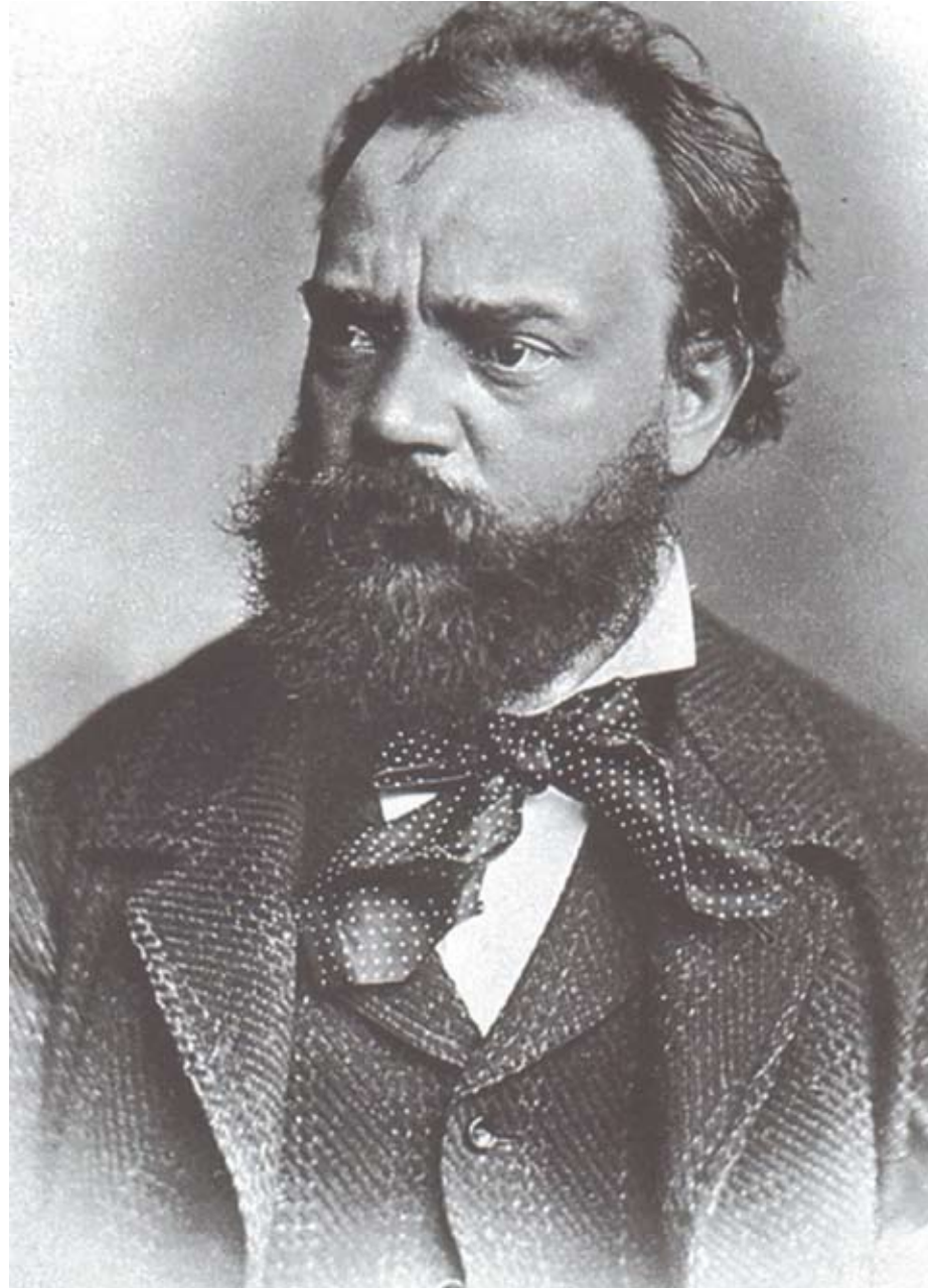
IPIUM SILESIA: Antonin Dvořák

W programie: utwory W. A. Mozarta, G. B. Pergolesiego, G. Fauré, G. F. Händla, A. L. Webera, K. Jenkinsa