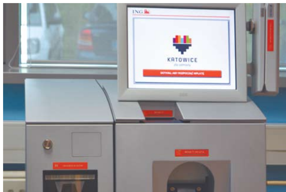
Pierwsze opłatomaty w Katowicach zostały zainstalowane przy ul. Francuskiej 70

Urządzenie umożliwia samodzielne dokonanie opłaty poprzez wybór rodzaju płatności za pośrednictwem ekranu dotykowego