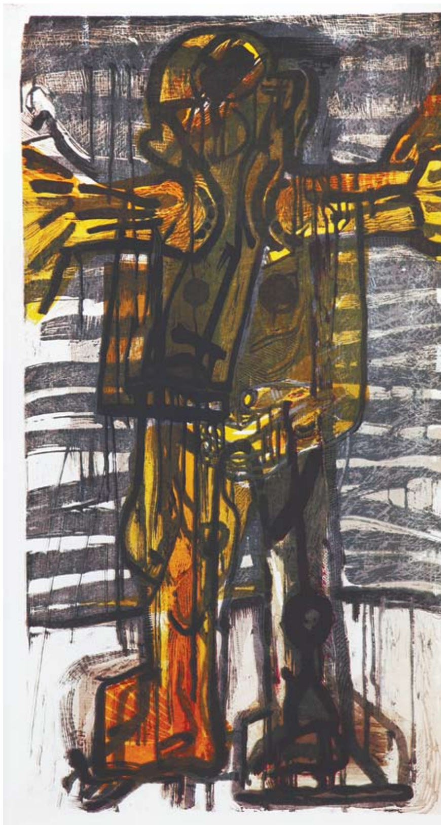
MUZEUM ŚLĄSKIE: Figura, A. Woźniak, drzeworyt

Wystawa planszowa prezentowana przez Muzeum Śląskie w hali odlotów Międzynarodowego