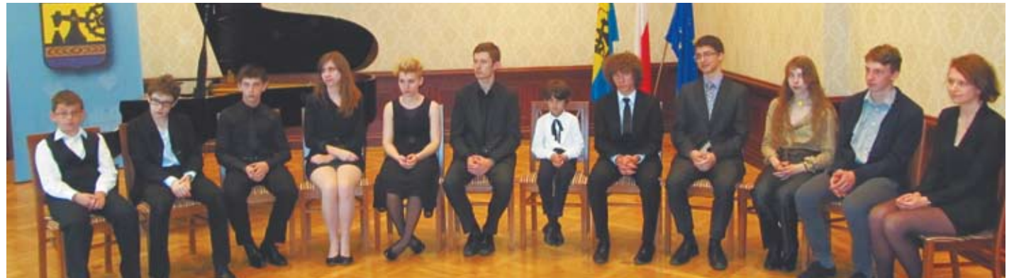
Laureaci tegorocznej nagrody

Państwowa Ogólnokształcąca Szkoła Muzyczna II stopnia im. K. Szymanowskiego, ul. Ułańska 7b: