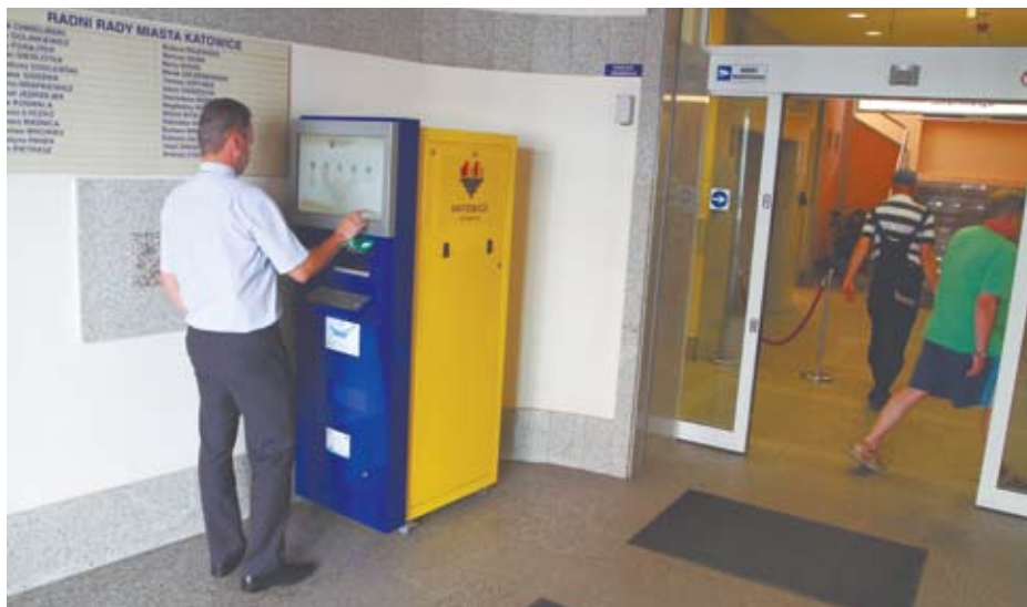
Infokiosk przy ul. Młyńskiej 4 jest czynny również po godzinach pracy Urzędu

Realizując więc drugi etap przedsięwzięcia, Miasto postanowiło wzbogacić tę sieć o kolejne punkty. Można za ich pośrednictwem nie tylko skorzystać z Internetu, ale także wydrukować dokument dostępny do ściągnięcia na stronie instytucji, który po wypełnieniu i odręcznym podpisaniu (bez konieczności stosowania podpisu elektronicznego) można „złożyć” w urzędomacie zamiast w Urzędzie. Infokiosk skanuje wówczas dokument i wysyła jego wersję elektroniczną do Urzędu Miasta Katowice, a klient otrzymuje potwierdzenie przekazania dokumentu z datą i godziną przyjęcia przez urzędomat. Oryginały składowane są w pojemnikach