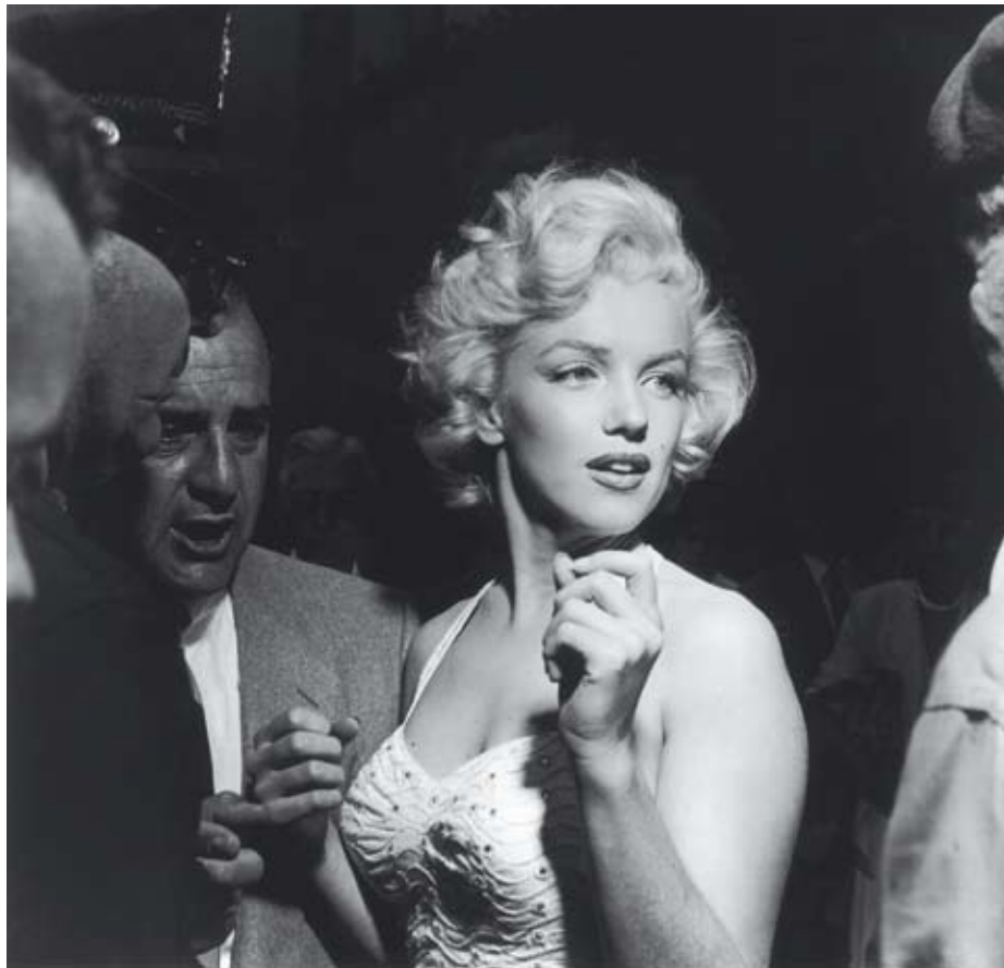
CKK: Do DNA Marilyn (wystawa)