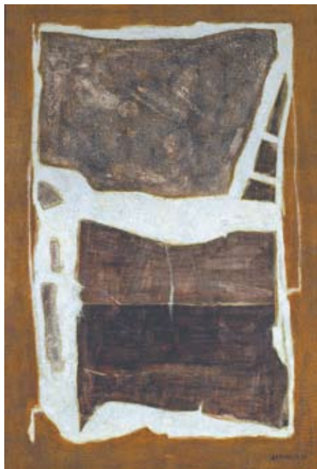
ANDRZEJ S. KOWALSKI: F1

W celu rezerwacji terminu i ustalenia szczegółów warsztatów prosimy o kontakt: Dział Programowy – Edukacja Artystyczna, tel. 32 259 90 40 wewn. 13 lub Aneta Zasucha – kom. 510 853 090; edukacja@bwa.katowice.pl