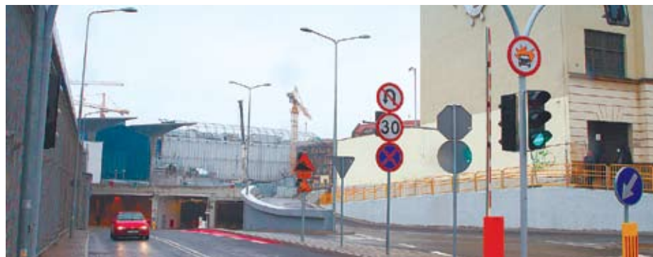
Nowa droga przejmie ruch z rynku

– Nowa jezdnia znacząco ułatwi kierowcom poruszanie się w okolicach Urzędu Miasta i dworca kolejowego oraz Galerii Katowickiej. Będzie dłuższa i bardziej komfortowa niż droga, która łączyła ul. Młyńską