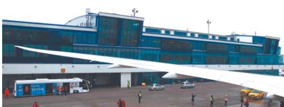
Port Lotniczy KATOWICE w Pyrzowicach

Najbardziej ciekawie i egzotycznie zapowiada się kierunek linii Wizz Air. Połączenie z Kutaisi stawia Katowice w gronie jedynie dwóch miast Unii Europejskiej (drugim jest Warszawa), które ma bezpośrednie, stałe i niskokosztowe połączenia z Gruzją. Loty będą realizowane dwa razy w tygodniu we wtorki i soboty. W przypadku dużego zainteresowania przewoźnik nie