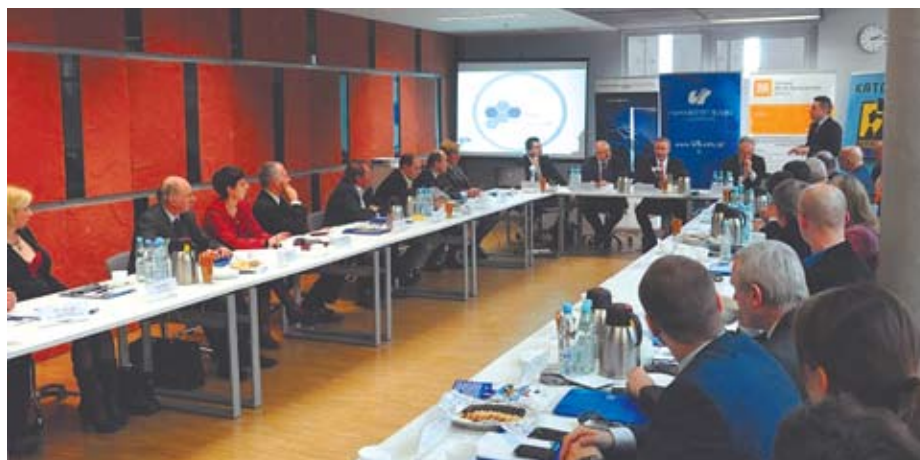
Spotkanie konsorcjum Śląskiego Klastra „Nano”

Śląski Klastr „Nano” stanowi platformę współpracy przedsiębiorców, zespołów naukowych i organizacji wsparcia biznesu przy jednoczesnym wykorzystaniu atutów Katowic, takich jak: potencjał osób, przedsiębiorstw, uczelni wyższych, jednostek naukowo-badawczych instytucji otoczenia biznesu oraz samorządów lokalnych i regionalnych.