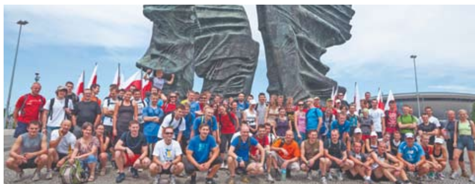
Miłośnicy przygód z całej Polski zjeżdżają do Katowic