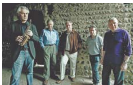
Jan Garbarek i The Hilliard Ensemble

Muzyka rozbrzmiewająca pod koniec kwietnia i na początku maja w Katowicach w ramach festiwalu będzie wirowała wokół magicznej daty 30 kwietnia – Światowego Dnia Jazzu. To międzynarodowe święto muzyki synkopowanej, stworzone przez UNESCO rok temu, jest siłą sprawczą muzycznych wydarzeń, które przygotowuje Instytucja Kultury Katowice – Miasto Ogrodów. Tego dnia w kinoteatrze Rialto wystąpi Manu Katche, francuski mistrz instrumentów perkusyjnych, który już w latach 80. XX wieku