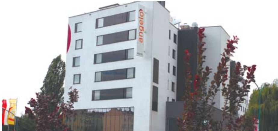
Dzięki spotkaniu właścicieli firmy Warimpex z przedstawicielami Miasta Katowice na targach MIPIIM Warimpex zdecydował się na wybudowanie hotelu Angelo przy ul. Sokolskiej.

Dzięki udziałowi w targach MIPIIM w Cannes powstały w Katowicach takie inwestycje jak np. biurowiec Katowice Business Point oraz hotel Angelo.