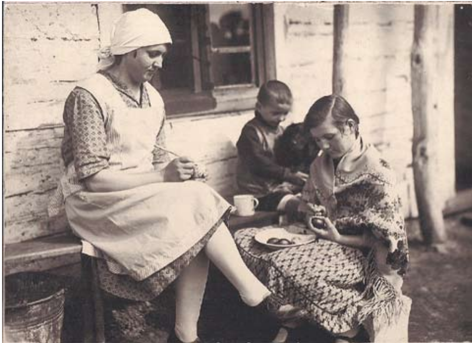
Śląskie krszonki to prawdziwa sztuka

W niektórych wioskach (pewnie z czystej zowiści!) chłopaki chodzą topić marzanioka. W chopskim odzieniu, z butelką po wódcę u szyi. Wyganiają nie tylko zimą, nie tylko złem, ale alkoholizm.