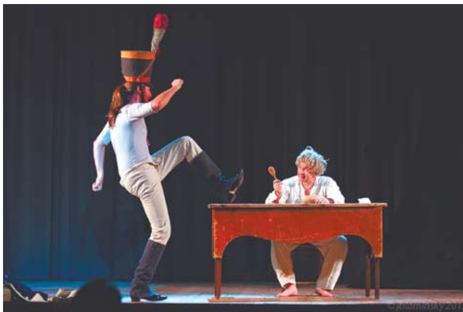
CKK: Wszyscyśmy z jednego szynela

Przeprowadzamy również warsztaty szkoleniowe dla nauczycieli, pedagogów, psychologów, animatorów oraz osób zajmujących się kulturą i sztuką, które propagują nowoczesne