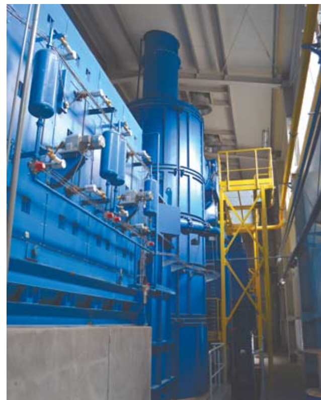
Zakład Utylizacji Odpadów przy ul. Hutniczej przetwarzający niegdyś odpady szpitalne i komunalne, obecnie – tylko medyczne

Nowy system zostanie wdrożony do końca czerwca 2013 roku i zacznie obowiązywać od 1 lipca 2013 roku. ● (red)