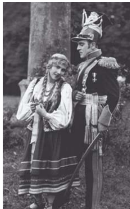
„Pan Tadeusz”, reż. Ryszard Ordyński, 1928 r.

dzień z kinem polskim, które pokazujemy z cyfrowo zrekonstruowanych kopii. W programie filmy w znakomitej obsadzie: „Jowita” (1967) w reż. Janusza Morgensterna, z udziałem Barbary Kwiatkowskiej i Daniela Olbrychskiego oraz „Pociąg” (1959) w reż. Jerzego