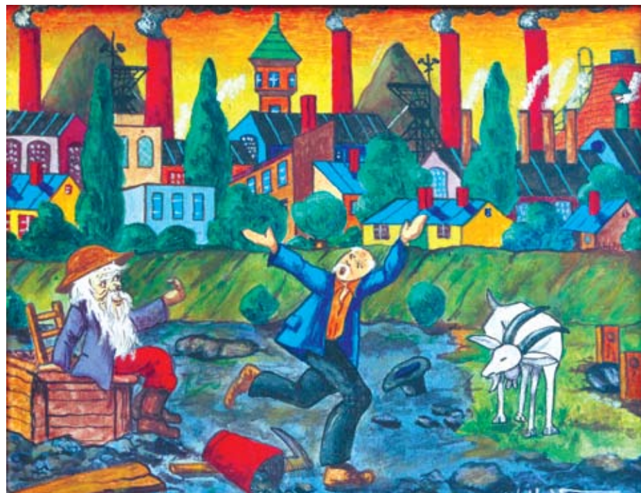
Paweł Wróbel, Spotkanie ze Skarbnikiem, 1978, wł. Muzeum Historii Katowic