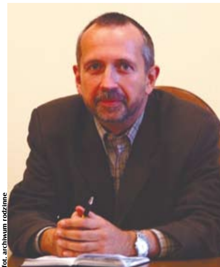
fol. archiwum rodzinne