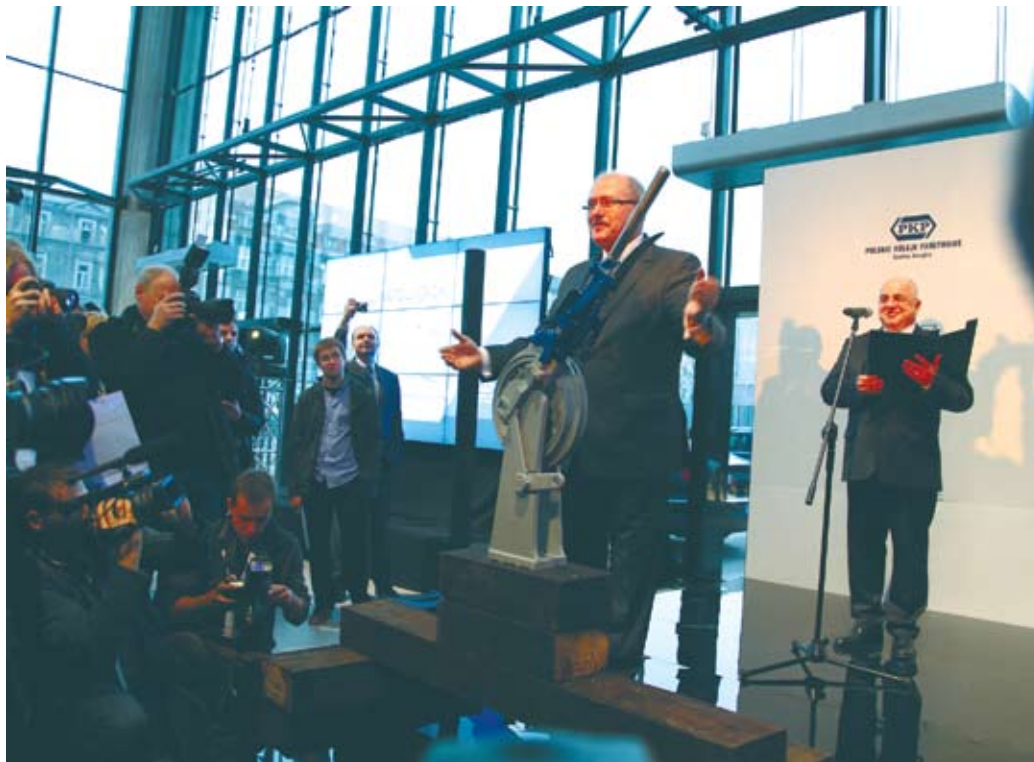
Symbolicznym przełożeniem zwrotnicy Prezydent P. Uszok dokonał oficjalnego otwarcia nowego dworca PKP

Otwarcie hali obsługi pasażerów to finał pierwszego etapu inwestycji na pl. Szweczyka, realizowanej wspólnie przez Neinver Polska