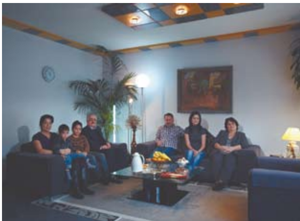
Saeed Iin

Na wernisaż wystawy i spotkanie z Miszą Kuballem w galerii „Centrum” w Centrum Kultury Katowice zapraszamy w piątek, 23 listopada o godz. 19.00. Wstęp wolny. ● (Łuka)