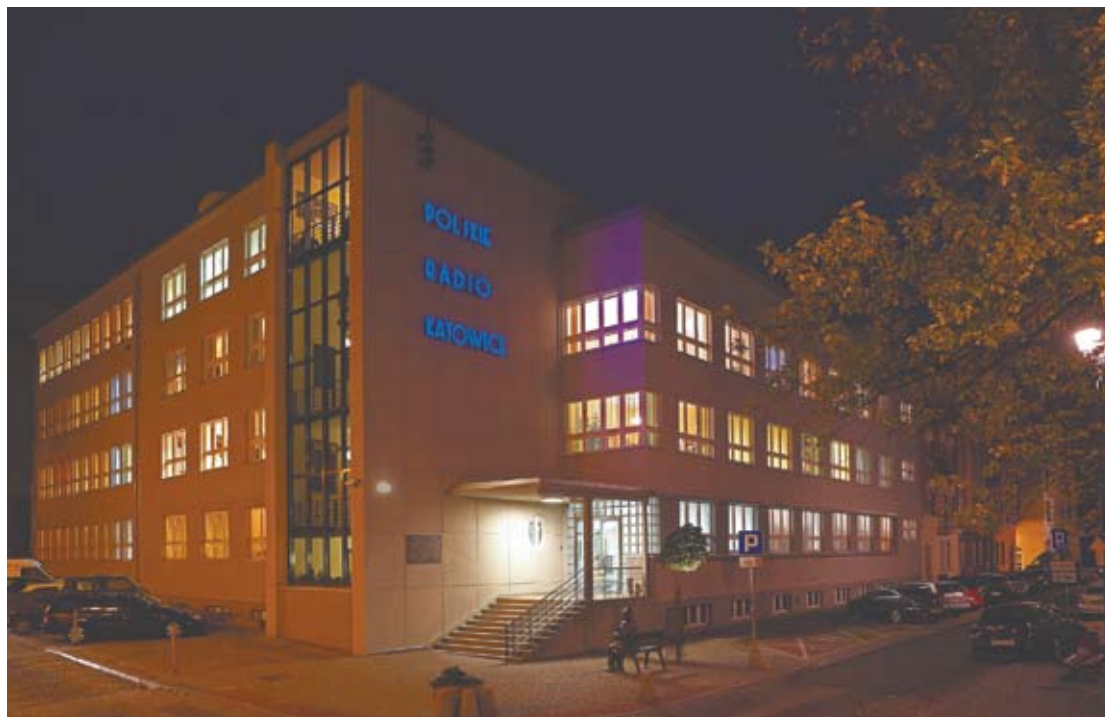
Świecący napis rozbłysnął na nowo 19 października 2012 roku, dokładnie w 75. rocznicę oddania do użytku siedziby Radia.

– Polskie Radio Katowice to przede wszystkim ludzie tworzący codziennie program. Ale przecież także gmach naszej Rozgłośni ma swój historyczny kształt i miejsce w katowickim pejzażu. W ostatnich