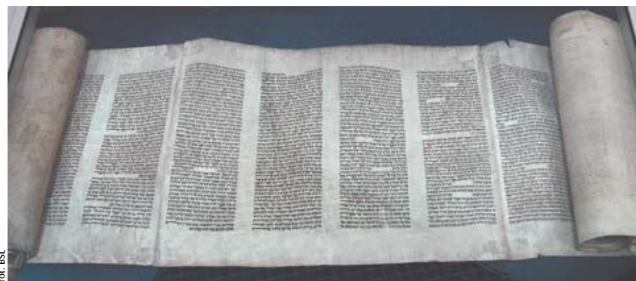
Ekspонат z wystawy „Biblia – księgą ksiąg” z 2007 r.