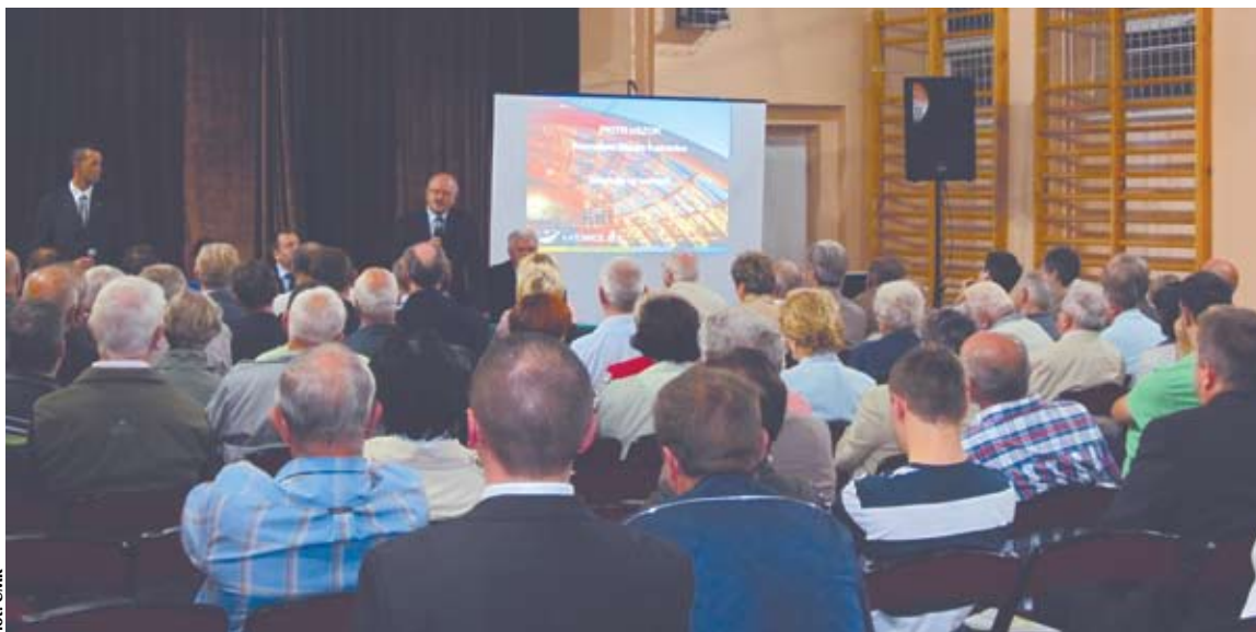
Spotkanie Prezydenta Miasta Piotra Uszoka z mieszkańcami Piotrowic i Ochojca, 18 września 2012 r.

Wychodząc naprzeciw potrzebom i oczekiwaniom mieszkańców, urząd sukcesywnie rozwija sposób i tryb docierania do mieszkańców, starając się jak najlepiej powiadamiać o planowanych i realizowanych zadaniach publicznych.