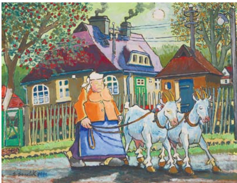
Powrót z pastwiska kóz, E. Gawlik

ul. ks. J. Szafranka 9, ul. Rymarska 4, ul. Kopernika 11/2 tel. 32 256 18 10 e-mail: mhk@mhk.katowice.pl www.mhk.katowice.pl