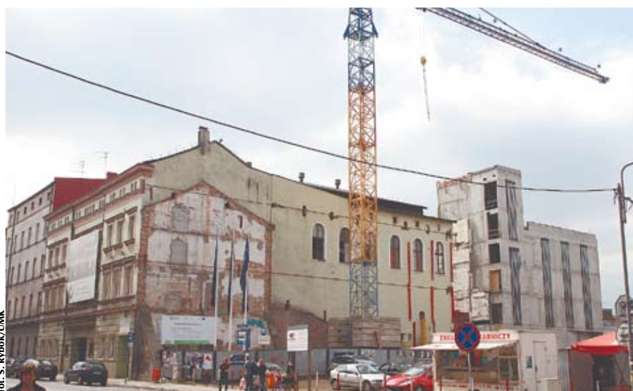
Rozbudowywana się siedziba przy ul. Sokolskiej

Przekonani więc, że to ostatni sezon poza siedzibą – remontowaną i rozbudowywaną ze środków unijnych i samorządu