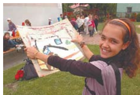
Na Dzień Dziecka najlepiej wybrać się na „Zarzczańskie obrazki”

Kolejna edycja pleneru malarskiego, który od lat przyciąga uzdolnioną plastycznie katowicką młodzież i utrwała piękne zakątki zielonego, rustykalnego Zarzecza