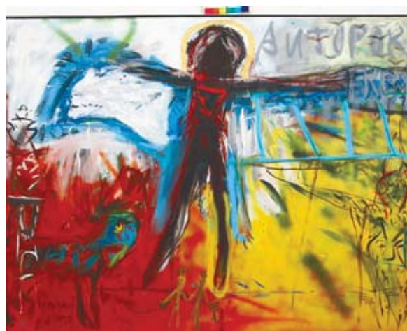
Ilavský Svetozár, „Autoportret”, 1990, Oravska Galeria w Dolnym Kubinie (Large)

Wystawa sztuki słowackiej obejmuje własne zbiory muzealne w zakresie grafiki warsztatowej, szkła artystycznego i rzeźby z lat 80. ubiegłego stulecia. Współczesne malarstwo słowackie, nieobecne w naszych zbiorach, zastąpiło na wystawie obiektami z Oravskiej Galerii Sztuki w Dolnym Kubinie. Z jej bogatych zbiorów rodzimej sztuki wybrano dzieła malarskie z lat 1989–2010, odzwierciedlające najnowsze trendy w sztuce słowackiej. Prezentację powyższych dzieł dopełnia pokaz szkła artystycznego, które jest znaczącym wyróżnikiem sztuki słowackiej – dawniej i dziś. Obejmuje on najnowsze prace autorstwa Patrika Illo, jednego z niezwykle interesujących współczesnych słowackich projektantów szkła unikatowego i użytkowego.