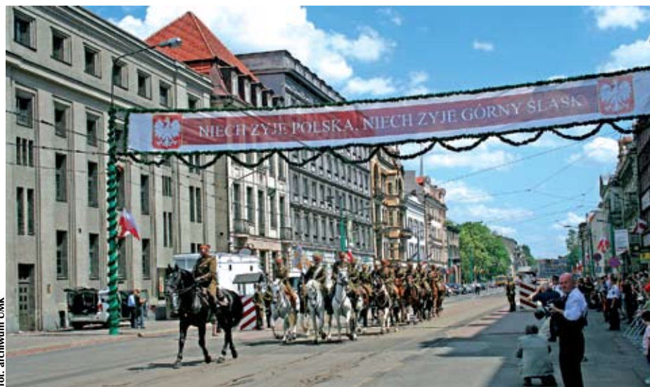
Uroczyste obchody 85. rocznicy wydarzeń z 20 czerwca 1922 roku

20 czerwca tego roku mija 90 lat od tamtych wydarzeń. Z tej okazji zaplanowano szereg spotkań i koncertów. Zachęcamy katowiczów do udziału w tych uroczystościach: