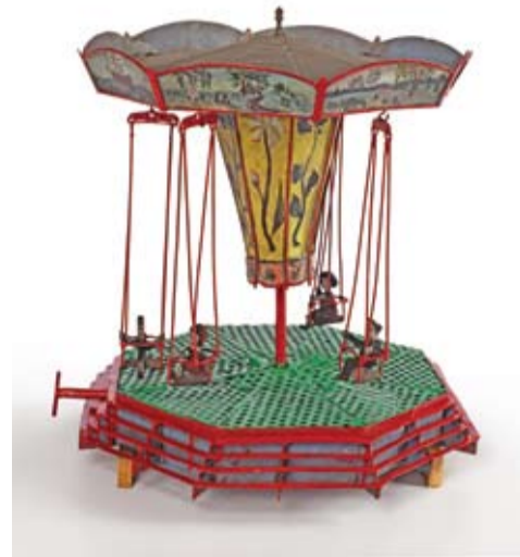
Zabawka, początek XX w.

ducha, myśli i materii uda nam się Państwu podczas tej wystawy zaprezentować.