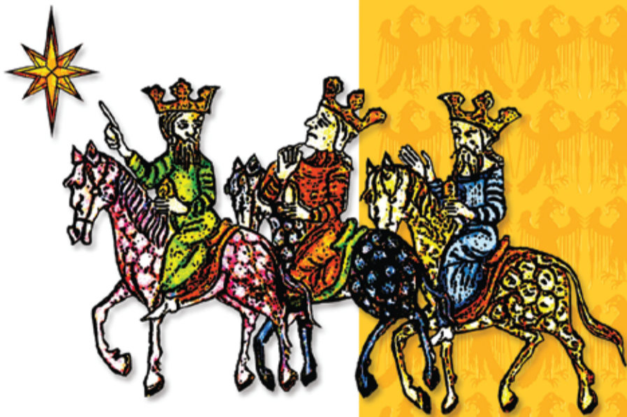
Projekt: Jarosław Klimek