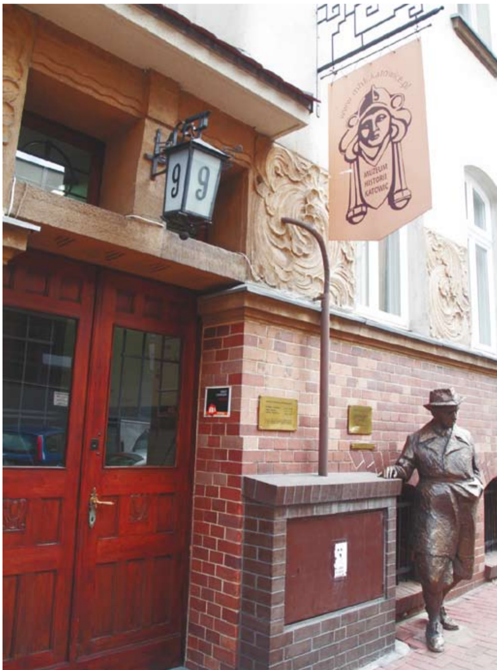
Siedziba MHK, ul. Szafranka 9