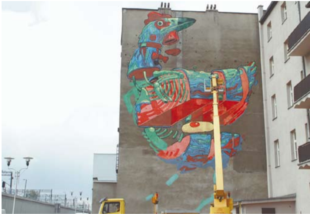
Aryz tworzy mural na Mariackiej Tyniej

Dzięki SK 2011 Katowice Street Art Festival miasto zyskało zupełnie nowy wymiar i kolory, a sami mieszkańcy – pretekst, by wyjść z domu i dobrze się bawić.