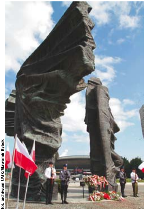
Pomnik Powstańców Śląskich