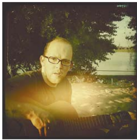
fol. materiały Rondo Sztuki

8 kwietnia, godz. 19.00 Rondo Muzyki: HONIG (Niemcy)