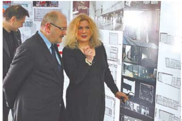
Dziekan WRiTV i Prezydent Miasta dyskutują o zwycięskim projekcie