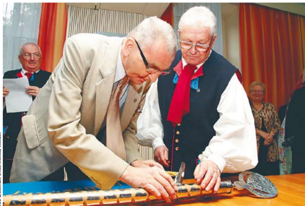
Podczas przygotowań do uroczystości z okazji 20-lecia Związku Górnośląskiego