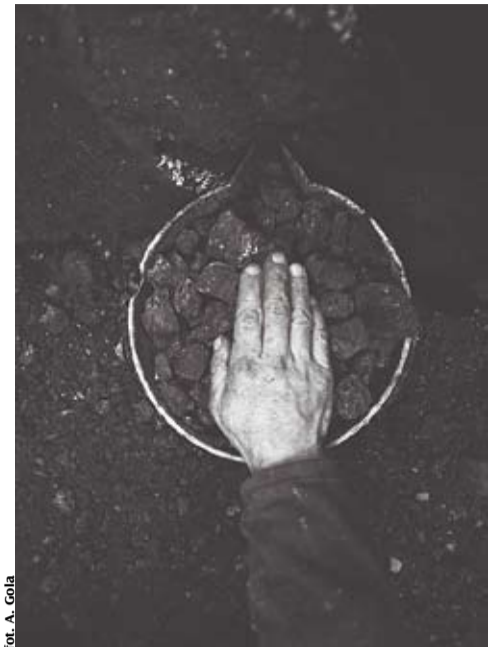
Biedaszyby, Zabrze 1995

Prezentowane fotografie są dokumentami, osadzonymi we współczesnych realiach życia na Górnym Śląsku. Autor penetruje różne środowiska i przestrzenie, tworząc zbiorowy portret grup społecznych, których życie jest wplecione w determinujące je otoczenie i zmieniające się oblicze przemysłu na Górnym Śląsku. Obrazy są autorskimi refleksjami, wielowątkową opowieścią o ludziach bytujących na obrzeżach miast, poza centrami i głównymi ulicami. Życie toczy się tam powoli w scenerii starych domów, na podwórkach robotniczych dzielnic, na sąsiadujących z ludzkimi osadami hałdach czy w cieniu ruin dawnych zakładów pracy. Autor odnajduje w tym świecie niezliczone bogactwo treści.