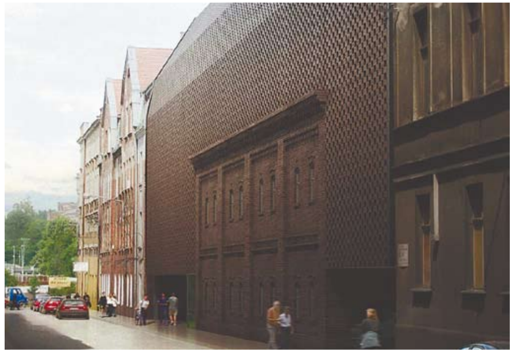
I nagroda w Konkursie – Projekt Grupy 5 Architektów