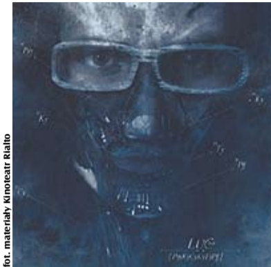
for. materiały Kinoteatr Rialto

Artysta przyjmować będzie zamiennie dwie postaci: jedną imitującą bas, perkusję i harmonię, drugą zaś rymującą w charakterystycznym dla artysty stylu, połączonym z kontaktem z publiką. Wszystko to w transowych, klubowych pętlach, mieszających najróżniejsze rytmy i estetyki. Wizualną część projektu tworzyć będzie animacja składająca się z fragmentów klipów autora, obrazów z kamer rejestrujących rozmaite maszyny i urządzenia oraz samą przestrzeń w czasie rzeczywistym.