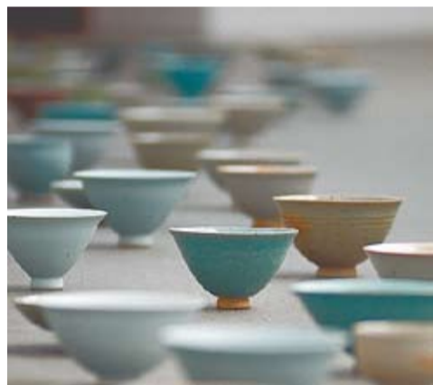
Fot. POST-GAUGUIN Young-Jae Lee-Schalen

11. Biennale Sztuki Wobec Wartości do 8 maja