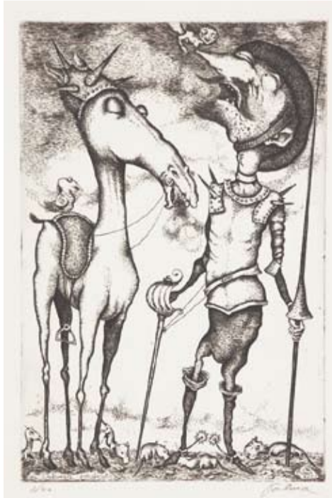
Albino Palma, Słodzone przez Dulcyneę