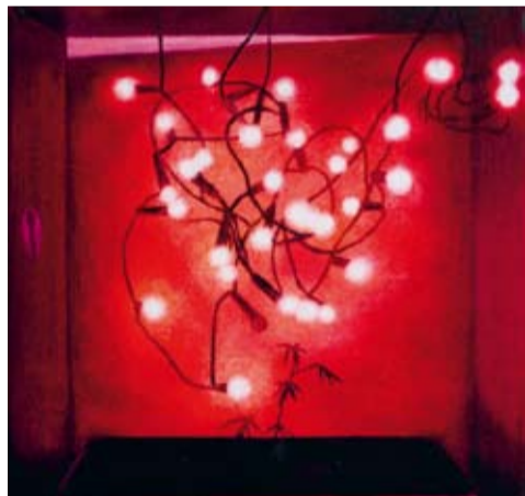
Maciek Nawrot, Bez tytułu

Wystawa prac Maćka Nawrota wystawę można oglądać do 13 marca Mała Przestrzeń Galerii