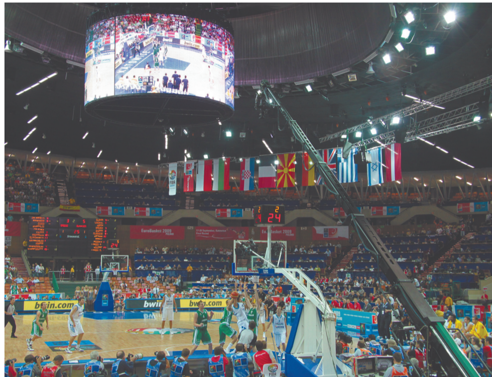
Fani koszykówki mogli kibicować swoim ulubieńcom podczas Eurobasketu 2009 w odnowionej hali Spodka

W 2008 roku przy ul. Sołtysiej powstało boisko treningowe „Podlesianka” (159 tys. zł). Dwa