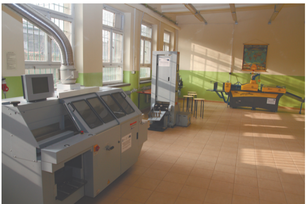
Rozbudowana baza dydaktyczno-wychowawcza i szkoleniowa w Zespole Szkół Poligraficzno-Mechanicznych

Za blisko 1,2 mln zł rozbudowano bazę dydaktyczno-wychowawczą i szkoleniową w Ze-