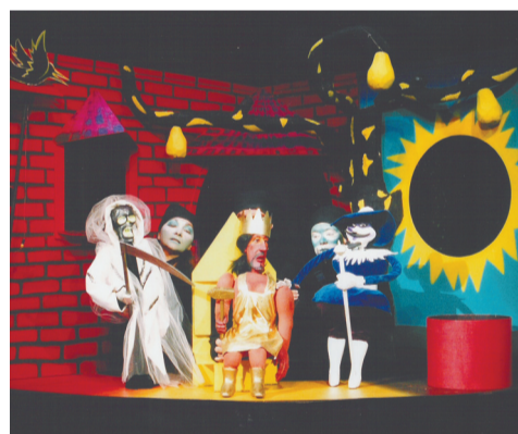
„Kowal” Gustawa Morcinka