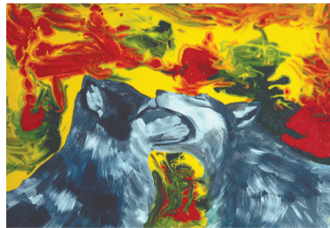
Praca Natalii Bażowskiej

Odwroćcie od rzeczywistości poskutkowało w przypadku prac zaproszonych artystek naruszeniem ustalonych granic, przebitką z lunatykowaniem po lesie, chwilową utratą przytomności, oślepieniem po wpatrywaniu się w słońce, nadmierną ruchliwością. Przymusowe wypłucie męczących, powracających pomysłów i wizji pozwoliło im na zacerpienie oddechu, wyrwanie się z bezruchu, sięgnięcie do najgłębiej położonych rezerw siły, wyobraźni, spontaniczności.