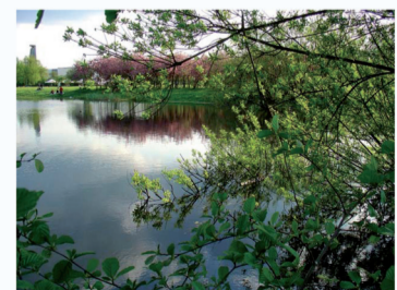
MAGICZNA DOLINA TRZECH STAWÓW W KATOWICACH

Pierwsze dziesięć osób, które na początku lipca odwiedzą Centrum Informacji Turystycznej przy Rynku 13 i udzielą prawidłowej odpowiedzi na pytanie: częścią jakiego większego kompleksu leśnego jest Dolina Trzech Stawów?, otrzyma album zatytułowany Magiczna Dolina Trzech Stawów w Katowicach . ● (mm)