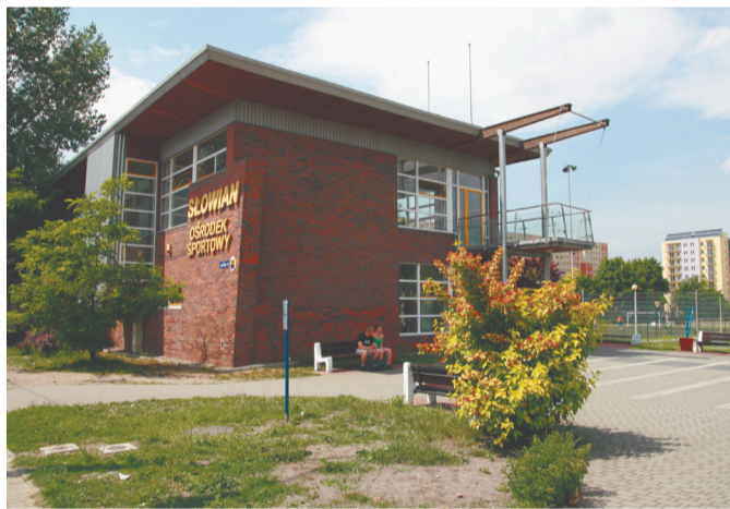
W 2003 roku przy ul. 1 Maja otwarto ośrodek „Słowian”

ki) o asfaltowej nawierzchni, plac zabaw dla dzieci oraz estradę (za blisko 500 tys. zł).