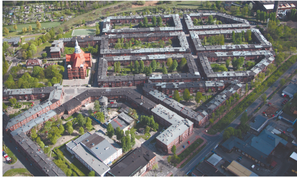
Filia MHK będzie prawdziwą wizytówką dzielnicy Nikiszowiec

Remont i modernizacja elewacji budynku MDK „Szopienice-Giszowice” przy ul. gen. Hallera 28 w latach 2007–2009 oraz zaplanowane na ten rok zainstalowanie oświetlenia zewnętrznego i neonu reklamowego zdecydowanie poprawiło estetykę budynku. W roku 2009 roku przeprowadzono remont zniszczonych schodów w budynku filii MDK przy ul.