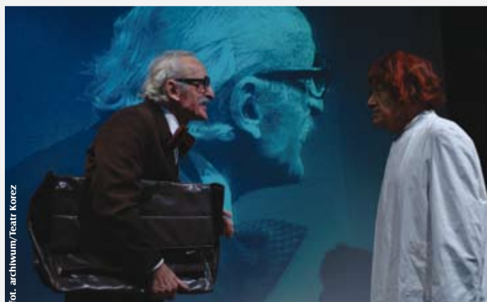
Scena z ubiegłorocznego spektaklu "Słoneczni chłopcy"

29 stycznia Obudź się i poczuj smak kawy (Teatr im. Jaracza, Łódź) 30 stycznia Impreza towarzysząca: Radiowa Akademia Rozrywki – Recital Artura Andrusa 31 stycznia Zazdrość (Teatr Capitol, Warszawa)