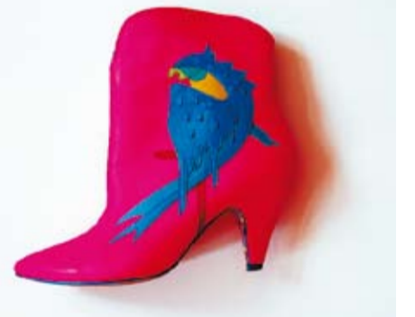
fol. Basia Bańda; Kozak