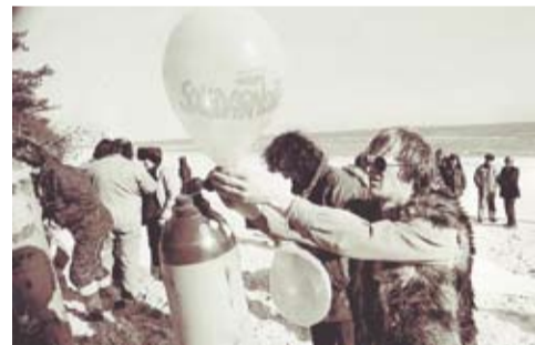
5 czerwca 1982, Bornholm, wypuszczenie balonów z materiałami informacyjnymi w kierunku Polski

Lot ku wolności 4 czerwca, godz. 12.00, plac przed Teatrem Śląskim oraz teren dawnej kopalni „Katowice”