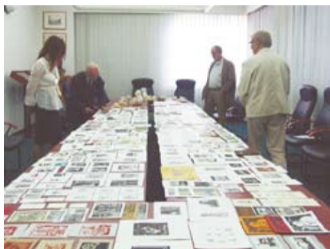
Jury VI Międzynarodowego Przeglądu Ekslibrisu Drzeworytniczego i Linorytniczego im. Pawła Stellera podczas obrad