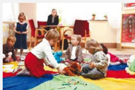
Było czego słuchać, ale można było też rysować...