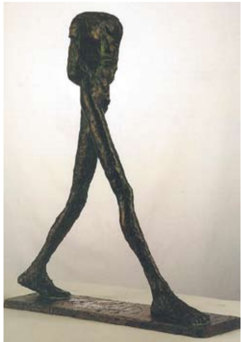
Kroczący I (Odmierzać czas), 1970, brąz, wł. rodziny