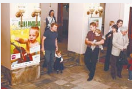
Filharmonia malucha stała się znakomitym sposobem na rodzinne spędzenie czasu.

Śląską okazał się strzałem w dziesiątkę. Na dwa koncerty Wiosenne, które odbywały się pod honorowym patronatem władz Katowic, nie dla wszystkich chętnych starczyło miejsc. Przybyło 768 słuchaczy, 269 rodzin! To było chyba najpiękniejsze – najmłodszy, od pięciolatek do ośmiolatek przy piersi i nie narodzonych jeszcze, ale już w brzuskach swych mam, na filharmonicznym koncercie razem z rodzeństwem, mamą i tatą. Rodzinnie, razem. I to nie dla kotka, który wlaź na płatek, ale dla arcydzieł muzyki barokowej, które przedstawiał filharmoniczny kwartet Subito. W czerwcowych koncertach Letnich muzykować zaś będzie kwintet dęty blaszany filharmoników Śląskich. Chętnym zwracamy uwagę: rezerwacja i sprzedaż biletów na Filharmonię malucha odbywa się wyłącznie drogą internetową poprzez stronę: www.yamahakatowice.pl (ms)