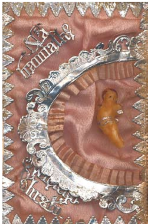
fol. Muzeum Historii Katowic

Potrzebujemy w życiu pamiątek – tych najstarszych i tych najnowszych. Dzięki nim wiemy, skąd idziemy, dokąd zmierzamy i kim jesteśmy. Warto je przechowywać dla siebie, dla przyszłych pokoleń. W niepowstrzymanym pędzie XXI wieku, pozwalają one zatrzymać chociaż na chwilę czas, odetchnąć, zadumać się. Chrońmy je, gdyż są częścią nas samych, pozwalają zdobywać wiedzę, uświadamiają najmłodszym, czym jest ciągłość rodziny i tradycji, stanowią zapis dawno minionych wydarzeń.