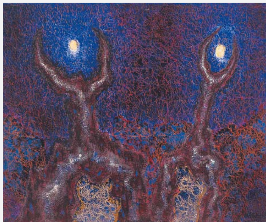
wł. Muzeum Śląskie